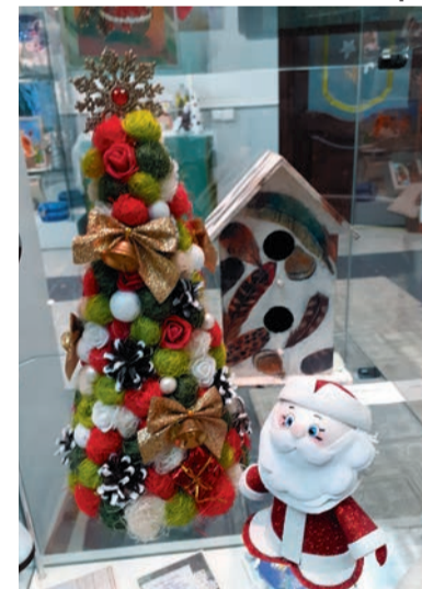
Колокольчик, шишка, шарик - получился топиарик