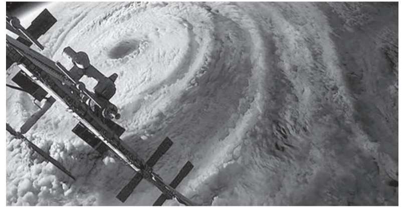
Антициклон. Вид из космоса

В новогодние каникулы не планируйте долгих прогулок и дальних поездок на автомобиле. Об этом предупреждает МЧС. Виною всему антициклон, который распространился по огромной территории от Урала до Камчатки, принёс с собой дыхание Арктики, лютую стужу и ледяные ветра.