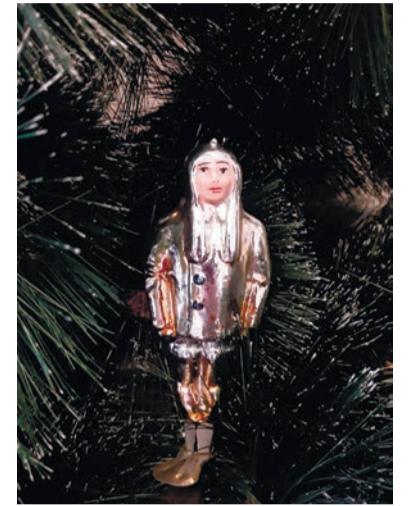
Фигурка этого пилота олицетворяет сразу двух великих советских лётчиков: Михаила ВОДОПЬЯНОВА и Валерия ЧКАЛОВА