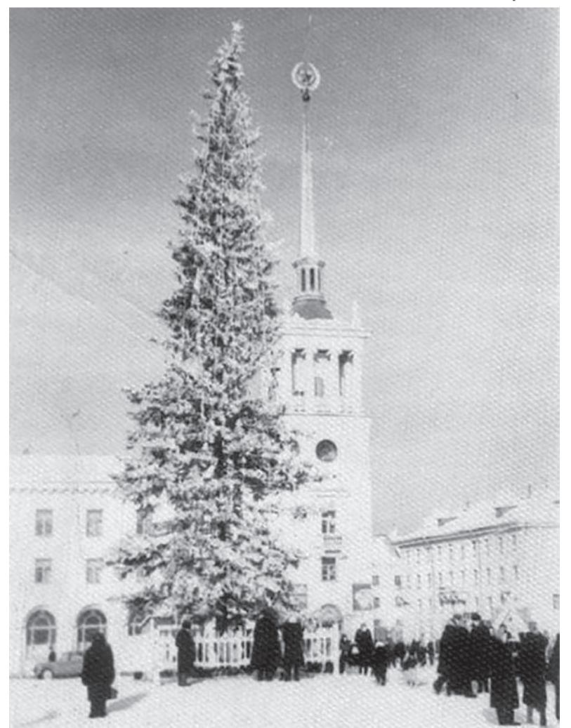
Новогодняя ёлка 1958 года