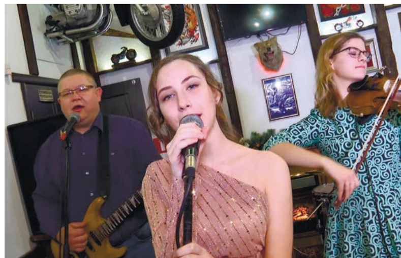
Музыкальное поздравление от группы «Счастливые случаи»