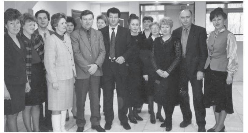
2001 год. Сотрудники и партнёры Управления Пенсионного фонда в Ангарске

- Я сдержанно относилась к негативным публикациям в СМИ, работала по закону и по совести, понимала, что всё новое в обществе принимают критично. Но для моего отца-фронтовика каждая такая