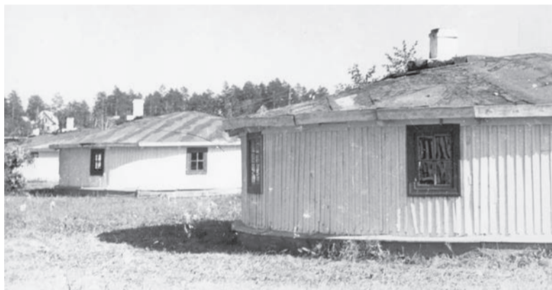
По количеству печных труб на крыше было видно, сколько семей живёт в юрте

- После застолья все выходили на улицу к большой ёлке,