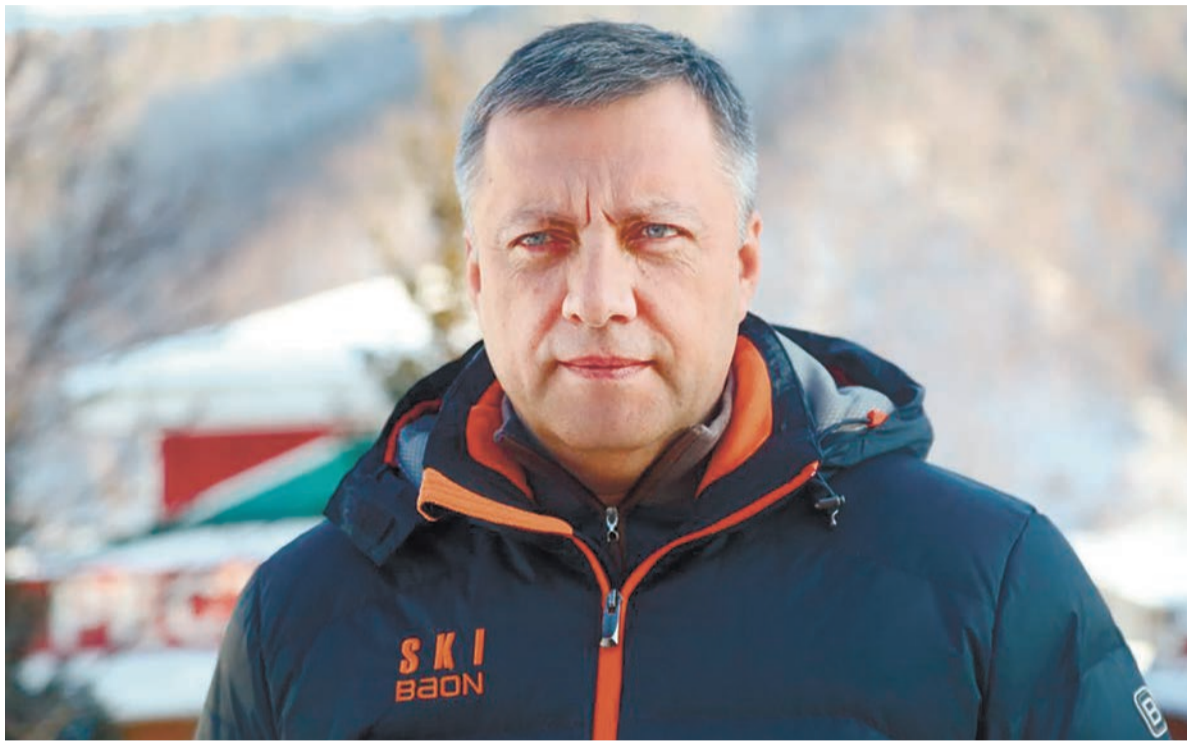
Всей семьёй любим и зимние виды спорта. Жду праздничных выходных. Надеюсь, с погодой повезёт и мы встанем на лыжи

Со сном, конечно, сложнее. Иногда это бывает и три часа, а если шесть - так уже совсем идеально.