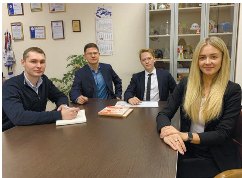
Специалисты Центра поддержки экспорта помогут вывести ваш товар на мировой рынок

Прощупав маркетинговую почву, готовим продукцию к выходу на новый рынок. Для этого придётся пройти сертификацию. В каждой стране свои требования к товару, но, как только вы докажете, что отвечаете им, для вас открывается новое, экспортное поле возможностей. Раньше можно было показать себя лицом на различных выставках, сегодня, в связи с пандемией, на сме-