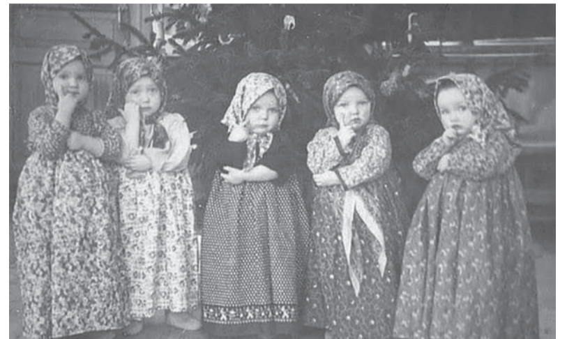
За костюмы ребяташкам давали призы: книжки, карандаши, школьные принадлежности

печенье, пряники. Домой приходили счастливые, с полными карманами сладостей.