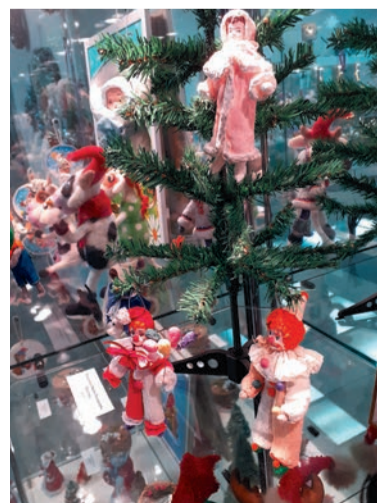
Винтажные ёлочные украшения из прошлого века