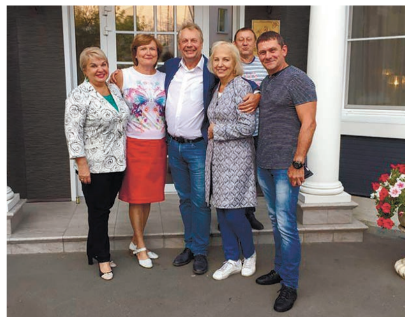
С командой молодости...