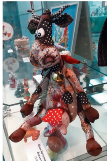
Жила-была божья корова