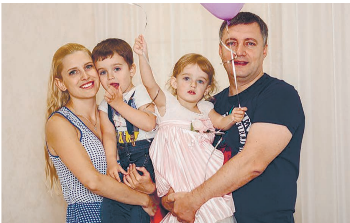
Семья - моё самое большое сокровище, самое главное богатство!