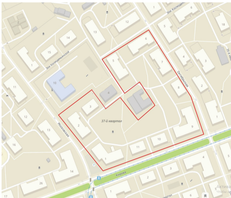
Схема границ территории, на которой осуществляется территориальное общественное самоуправление территориальным общественным самоуправлением Ангарского городского округа «37 Квартал»

Приложение №1 к решению Думы Ангарского городского округа от 25.11.2020 № 21-04/02рД