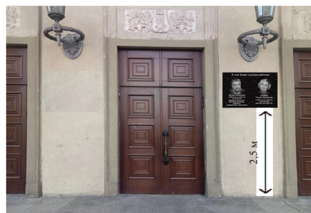
Схема установки и размещения мемориального объекта на фасаде здания Дворца культуры «Нефтехимик», по адресу: г. Ангарск, квартал 63, дом 1

Председатель Думы Ангарского городского округа