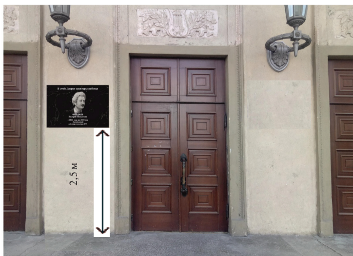
Схема установки и размещения мемориального объекта на фасаде здания Дворца культуры «Нефтехимик», по адресу: г. Ангарск, квартал 63, дом 1

Председатель Думы Ангарского городского округа