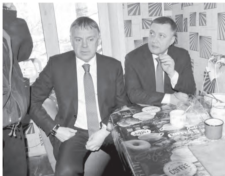
На кухне у Светланы Копыловой мэр и врио губернатора обсудили механизм расселения жителей аварийного дома

Чтобы войти в пилотный проект, я должен видеть настроение жителей этого дома. Если настроение будет позитивным, значит, мы договоримся. Если понимаем, что жители не могут прийти к общему мнению, значит, мы берём другой объект. Думаю, месяца хватит, чтобы определиться. 1 апреля жду предложений с учётом желаний жителей этого дома, - обратился к руководству города Игорь Кобзев. - Это будет первый совместный проект жителей, муниципалитета и правительства Иркутской области. Если он удастся, то мы параллельно готовим обоснование и научную базу, которая нам поможет в целом доказать, что более 1300 домов находятся в таком же положении и требуют дополнительного обследования и включения нас в федеральную программу.