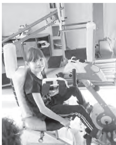
В реабилитационном центре городской детской больницы созданы условия для лечения и отдыха детей

В каких общеобразовательных школах принимают на об-