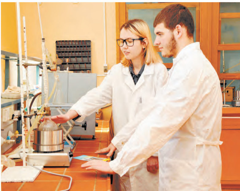
В лаборатории химии и технологии переработки нефти и газа студенты теперь могут применять современные колбагреватели

ла использовать гаджеты - ей так удобнее получать информацию. Есть возможность с любого компьютера и даже с телефона загрузить по паролю нужный учебник и заниматься в техникуме или дома. В бумажном варианте мы приобретаем только редкие издания по профильным дисциплинам, которых нет в цифровом формате, - пояснила заместитель директора.