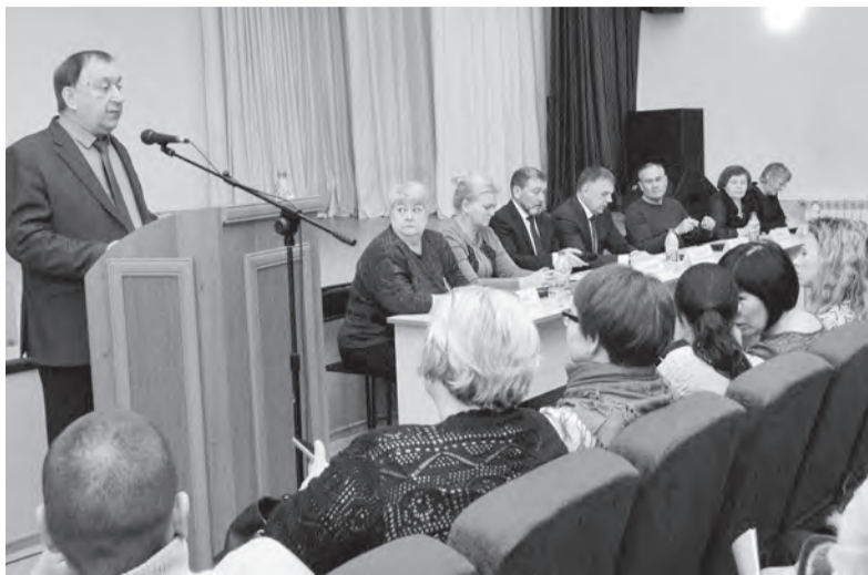
По передаче электросетей «Облкоммунэнерго» сложилась липкая ситуация, когда не отказывают, но и не принимают никаких реальных мер

А ещё мне в «Скворушке» посоветовали обратить внимание на самые раннецветущие петунии серии « Сакссес ». Эта петуния, наоборот, с короткими междоузлиями, зато образует просто невероятно пышную шапку из цветов диаметром 10-12 сантиметров. Обязательно надо такую вырастить. И сразу целую клумбу, чтобы за один