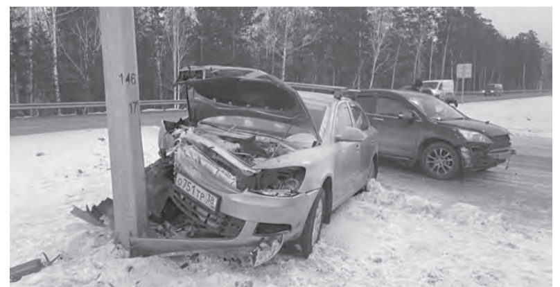
По вине коллеги-автомобилиста иномарка «встретилась» лицом к лицу с опорой освещения