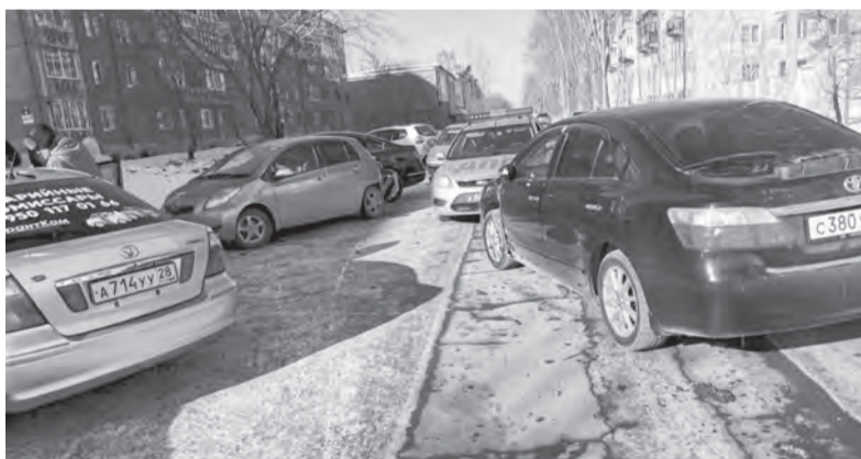
На улице Красной 15 февраля участниками ДТП стали сразу четыре машины, причём две из них спокойно стояли на парковке

13 февраля на автодороге Р-255 «Сибирь» водитель «Хонды ЦР-В» пытался развернуться и столкнулся со «Шкодой-Октавия», двигавшейся в попутном направлении, после чего «Шкода» врезалась в опору освещения.