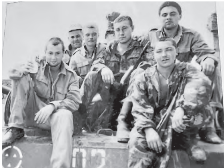
Бойцы служили в одном подразделении, вместе участвовали в боях и не знали, кто завтра останется в живых

Тогда ангел-хранитель сбегает солдата от падения в про-