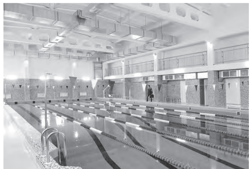
Шесть дорожек по 25 метров в длину. По техническому «фаршу» этот бассейн один из лучших в округе