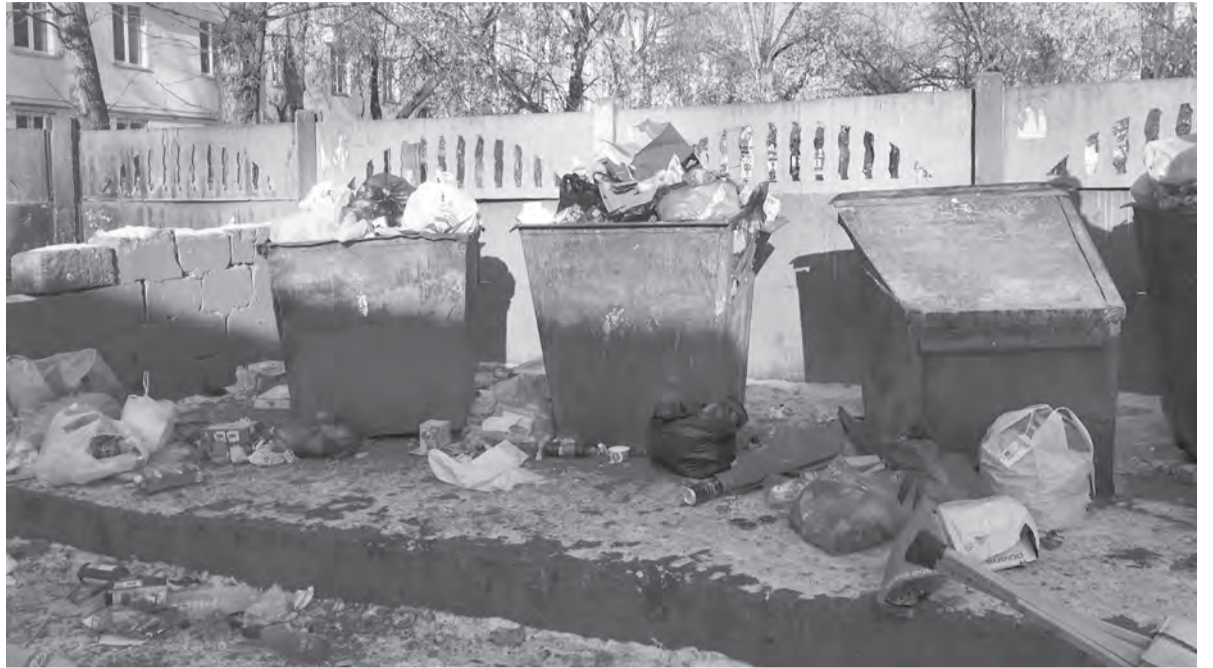
Так выглядит мусорка в одном из дворов в центре города

Как мусорный оператор объяснил появление некорректных счетов