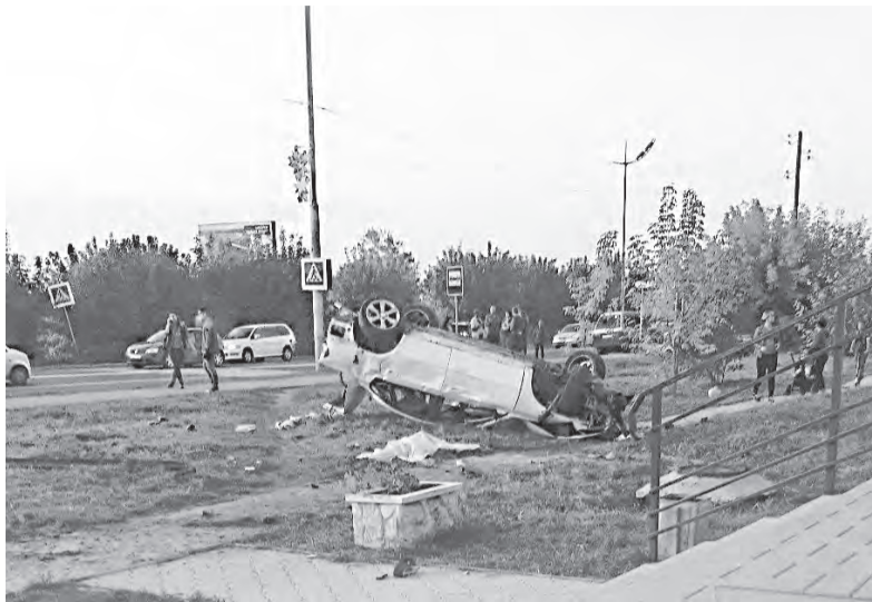
Экспертиза установила, что любитель дорожных шашек ехал по городу со скоростью 120 км/ч. Впрочем, нарушать правила ему не впервой - к административной ответственности его привлекали более 20 раз

Экспертиза установила, что любитель дорожных шашек ехал по городу со скоростью 120 км/ч. Впрочем, нарушать правила ему не впервой - к административной ответственности его привлекали более 20 раз. Однажды он даже скрылся с места ДТП, за что был на сутки наказан арестом. На этот раз гонки унесли три жизни (пассажиры иномарки и двоих пешеходов) и грозят лишением свободы сроком до 7 лет. Мама погибшей девушки решила не участвовать в процессе и попросила суд рассмотреть дело в её отсутствие. Пассажиры «Субару» получили самые тяжёлые травмы - её выбросило через лобовое стекло прямо