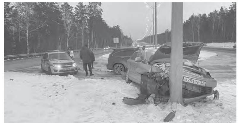
Ранним утром 15 февраля водитель «Хёндай-Солярис», двигаясь по автодороге «А» в сторону Ангарска, наехал на пешехода, который шёл по проезжей части в попутном направлении. В результате ДТП пешеход был травмирован.

Подготовила Анастасия ДОЛГОПОЛОВА.