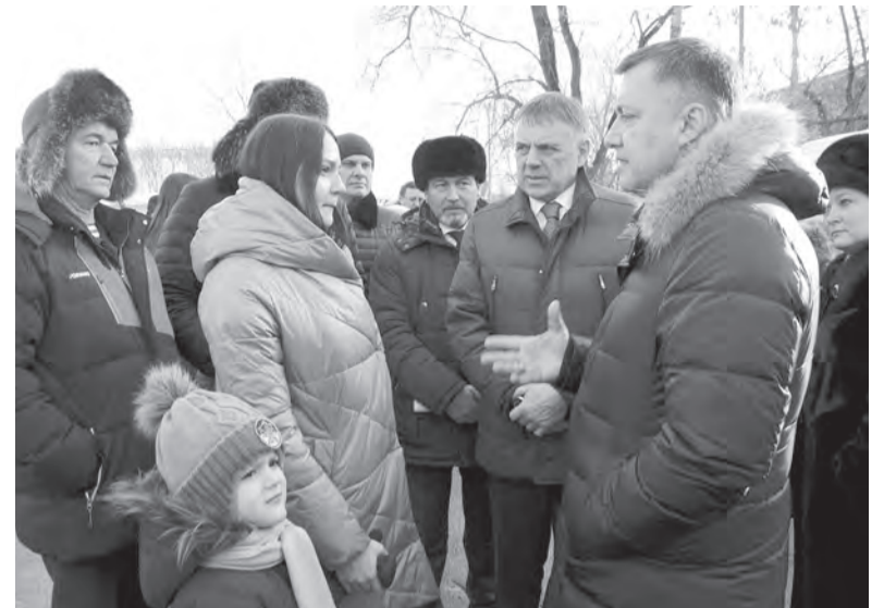
У жителей хрущёвки на Восточной есть месяц, чтобы определиться будут они участвовать в программе реновации или нет