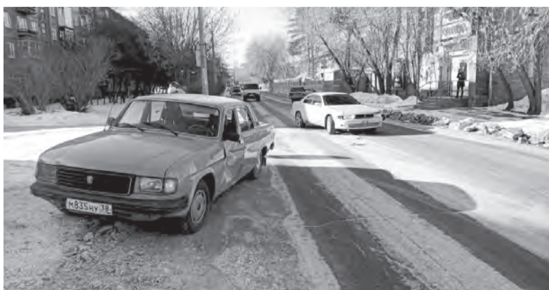
Ремонт двум машинам потребуется после ДТП на улице Гражданской, никто из людей в результате столкновения не пострадал