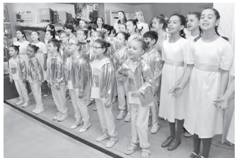
Гостей встречал хор гимназисток

шения. Большинство из них сегодня даже не видны глазу. К примеру, в общей сложности более 1000 метров деформационного шва сейчас скрываются за внутренней отделкой. По существу строители разрезали всю коробку здания на отдельные блоки. Если бы специалисты этого не сделали, в дальнейшем могло произойти обрушение конструкций. Деформационный шов, укрепленный металлом и обустроенный специальной резиной, надёжно компенсирует движение блоков между собой.