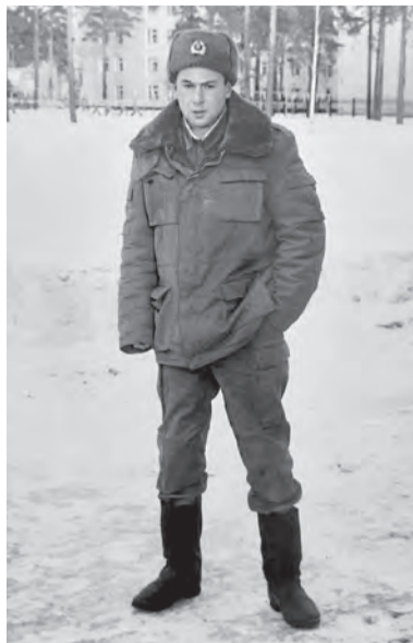
Это фото сын прислал маме из Чечни. В горячей точке он прослужил полгода