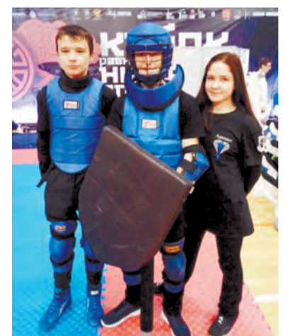
Сейчас в клубе «Адамант» занимаются более 30 человек в возрасте от 7 до 44 лет