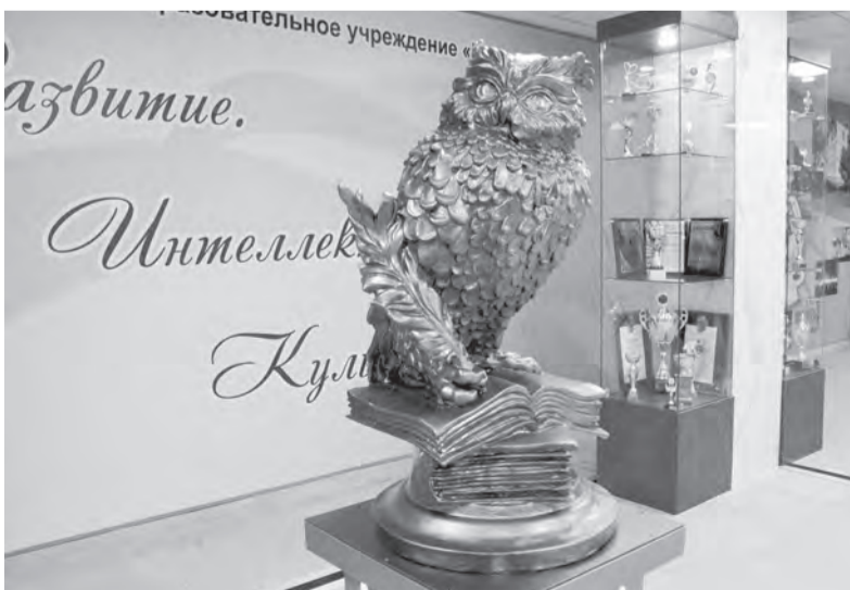
Если сложить общую площадь клубного и спортивного блоков, она окажется больше площади двух учебных корпусов