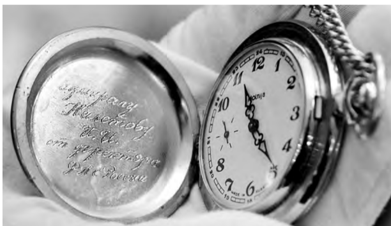
В дар музею Иннокентий Налётов вручил карманные часы с гравировкой

хронометров, - заметил Иннокентий Налётов. - У меня тоже есть небольшая коллекция на-