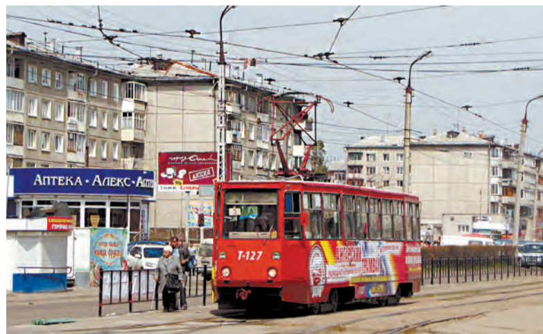
В 1989 году по новым рельсам был запущен маршрут №3. Трамвай проходит из одного края города в другой - от 17 микрорайона до Майска. Этот маршрут по-прежнему популярен у ангарчан