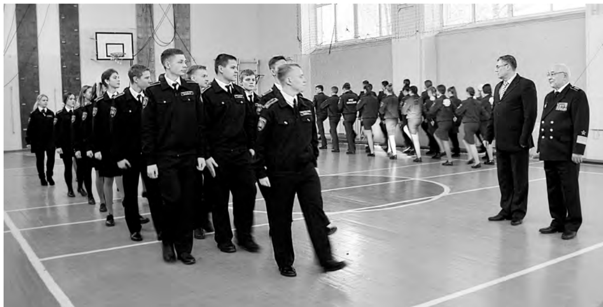
Равнение на адмирала! Курсанты школы №39 приветствуют гостей

Гости из землячества «Байкал» подарили Ангарску адмиральские часы