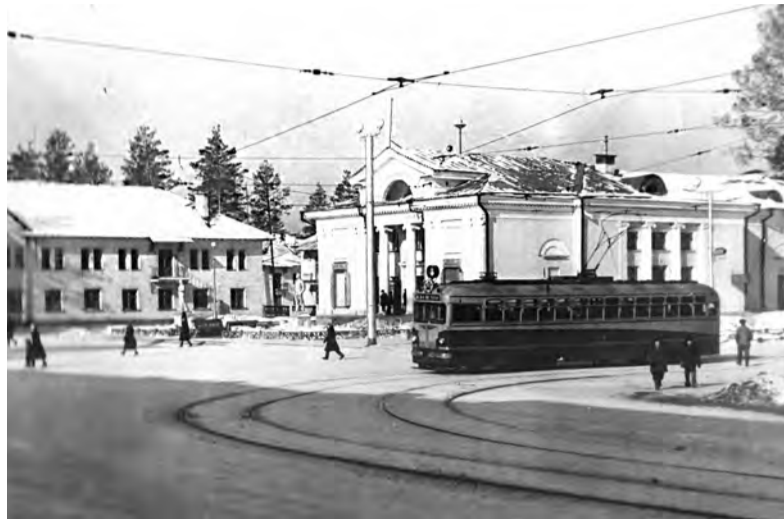
1954 год. Площадь у кинотеатра «Победа». Обратите внимание, трамвайный путь проложен в одном направлении - в сторону автостанции. Маршрут от кинотеатра «Победа» до микрорайона Байкальск был построен к началу 1960 года

У предприятия «Ангарский трамвай» юбилей - 65 лет