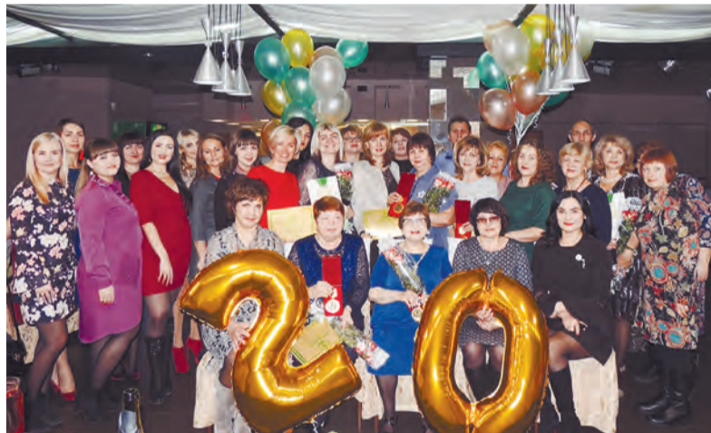
2018 год - юбилейный для Ангарского филиала компании

гиона, выбирающих страховую защиту РЕСО-Гарантии, растёт с каждым годом. Самыми востребованными в регионе остаются автострахование, страхование имущества физических и юридических лиц, страхование ответственности, медицинское страхование, а также страхование от несчастных случаев. С этого года компания предлагает своим клиентам новые страховые программы - инвестиционное страхование жизни и полис добровольного медицинского страхования «Телемедицина».