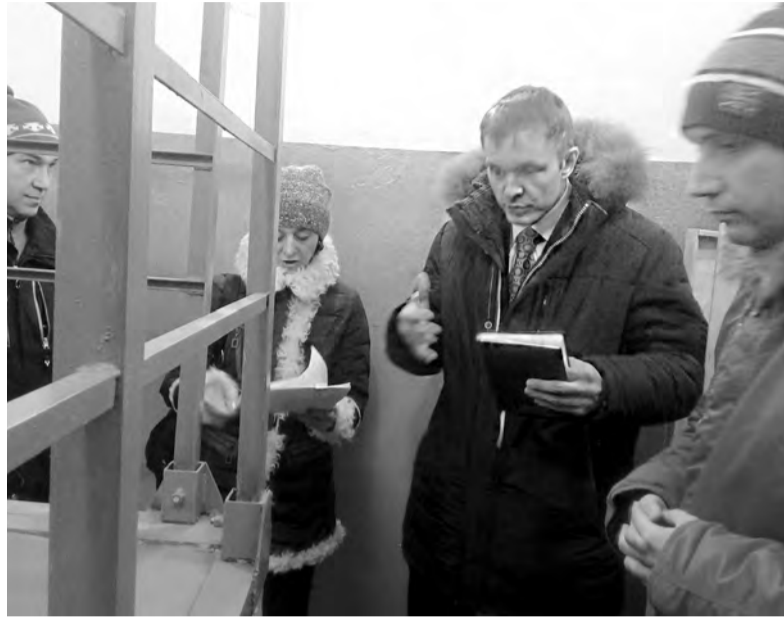
23 ноября в 8 и 10 микрорайонах Ангарска снова попытались запустить заменённые по капремонту лифты. Сделать это получилось только к ночи. И только после разговора с подрядчиками в прокуратуре

Послезавтра заканчивается последний срок замены лифтов, однако большая часть работ не окончена