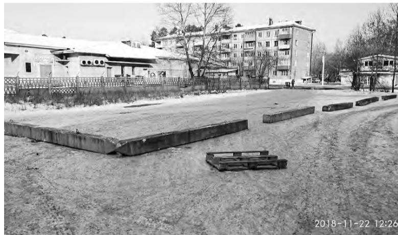
Жители уже договаривались с предпринимателем - он согласился сохранить дорогу, пешеходный проход и расстояние от торца дома до стены строящегося здания 10 метров. Но на днях здесь появились бетонные блоки...

Дело в том, что два указанных дома соединены аркой, заехать во двор или выехать из него жители, а также пожарные машины и «скорая» могут либо через эту арку, либо со стороны того самого земельного участка, который находится в аренде. Когда-то в очередные выборы (жители и не помнят, в каком году) на этом участке появилась асфальтированная дорога. Только вот тот, кто её построил (имя благодетеля история не сохранила), «забыл»