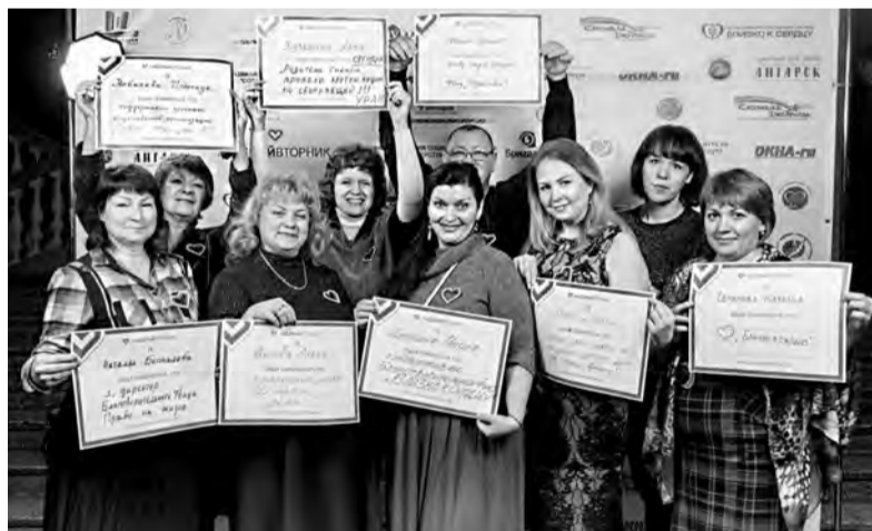
Перед спектаклем можно было поучаствовать во флешмобе «Неделя признаний» и сфотографироваться с плакатом акции «Щедрый вторник»

Нужно отметить, что ангарчане охотно откликнулись на предложение «Нового Ангар-