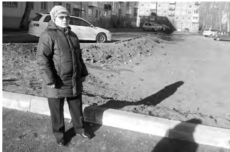
9 ноября. 84 квартал, дом 7. Снега ещё нет, зато есть время, чтобы наконец-то сделать в этом дворе детскую площадку и установить турники

Ремонт дворов выполнен почти на 100%, но хотелось без «почти»