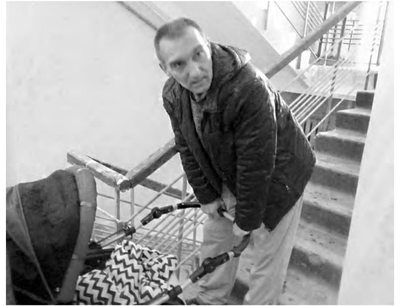
Жители вот уже несколько месяцев продолжают ходить пешком по этажам: с колясками и маленькими детьми, с тросточками и больными спинами ...