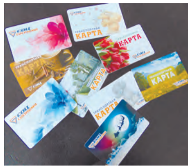
Пассажир может выбрать разное оформление «Электронного кошелька»