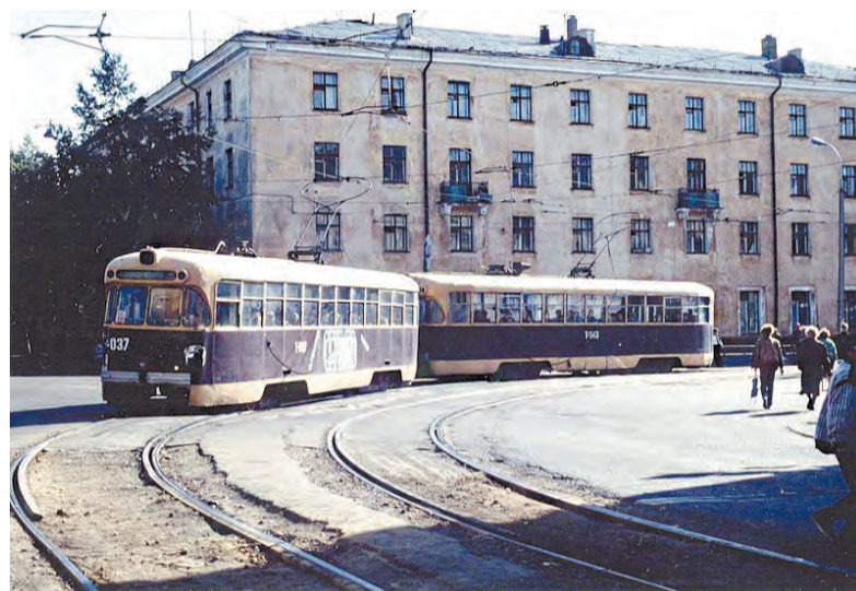
Поворот на улице Горького. Маршрут №6, идущий через весь город - от 205 квартала до Сангородка, был крайне востребован. Чтобы увезти всех пассажиров, особенно в часы пик, применялись сцепки из двух вагонов. Сейчас это неактуально

гарск и Майск соединили трамвайной линией, проложенной через Сангородок, Майский вокзал, а затем далее - в посёлки Цементный и Шеститысячник.