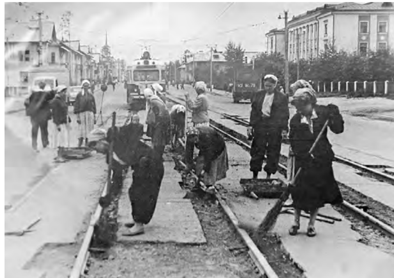
Эту фотографию, датированную 1954 годом, с подписью «Строительство трамвайной линии в городе Ангарске», нам удалось отыскать в интернете на одном из англоязычных сайтов. Женская бригада с ломом и лопатами работает на участке стального пути перед автостанцией. За спиной работниц - здание ремесленного училища №4 (сегодня это колледж экономики, сервиса и туризма)