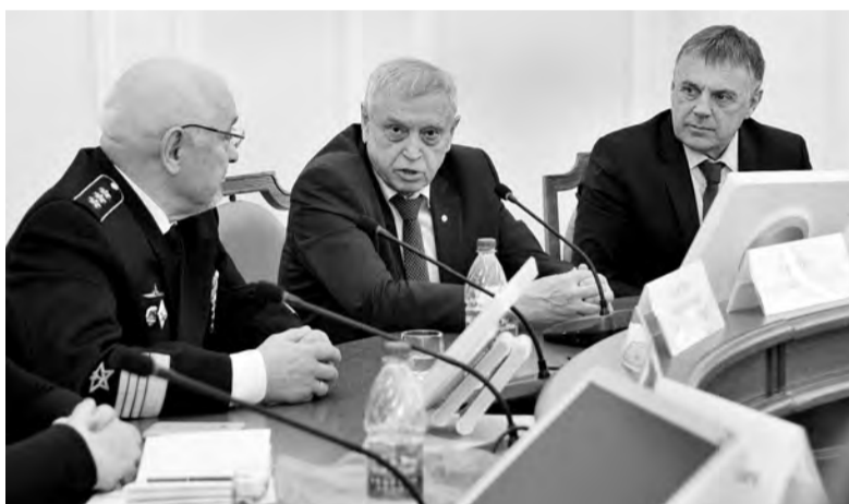
Взаимоотношения с землячеством имеют не формальный характер, а трансформируются в знаковые события. Например, впервые спектакль по драме Валерия Хайрюзова «Мать богов» показали в нашем городе