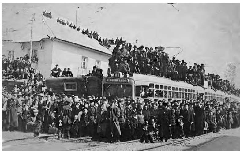
Открытие очередной секции первой трамвайной линии стало всенародным праздником. Даже интеллигентные товарищи в шляпах не удержались от возможности залезть на крышу трамвая