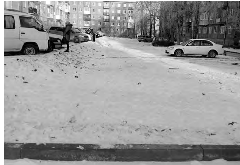
27 ноября. Тот же адрес. Снег замёл двор, но из-за срыва поставки из Красноярска турники с качелями так и не появились

Тогда руководитель подрядной организации ООО «Строй-