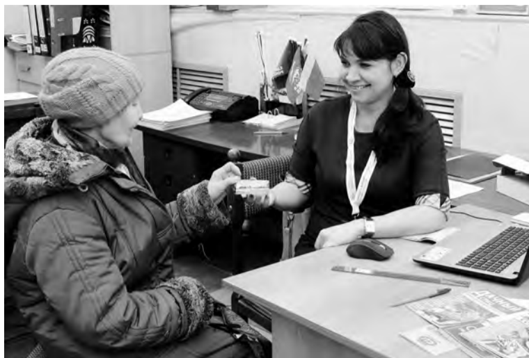
С момента оформления карты каждый участник получает возможность не просто экономить средства, приобретая товары в торговых сетях - партнёрах дисконтной бонусной программы, но и участвовать в акциях «Союза садоводов»

В числе партнёров, которые предлагают скидку на свой товар и услуги членам «Союза садоводов России», магазины электро- и стройматериалов, товаров для сада и огорода, аптеки, страховые компании и многие другие. С момента оформления карты каждый участник получает возмож-