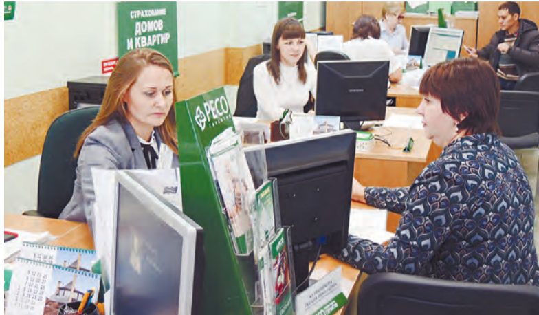
Клиенту всегда есть из чего выбрать, ведь РЕСО-Гарантия оказывает свыше 100 видов страховых услуг!