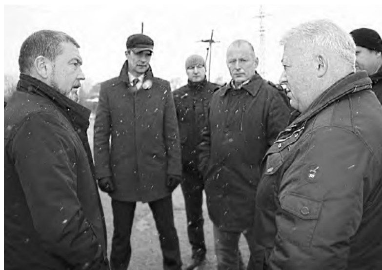
Пока решается вопрос со строительством нового моста, специалисты продолжают наблюдение за мегетским виадуком

Закрыли движение по мегетскому виадуку ненадолго - пока искали вариант возвращения повреждённой опоры к жизни. Сделали экспертизу. Выяснилось, что отремонтировать мост не получится - нужно строить новую переправу. Это вопрос не одного года, а ездить в школу, садик и на работу людям нужно каждый день. Временный выход нашли: на виадук поставили ещё один мост, который исключил нагрузку на разрушенную опору. Такое инженерное решение позволило запустить движение легкового транспорта и небольшого школьного автобуса.