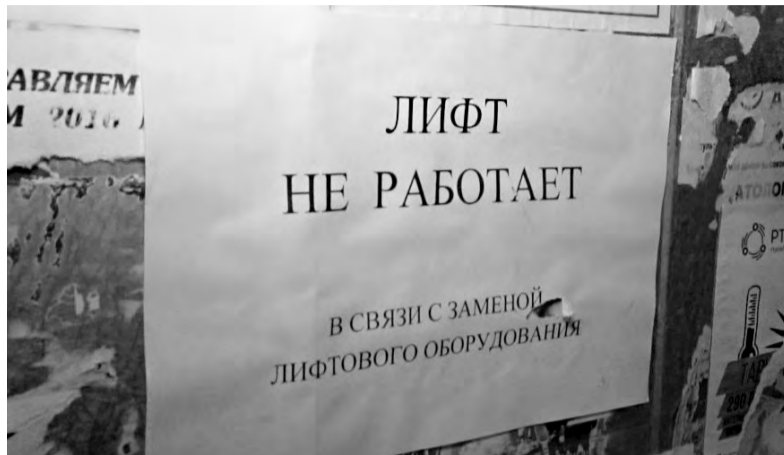
Подрядчик посетовал на то, что у рабочих, выполняющих ремонт, на руках до сих пор нет документов, подтверждающих их квалификацию

Как ремонтная кампания превратилась в несбыточную мечту и кто за это ответит