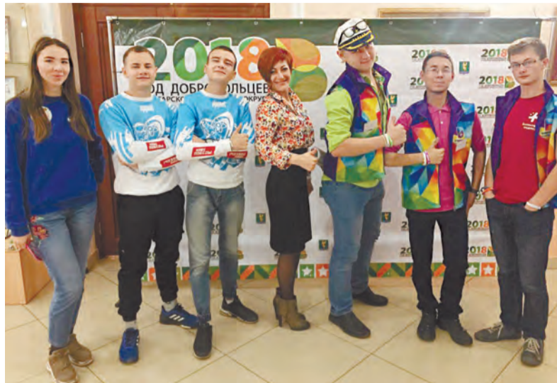
Формат мероприятия позволил и просто пообщаться, и обсудить новые идеи и уже действующие проекты, включив в дискуссию начинающих волонтеров - школьников и студентов