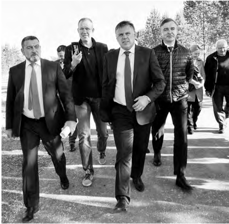
По новенькому бульвару. В эти дни центральный вход на набережную преобразуется, словно в быстром фильме кадры мелькают. Уже сегодня ангарчане не могут не заметить те перемены, которые произошли в округе за последние три года