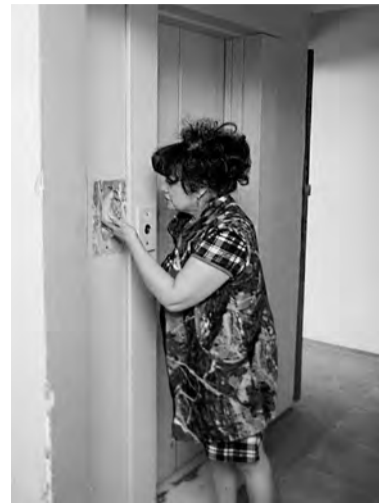
Уже полгода жильцы дома 39 «любуются» шахтой лифта через дыры, оставленные рабочими на месте прежних панелей вызова