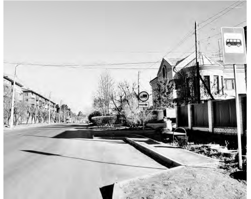
Улица 40 лет Октября, к ней жители раньше предъявляли особенно много претензий. Теперь здесь прошёл ремонт. В целом в ремонт дорог было вложено 302 млн рублей, а в следующем планируется - 328 млн. Думается, такими темпами в ближайшие годы в нашем городе решится одна из главных российских проблем