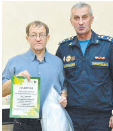
Ангарчане плавали, бегали, стреляли из винтовки, играли в настольный теннис и шахматы

С 22 сентября по 9 октября в Ангарске проходила традиционная муниципальная спартакиада «Старшее поколение», в которой приняли участие 85 горожан пенсионного возраста. Уж эти бодрые телом и духом ребята точно могут сказать: плавали, знаем! Да не только