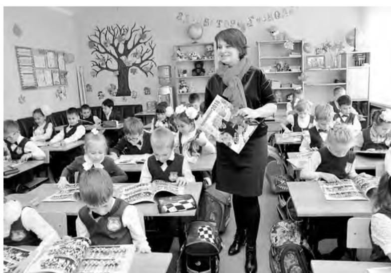
У ангарских первоклашек есть право на свой журнал высокого качества

Действительно, в Иркутске шесть лет подряд местная «Комсомолка» издаёт спецпроект «Моя любимая школа», в основе которого фотографии всех классов детей, которые пошли в первый класс. И, дей-