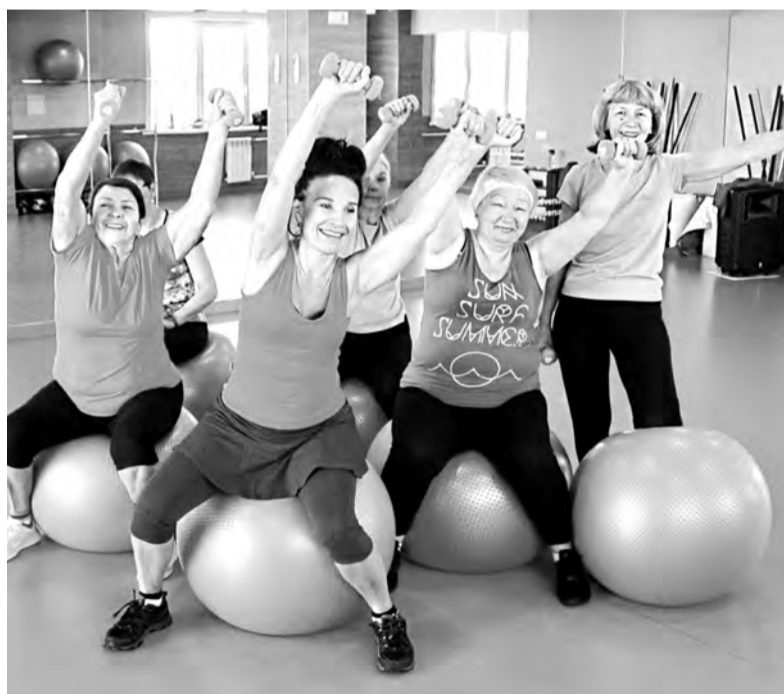
С 1 ноября в Ангарске начинает работать проект для женщин элегантного возраста «Новая Я»

лет успешно работает в Иркутске. Тем, кому повезёт записаться на занятия в Ангарске, предстоит подружиться с иркутскими ученицами, съездить в гости, перенять опыт. Да и вообще существенно расширить круг знакомств, потому что проект не ограничится платными услугами. Кроме них, планируются походы, совместные выходы в кафе. А в конце учебного года - шикарный выпускной, показ мод и фотосессии.