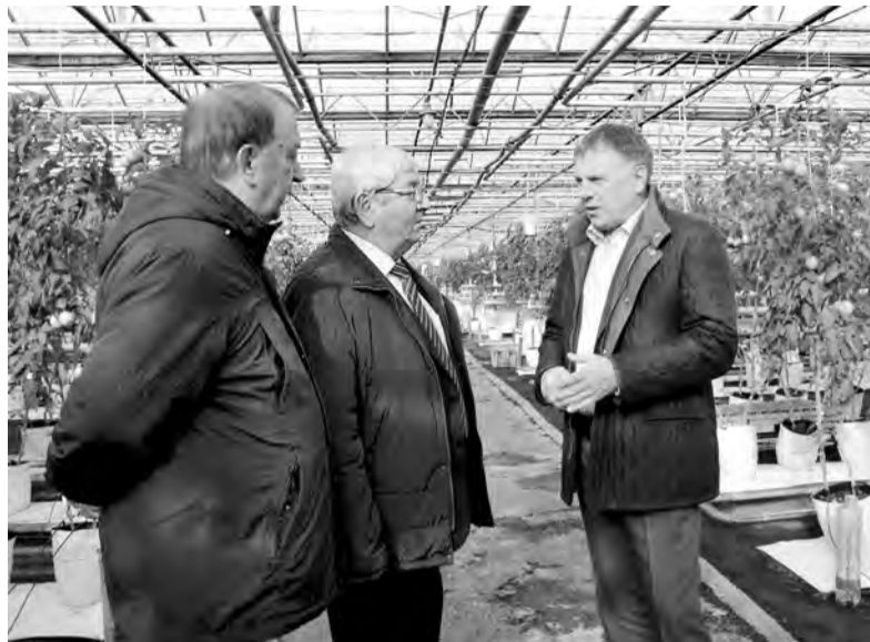
В эти дни в «Тепличном» собирают последний урожай этого сезона. А потом будут готовиться ко второму обороту. Только в начале февраля ангарчане смогут отведать овощи нового урожая

Ангарский округ - единственный муниципалитет в регионе, оказывающий бюджетную поддержку сельхозхозяйствам