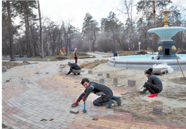
На центральной аллее и площадке вокруг фонтана будут установлены новые парковые фонари, скамейки и урны

Заканчивается ремонт входной группы сквера ДК «Нефтехимик»