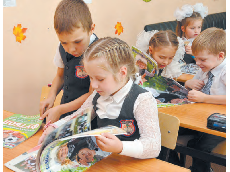
«Надо маму попросить записать меня на футбол!»