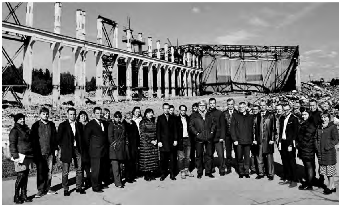
Ликвидация здания №804 завершится в ноябре 2019 года. По окончании работ ожидается, что в пределах промышленной площадки и санитарно-защитной зоны существенно улучшится экологическая обстановка

Эти своего рода «мамонты» входили в число первых производственных цехов комбината и были введены в эксплуатацию в 1958-м и 1962-м соответственно. Верой и правдой прослужили 30 лет. В связи с переходом на газодиффузионную технологию разделения изото-