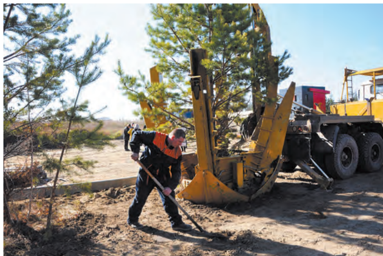
В следующем году на этом участке и вдоль набережной продолжится озеленение территории. Будут высажены сотни деревьев и кустарников: красные клёны, сосны, ели, сибирские яблони, венгерская сирень

Какие работы кипят на месте будущей набережной в Ангарске