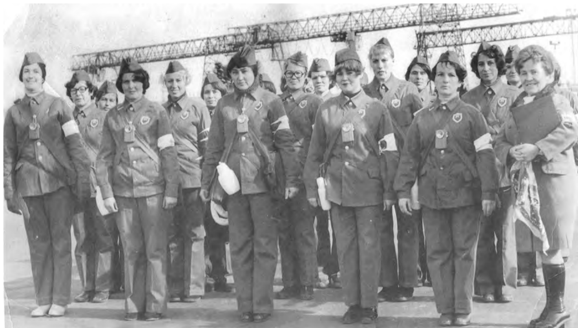
Санитарная дружина Китойской лесоперевалочной базы. «Мы мирные люди, но наш бронепоезд стоит на запасном пути»

Практически всё взрослое население посёлка работало сначала на лесопилке, потом на Китойской лесоперевалочной базе, затем - в производственном объединении «Китойлес». В лучшие годы на головном предприятии трудились 2,5 тысячи человек и по леспромхозам объединения - ещё 2 тысячи человек. Благодаря «Китойлесу» в посёлке появились благоустроенные жилые дома, детский сад, ясли, поликлиника. Особое внимание уделяли школе.