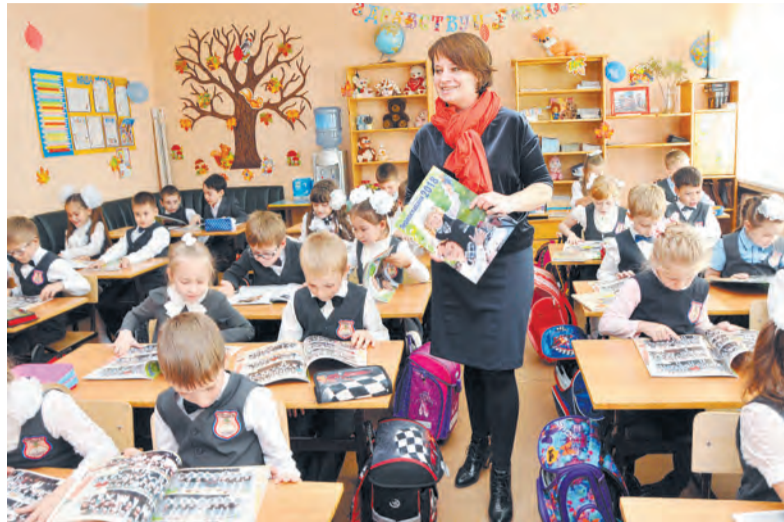
Кто первый найдёт свой класс из 119, представленных в фотоальбоме?

Кроме самих фотосессий (за них отдельное спасибо фотографам-волонтерам Дмитрию ИГНАТЕНКО, Валентине ТЕПЛЯКОВОЙ, Марии РЕМЕЗОВОЙ, Наталье КЛОЧИХИНОЙ, Артёму ЯСЕНИЦКОМУ, Олегу РОМАНОВУ, Татьяне СКАЖУТИНОЙ, Александру ХАБЕЕВУ, Виктору БРАНКОВУ), в номере