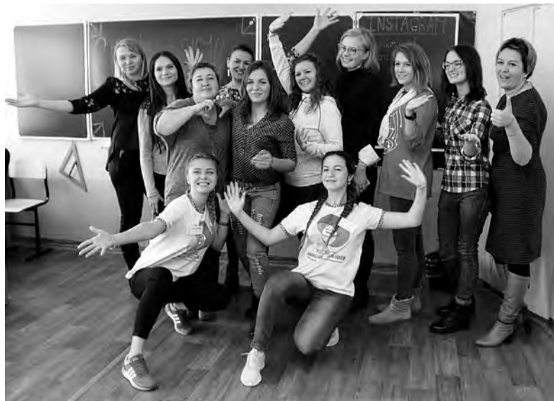
Педагоги, вожатые в тренингах работают как школьники. Через несколько дней вернутся к своим воспитанникам с новыми идеями

В Ангарск за опытом приехали учителя со всей России