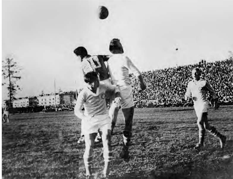
Товарищеский матч с московским «Локомотивом» смотрели даже с соседних крыш