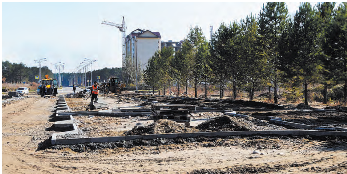
В этом году завершается первый этап благоустройства бульвара. Высажены большемерные сосны, установлен бордюрный камень, отсыпана площадка под вместительную парковку. До конца октября территорию заасфальтируют, установят фонари, скамейки и урны