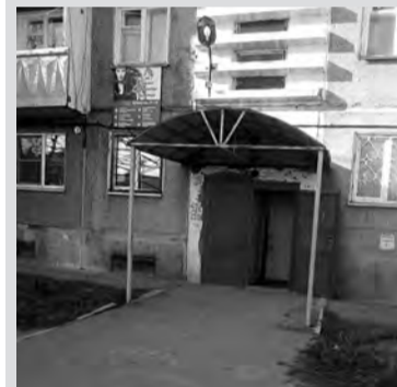
Женщине стало плохо прямо на улице около этого подъезда

Вчера в Мегете произошёл трагический случай. Молодой женщине, 34 года, около 21 часа стало плохо прямо на улице. Это произошло в 1 квартале в районе общежития. Прохожие вызвали скорую. Параллельно в группах в Viber появились сообщения о том, что если есть поблизости медицинский работник, чтобы откликнулся и по возможности подъехал к общежитию для помощи. По словам очевидцев, бригада скорой помощи ехала около 50 минут. А по приезде констатировала... смерть.