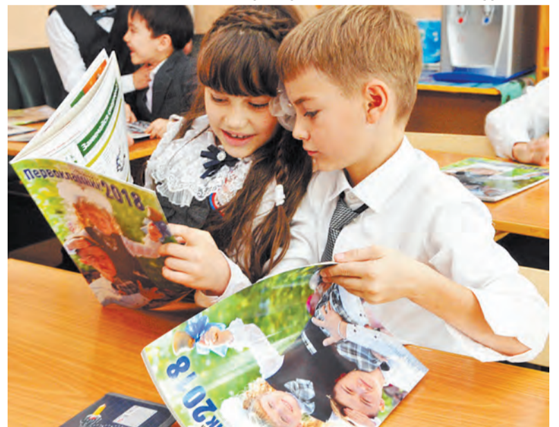
«Мне можно пойти на танцы, а тебе - на шахматы»