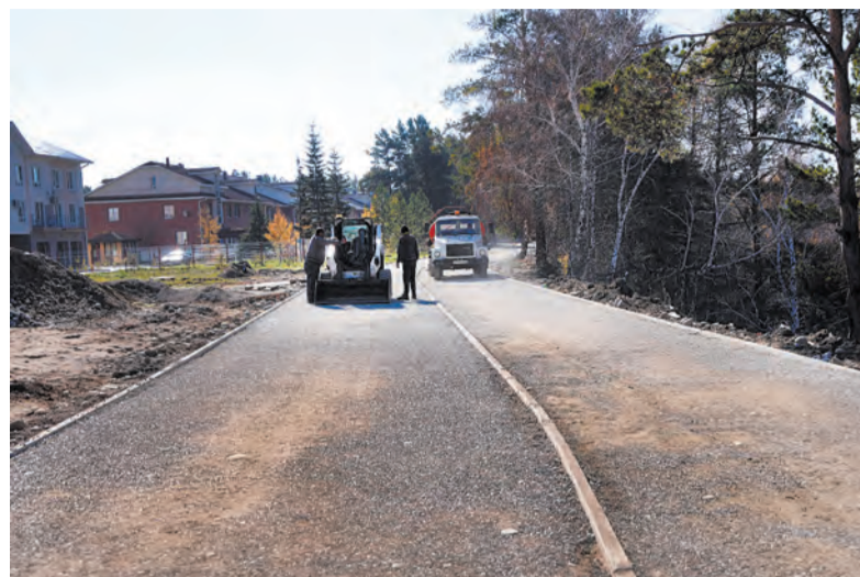
Одновременно с обустройством пешеходной дорожки к ней уже сейчас организован Индустриальный проезд вдоль 30 микрорайона. Это решило многолетнюю проблему местных жителей: вместо грунтовки они получили благоустроенные проезды

ТЕРРИТОРИЯ СТАНОВИТСЯ ПРИВЛЕКАТЕЛЬНЕЕ И КОМФОРТНЕЕ, ЧТО ДОКАЗЫВАЕТ АРИФМЕТИКА. С НАЧАЛОМ МАСШТАБНОЙ СТРОЙКИ КАПИТАЛИЗАЦИЯ ЗЕМЕЛЬНЫХ УЧАСТКОВ В МИКРОРАЙОНАХ СТАРИЦА И КИРОВА ПРИБАВИЛА К ЦЕНАМ ЕЩЁ ОДИН НОЛЬ.