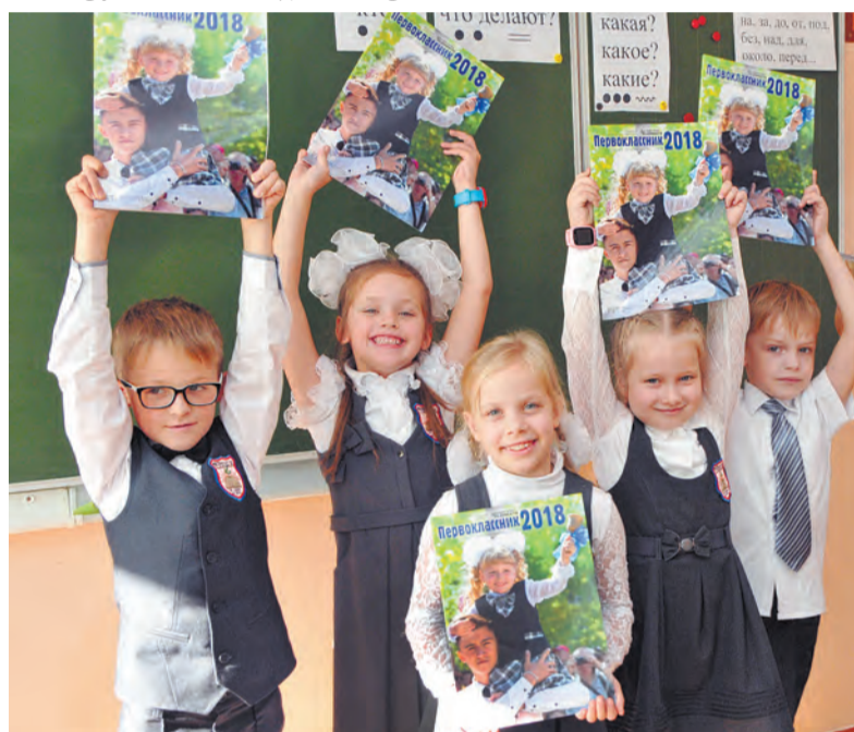
«Спасибо за подарок!» Первыми в городе получили альбом ребята из 15 школы №10

собрана полезная информация о возможностях ангарского дополнительного образования. Адреса художественных, музыкальных и спортивных школ, детских творческих центров. Пусть родителям наших первоклассников это поможет сориентироваться, как лучше развивать детские таланты. Есть в нём и горячие телефоны власти - руководителей тех направлений, благодаря которым родители смогут решить любой вопрос по образованию, культуре или спорту.