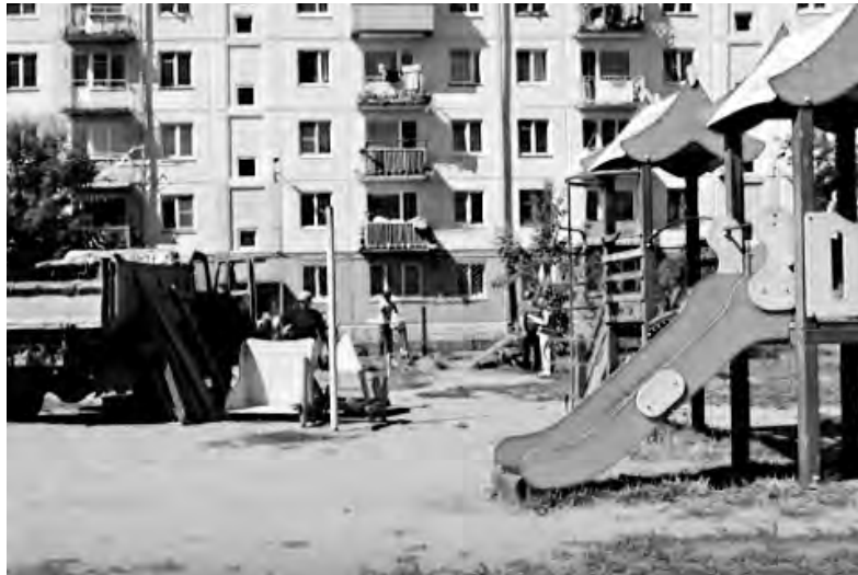
Этот детский городок не простоял и десяти лет. Получается, что управляющая компания просто-напросто решила снять с себя ответственность за игровые площадки?

После сноса старых игровых площадок взамен должны быть установлены новые