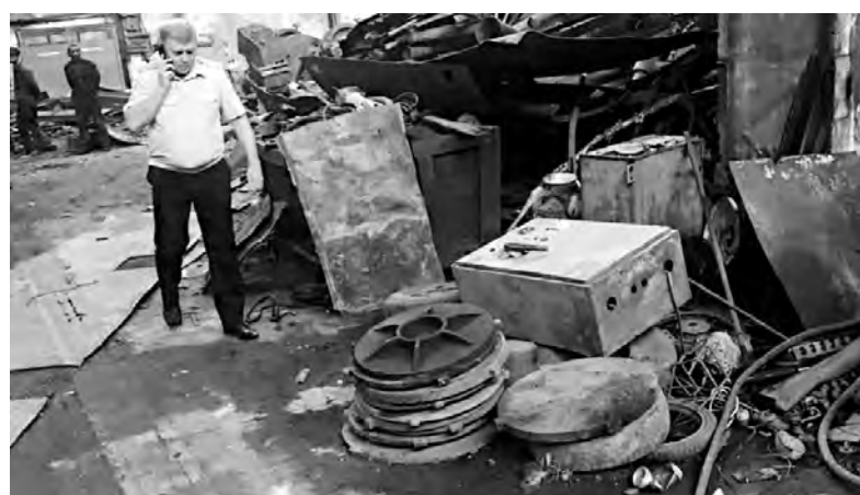
Выяснить, кто и когда привёз эти чугунные изделия на склад, у оперативников не получилось - ни один из сотрудников предприятия по сбору металлолома на русском языке не говорил

желенных крышек люков и увесистых решёток. В каких пунктах их сейчас искать - неизвестно. Возможно, часть из них лежит в той же самой куче металла, что и обнаруженная накануне партия.