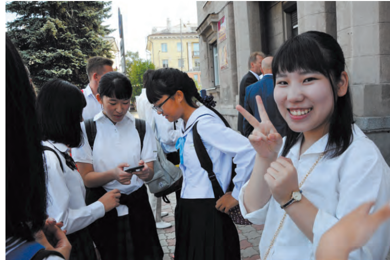
Вместе со «взрослой» делегацией в Ангарск приехали школьники