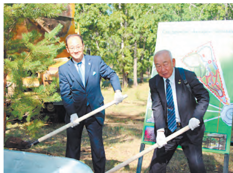
На аллее дружбы появилось первое дерево.