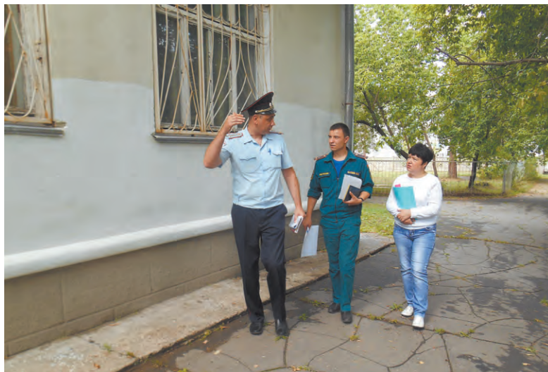
Обследование проводится с испытанием систем безопасности и видеонаблюдения

Комиссия проверит 118 образовательных учреждений