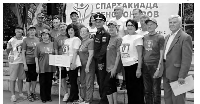
Ангарский городской округ представили две команды: «Горячие сердца» и «Оптимисты»