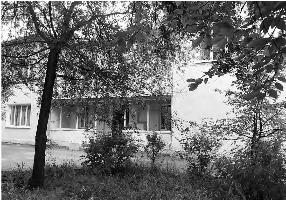
Продаётся целый имущественный комплекс с земельным участком, расположенный за ДК «Нефтехимик», в самом центре Ангарска. Раньше в нём располагался Центробанк

В чём преимущества покупки у муниципалитета