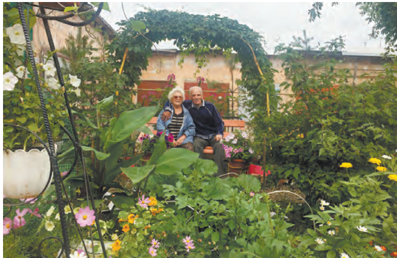
Во дворе 34 квартала жители сами сделали забор, арки поставили. Привезли семь сосен, три сирени, чубушника два и монгольский клематис.

Старую часть города жители украшают девичьим виноградом и папоротником