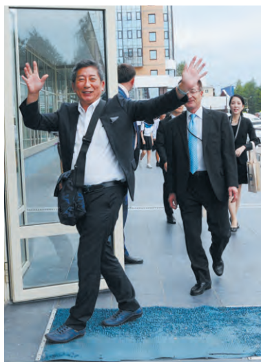
«Ангарск - очень красивый город, где хотелось бы жить»