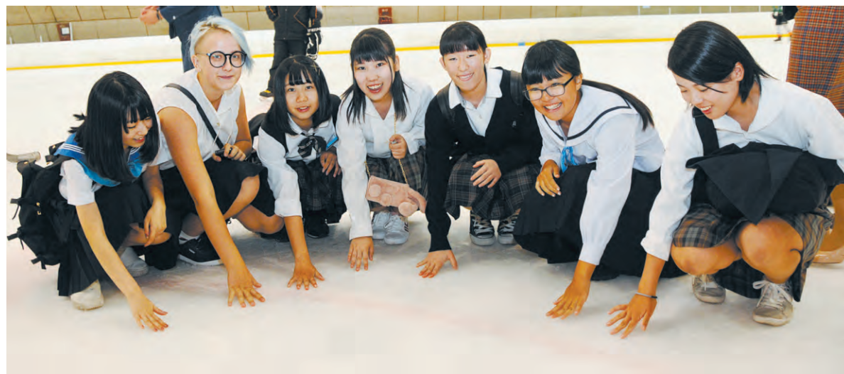
Несколько минут на льду - и страх прошёл: школьники с радостью фотографировались, с интересом прикасались ладошками к ледовому покрытию

ла. Гроза и ливень, испугавшие гостей по дороге в парк деревянных скульптур, постепенно утихли. По завершении прогулки мэр Комацу уточнил: «А сколько в вашем парке сосен?» Ответ: «25 тысяч и ещё одна» - гостя вполне удовлетворил.