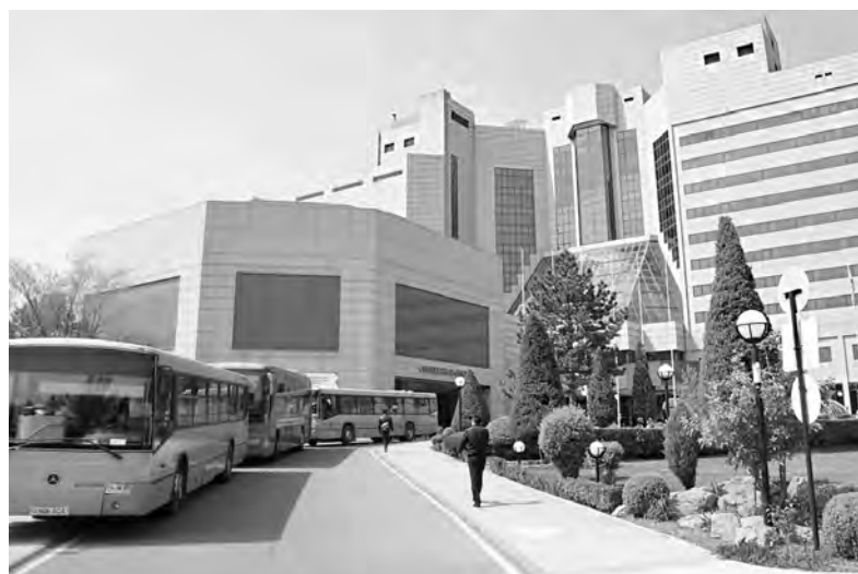
Миллионную столицу Узбекистана Ташкент интересует опыт «Автоколонны 1948», которая стабильно работает без нагрузки на бюджет

Точно так же специалисты «Автоколонны 1948» помогли организовать качественную работу по пассажирским перевозкам в ряде городов России. К ангарским транспортникам уже обращаются города Подмосковья и даже ближнее зарубежье - например, крупнейшее муниципальное транспортное предприятие Ташкента. Они