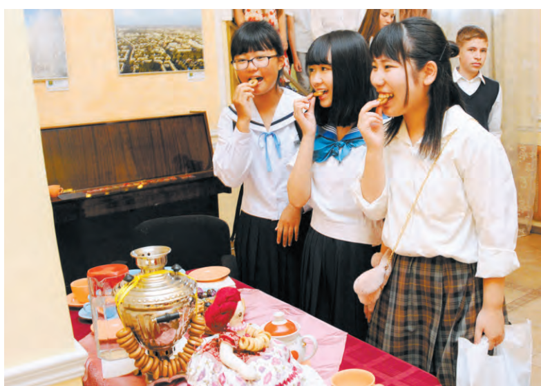
Молодёжная делегация будет находиться в Ангарске до 9 августа. Японскую молодёжь ждёт насыщенная программа