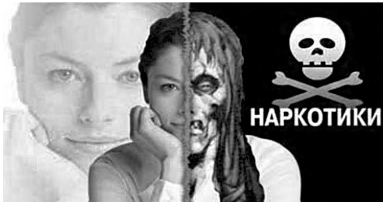
Время выбирать жизнь