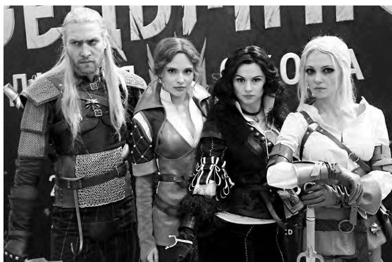
На конкурс уже подано более 100 заявок, это не считая артистов, выступающих вне конкурсной программы

- На конкурс уже подано более 100 заявок, это не считая внеконкурсных артистов. Определённой темы нет. Всё зависит от предпочтений участников: компьютерные игры, аниме, сериалы. Есть даже заявки по книгам. Мы и раньше проводили такие фестивали, но больше склонялись к аниме-тематике, а теперь расширяем горизонты, чтобы сделать мероприятие интересным для большей аудитории, - го-