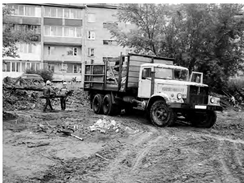
В ближайшее время все работы по очистке должны быть окончены. Правда для этого понадобился волшебный пинок

рорайонов Китоа и Новый-4 на очередной встрече с руководством администрации и депутатами Думы Ангарского округа попросили поторопить Управление ЖКХ с расчисткой земли после переселения. Что ж, запрос оправданный! Неоднократно сигнализировал о проблеме и «Ангарский Водоканал».