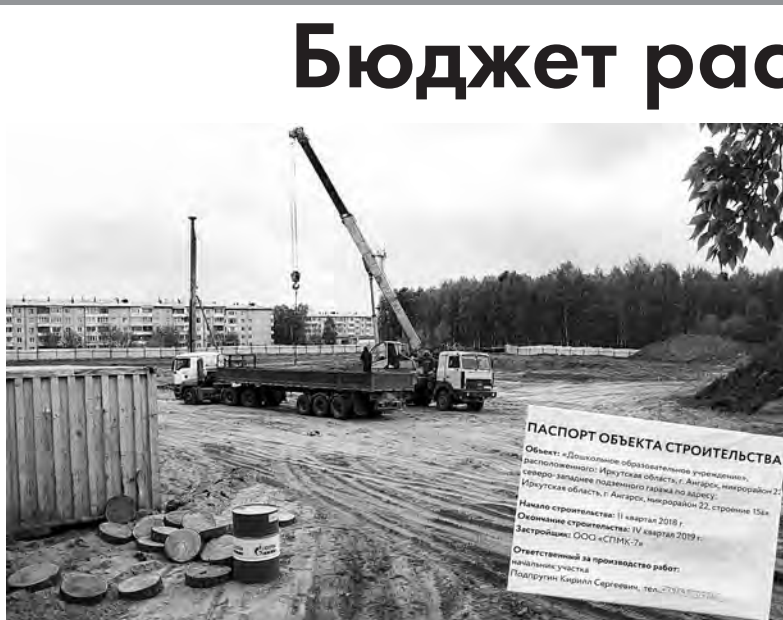
Доходы бюджета увеличились за счёт межбюджетных трансфертов. Все эти средства будут направлены на определённые цели. В этом году основная сумма субсидии идёт на строительство детского сада в 22 микрорайоне

Кроме того, за летние месяцы была проведена серьёзная