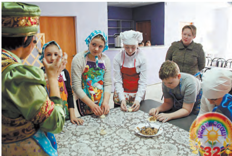
Ангарск. Школа №32. Мастер-класс по приготовлению национальных блюд

У нас активная фаза работ по строительству школ началась только два года назад. Зато результаты уже есть. Школу в Китое откроют в этом году, в 7А мкр - в следующем.