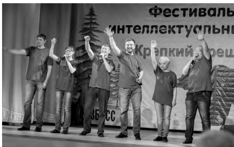
Ангарчане уже сочиняют шутки на полуфинал, который пройдёт в Санкт-Петербурге

бирского Федерального округа демонстрировали свой интеллект в играх «Что? Где? Когда?» и «Брейн-ринг», а чувством юмора блистали в любимой всеми игре КВН. И единствен-