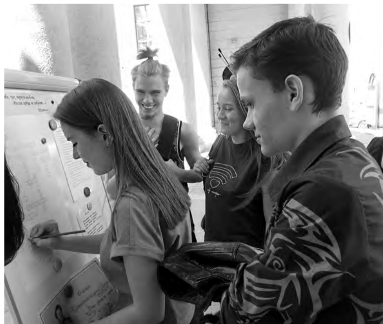
Читальный зал в парке ДК «Нефтехимиков»