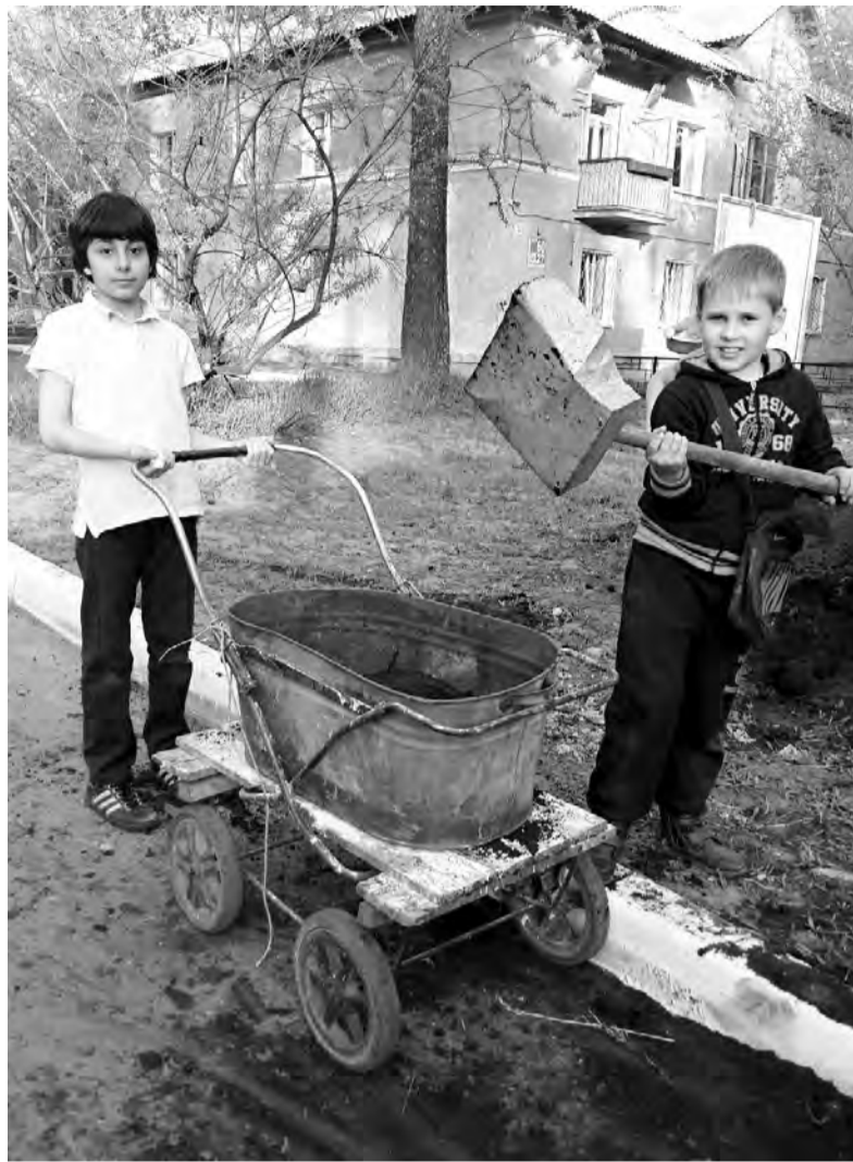
Жители «Перекрёстка» всех возрастов уже успели взяться за лопаты и привели свои дворы в порядок

Чем живёт первое в Ангарске территориальное общественное самоуправление