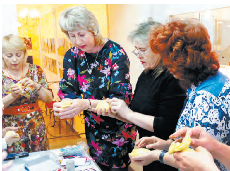
Выставка «Радость творчества» будет работать до 7 июля по адресу: Ангарск, ул. К. Маркса, 41, Художественный центр

На экспонаты без улыбки не взглянешь. Довольные жизнью