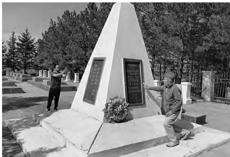
На месте бывших сражений создан мемориальный комплекс

Япония, оккупировавшая Китай, избегала столкновения с СССР. Поэтому был разработан план обороны, который предусматривал упорное сопротивление на всей пригра-