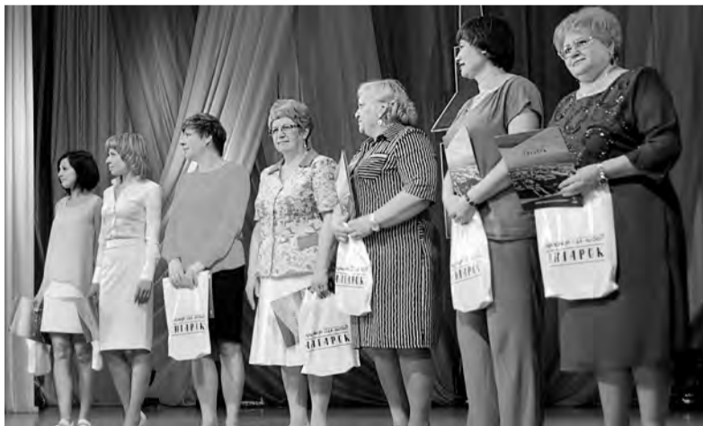
Награды разного уровня за добросовестный труд были вручены 130 работникам социальной сферы