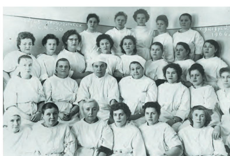
Коллектив хирургического отделения МСЧ-36. 1964 год