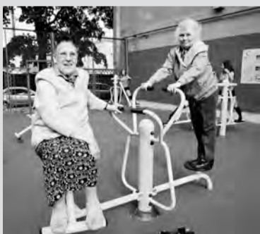
Физкультура и общение - вот о чём мечтает старшее поколение