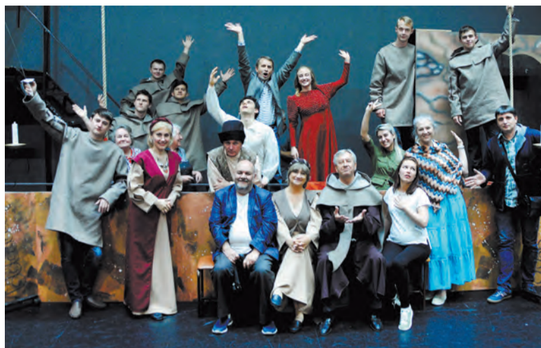
В спектакле заняты молодые артисты и мэтры «Чудака»

В Ангарске поставили новую версию шекспировской трагедии