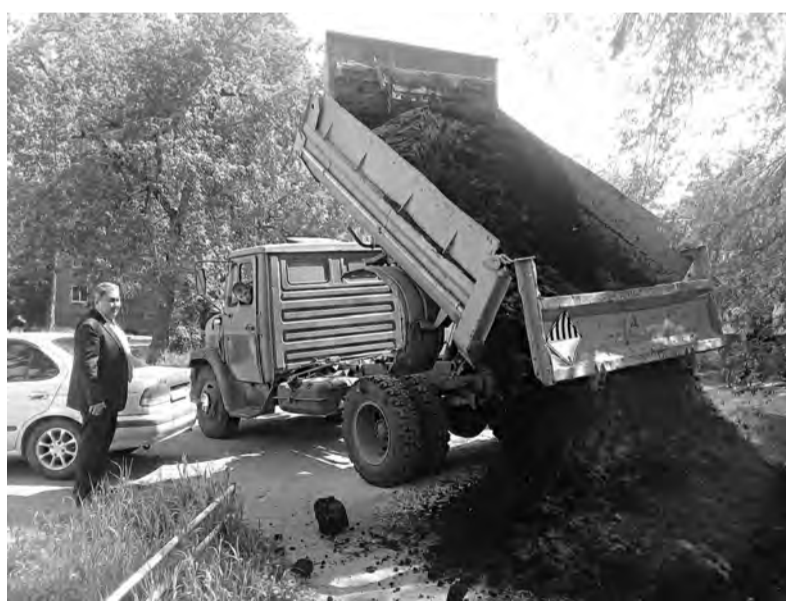
В этот день чернозём привезли и сюда. Уже вечером соседи собрались и все вместе разнесли землю по палисадникам около дома