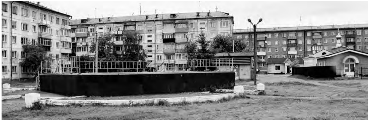
С помощью средств бюджета Ангарского округа этим летом начнётся реконструкция центральной площади Мегета. Здесь появится 16 стационарных лавочек, урны, тротуары и детский городок

Развитие внегородских территорий - на особом контроле у ангарской власти