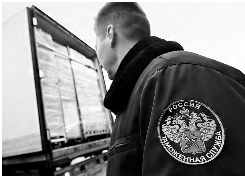
В случае ликвидации поста в Ангарске нашим предпринимателям придётся готовиться к дополнительным транспортным расходам и потере времени на совершение операций

Всего полтора месяца назад Ангарский таможенный пост отмечал своё 25-летие. И тогда именинника действительно было с чем поздравить. По итогам 2017 года ангарская таможня показала выдающиеся результаты (к примеру, инспекторы, перевыполнив установленный сверху план, перечисли в федеральный бюджет 317 млн рублей). За качественную работу Ангарский таможенный пост заслуженно получил от руководства твёрдую оценку «отлично». В свете этого, как гром среди ясного неба, для ангарчан, так или иначе взаимодействующих с таможней, стала недавняя новость - таможенный пост в нашем городе собираются ликвидировать. Откуда «растут ноги» у этой информации, и чем грозит Ангарскому городскому округу исчезновение таможенного поста? В этом мы и попытались разобраться.