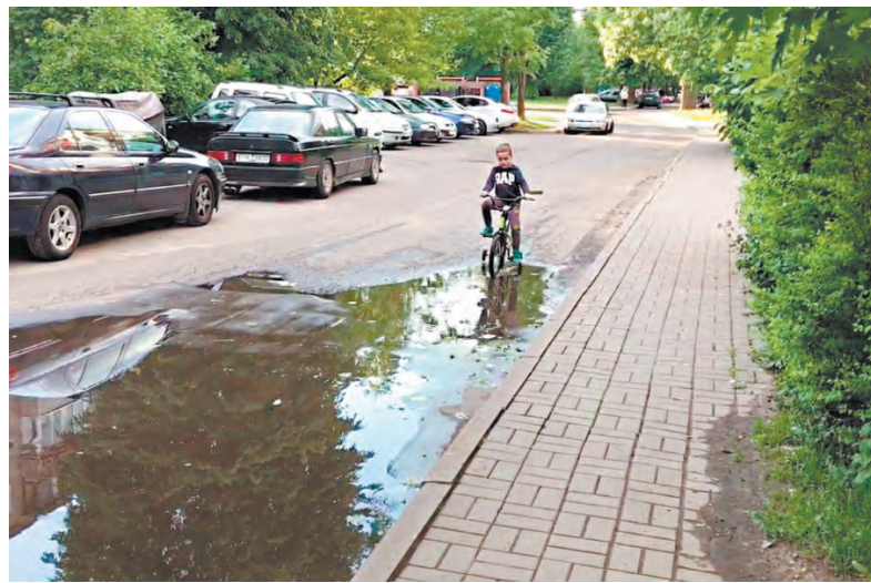
Проблемы возникают, когда дети предоставлены сами себе

У нас в СНТ меняют воздушную линию электропередач. В связи с этим всех садоводов обязали перенести электросчётчик, установить дополнительное электрооборудование и заменить ветхий провод, ведущий от столба на участок. Выполняет работу бригада электриков. Они же предоставляют оборудование. Но цены у них высокие - от 7300 рублей и выше за пакет услуг. Я сам электрик, могу приобрести в магазине точно такое же оборудование, но дешевле. Электромонтажные работы тоже могу сделать самостоятельно. Но бригадир запретил мне заниматься самостоятельным подключением моего приватизированного участка или пригласить другую бригаду, которая выполнит эту же работу за меньшую