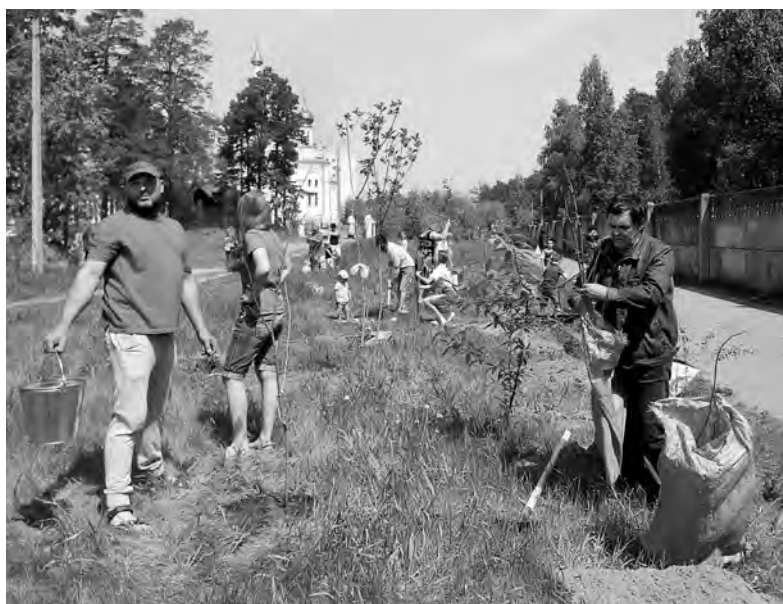
43 семьи в Ангарске посадили свои деревья, что будет подтверждено сертификатами

Нынешнему мероприятию предшествовала серьёзная подготовка, - рассказала коор-