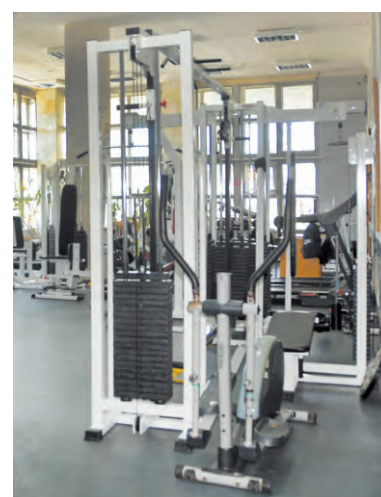
Новый тренажёр (блочная станция) эффективно помогает разрабатывать мышцы спины, плеч и ног, оказывает благотворное влияние при лечении вывихов, остеохондроза и межпозвоноковых грыж

Перед открытием Центра адаптивного спорта члены общественной организации своими силами сделали в помещении косметический ремонт, покрасили фасад, отретшировали во дворе лавочки и фонтан. Теперь в наведённой красоте можно с новыми силами стремиться побеждать болельники и достигать очередных спортивных вершин.