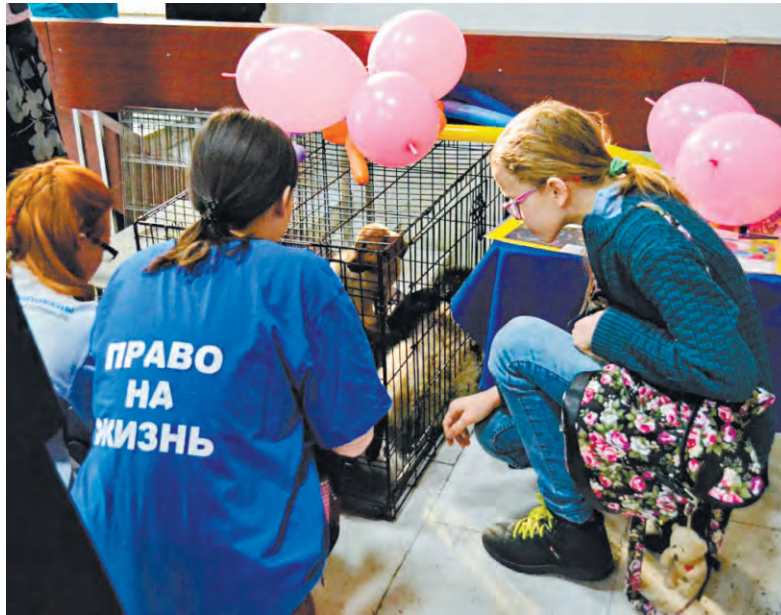
Среди победителей конкурса мини-грантов - благотворительный фонд «Право на жизнь» с проектом стерилизации животных

Какие гранты получили ангарские общественники