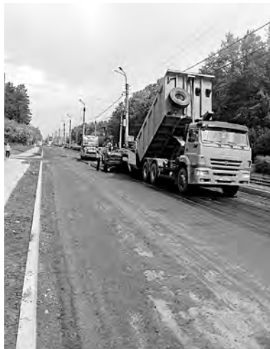
В эти дни активная работа по ремонту дорог развернулась на пяти улицах Ангарска. Требования к подрядчикам высокие, гарантийные обязательства - три года