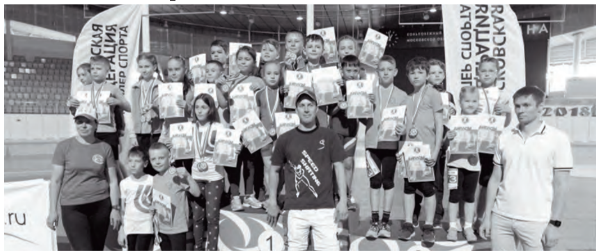
На Чемпионате России по скоростному бегу на роликовых коньках ангарчане заняли весь пьедестал почёта

Первые победы в большом спорте одержала команда юных ангарских спортсменов на чемпионате и первенстве России по скоростному бегу на роликовых коньках.