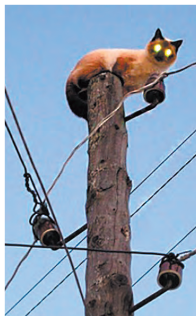
Высоко сижу, далеко гляжу, на свою поляну никого не пушу

Решение о выносе индивидуальных счётчиков электроэнергии на наружную сторону дома и замене старого электрооборудования на новое, более современное, принимается на общем собрании садоводов и связано с предписаниями энергоснабжающего предприятия и соображениями безопасности. По всей стране эти требования применяются повсеместно.