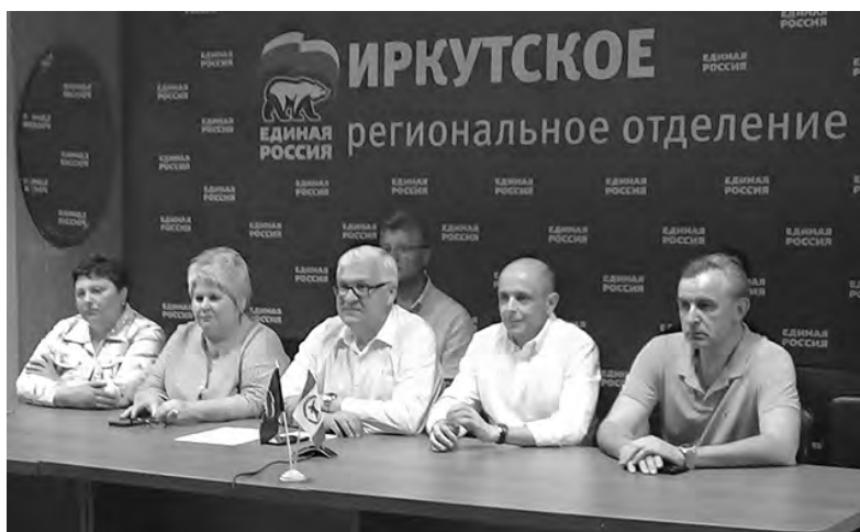
Первые итоги единого дня предварительного голосования в нашей стране подвели уже вечером 3 июня. В Иркутском региональном отделении партии «ЕДИНАЯ РОССИЯ» состоялась оргкомитет и селекторное совещание с руководителями Генсовета партии

В АНГАРСКЕ ПРЕДВАРИТЕЛЬНОЕ ПАРТИЙНОЕ ГОЛОСОВАНИЕ ПРОШЛО С СОБЛЮДЕНИЕМ ОСНОВНЫХ ПРИНЦИПОВ ВЫБОРОВ - КОНКУРЕНТНОСТИ, ОТКРЫТОСТИ И ЛЕГИТИМНОСТИ.