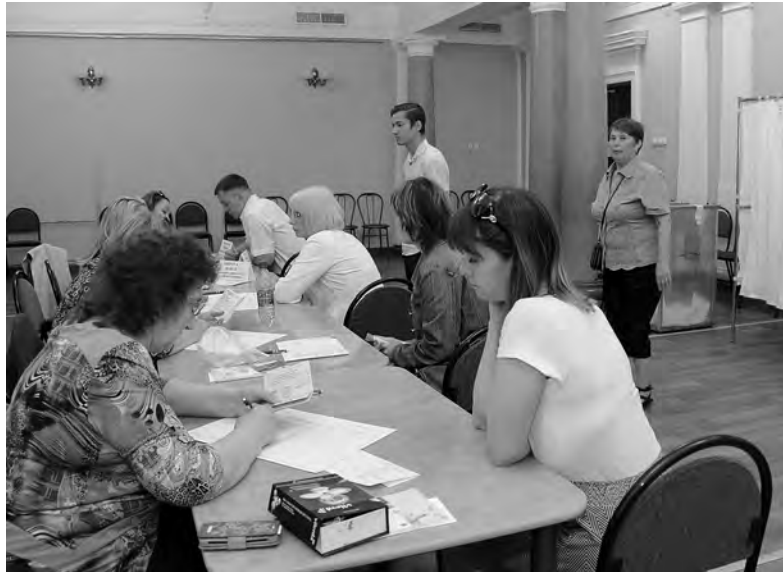
Всего в день предварительного голосования партии «ЕДИНАЯ РОССИЯ» на избирательные участки пришли и сделали свой выбор 7 тысяч 843 человека. Это примерно в 2 раза больше, чем на прошлые предварительные выборы в Государственную Думу

3 июня состоялось предварительное голосование партии «ЕДИНАЯ РОССИЯ»