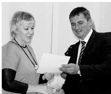
На сегодняшний день к участию в проекте подключились 138 предприятий торговли

- Предприятия торговли делают минимальную торговую надбавку на 14 позиций - это основные продукты питания. Предприятия бытовых услуг вы-