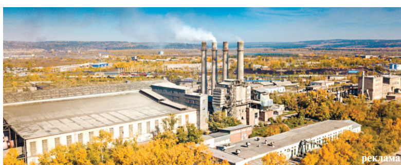
Ангарский цементно-горный комбинат в декабре отметит 60-летний юбилей

Многие годы комбинат оставался передовым предприятием цементной промышленности и в 1976-м был награждён орденом Трудового Красного Знамени.