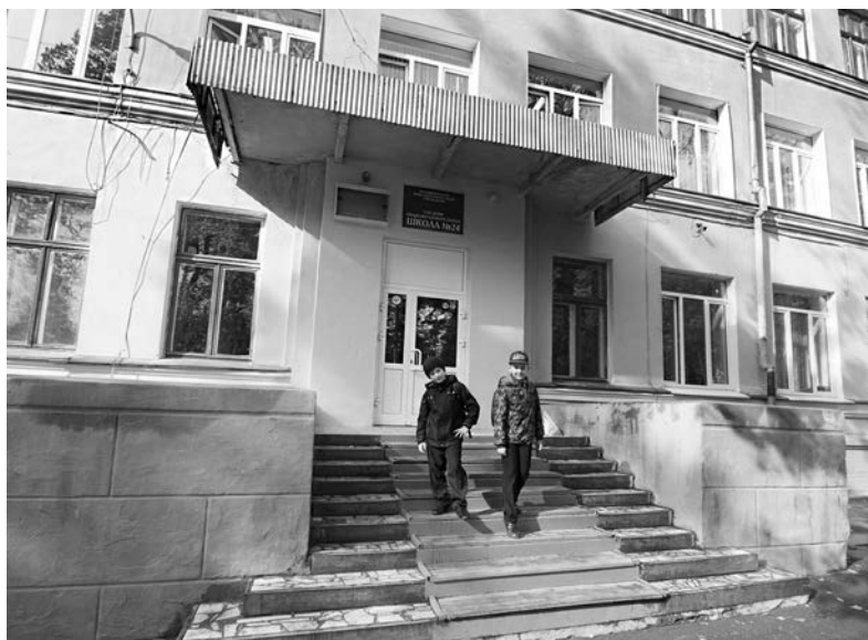
Учителя должны сделать так, чтобы дети нашли своё место в жизни

- Как-то на учёбе нам привели пример. В Индонезии было цунами, и вода ушла с берега. По закону сохранения энергии она должна была вернуться. Это физика, школьная программа. Но люди пошли собирать ракушки. Сейчас этих людей в живых нет. Закон они знали, конечно же, а применить не смогли. Их жить не научили. Математику, например, уже затем учить нужно, что она ум в порядок приводит. Сегодняшние дети очень часто попадают в стрессовые ситуации, но зачастую выбираться из них не умеют. Чтобы их научить решать проблемы, эти самые проблемы им нужно создавать и помогать выходить из них. Иногда родители приводят ребёнка, который в другой школе почему-то не пришёлся. Спрашиваю: чего пришёл? Учиться будешь? Сможешь? Кивает. Разговариваю и записываю всё, что обещает. Потом показываю ему листочек и предлагаю заключить джентльменский договор. А если не исполнишь - что будет? Потом я понял, что понятие «джентльмен» для современных детей незначимо. А вот если я сейчас с ним заклю-