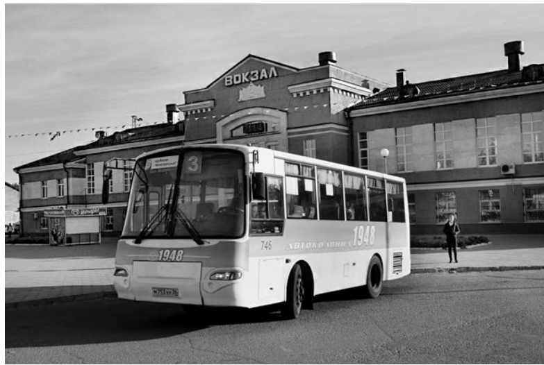
Руководители пассажирских автотранспортных предприятий Ангарского городского союза автотранспортников согласовали со специалистами РЖД время прибытия автобусов маршрутов №3, 7, 8, 10 к последним рейсам электричек

Водители автобусов увезут с железнодорожного вокзала пассажиров до конечных остановок, потом выполнят обратный рейс на железнодорожный