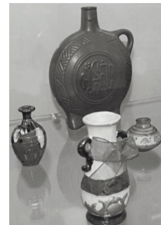
Экспонаты выставки, посвященной Галине Николаевне Преловской