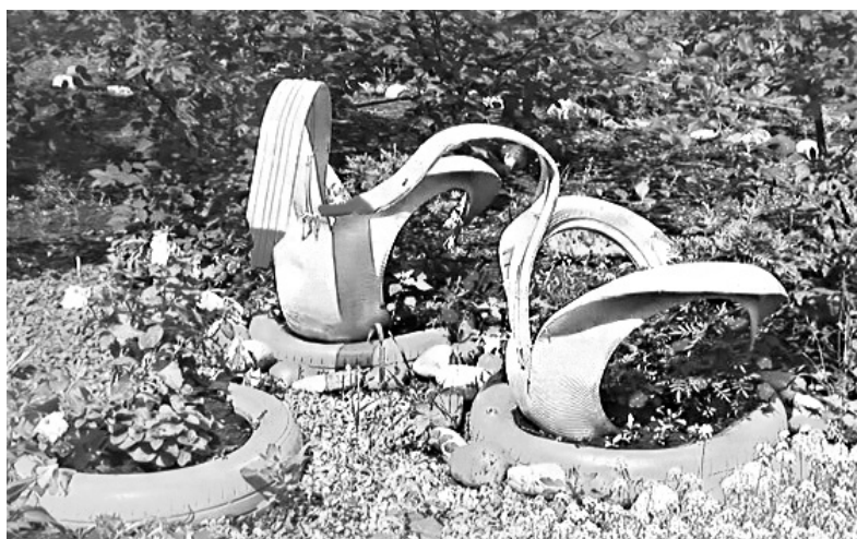
Свой вклад в благоустройство города внесли жители дома 10 в 74 квартале, которые превратили двор в настоящий райский уголок

вложить в родной двор - поставить малые архитектурные формы, купить саженцы или оборудование для детских игр.