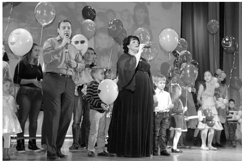
Чужих детей не бывает. И это в очередной раз доказала «Большая семья», на юбилее которой маленькие участники организации пели и танцевали для зрителей

Общественная организация «Большая семья» отметила свой первый юбилей