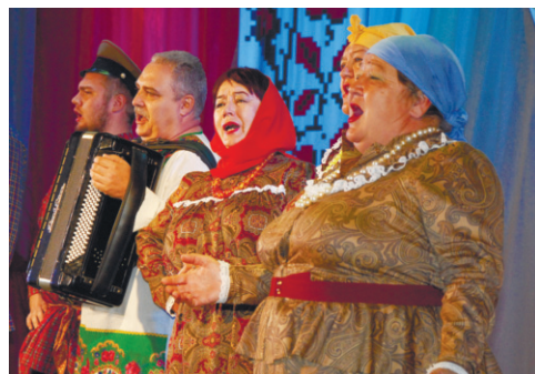
Народный фольклорный ансамбль «Нивушка» из Савватеевки исполняет казачью песню

У казаков есть свои неписанные законы: ходи в церковь, очищай душу, не убивай, не кради, не блуди, трудись по совести, заботься о детях и родителях, не обижай сирот и вдовиц, защищай от врагов Отечество. Они называли себя рыцарями Православия, чтящими оружие. Вот и на фестивале можно было