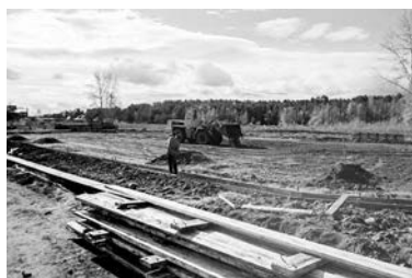
В конце ноября на спортивном корте запланирован турнир по хоккею среди дворовых команд

- Объект долгожданный. Если бы не объединение с Мегетской территорией в Ангарский городской округ, этого объекта не было бы ещё десятилетие. В одиночку небольшому посёлку такая задача оказалась не по силам. Здание было передано в собственность Мегетского му-