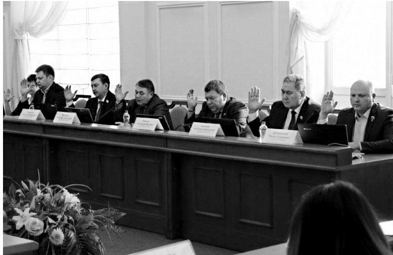
Положительное решение депутатов по этому вопросу было единогласным

Такое решение приняли ангарские депутаты на очередном заседании Думы 26 сентября