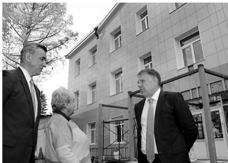
Строители сдают объект через месяц. В конце декабря поликлиника будет готова к открытию