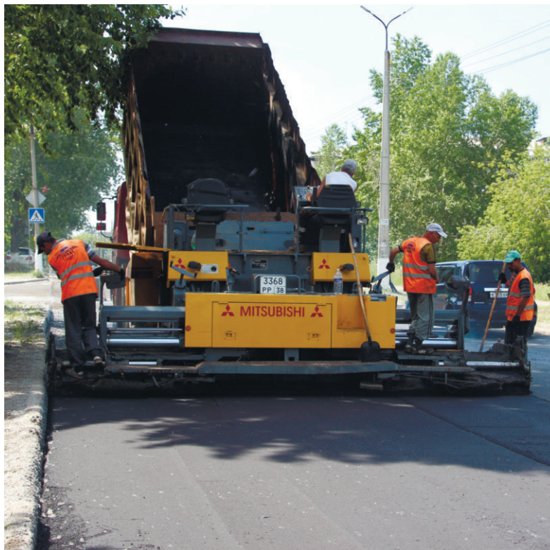
В отчетный период на ремонт и содержание дорог округа направлена беспрецедентная сумма - 334 млн руб.

округа прекратилась естественная убыль населения. В прошлом году позитивная динамика продолжилась. Естественный прирост составил 104 человека. Замедлились процессы отрицательной миграции. В 2015 году за счёт приобретения числа выбывших граждан над приехавшими численность жителей округа сократилась на 791 человека, а в 2016-м - уже на 467. Безусловно, эту динамику нам нужно наращивать, с тем что-