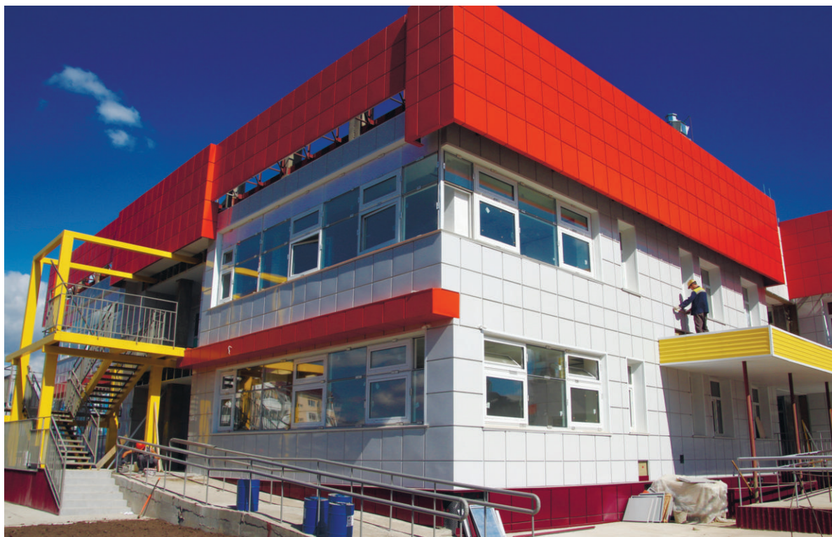
Детский сад в 32 микрорайоне построили в рекордные сроки - всего за год

мов увеличился более чем в два раза. Это следствие завершения проектов, которые стартовали ещё в докризисный период.