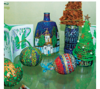
Работы учеников Евгении Прокопенко

Гобелены, батик, квиллинг, несколько видов росписи, тряпичные куклы, расписанные маленькие тыквы и бутылки,