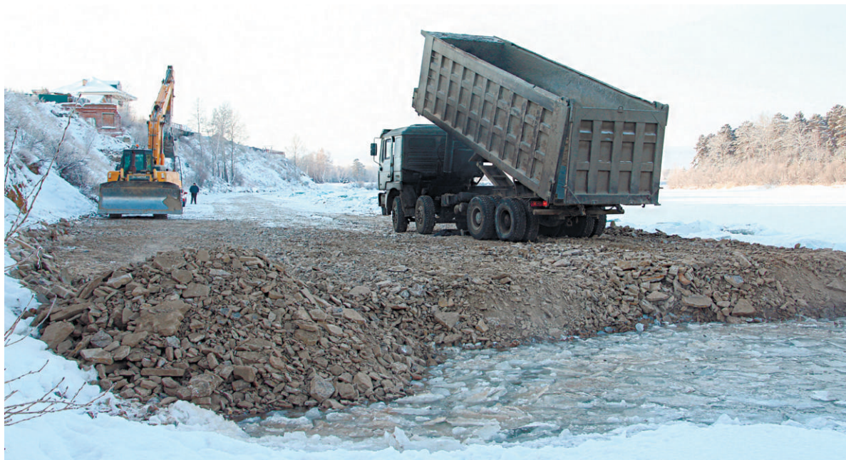
С 2016 года в Ангарске началась реализация значимого проекта по берегоукреплению реки Китой. По его завершении в 2018 году мы сможем приступить к созданию городской набережной

Чтобы не допустить текучести кадров, администрация и депутатский корпус Ангарского городского округа приняли решение о финансовой поддержке младшего персонала. В 2017 году в местном бюджете на эту меру поддержки заложено 70 млн руб. Более трёх тысяч низ-