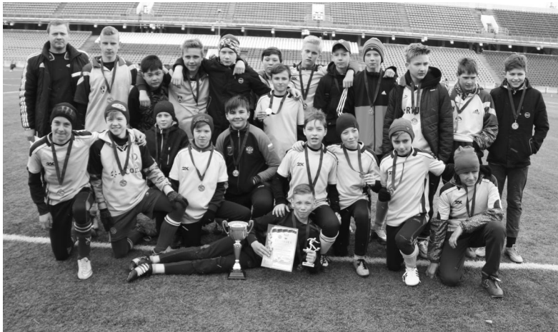
«Ангара» после церемонии награждения

В этом году областной футбольный турнир «Кубок Федерации» прошёл четвёртый раз. В течение двух недель в рамках соревнования выявляли сильнейших ребята 2001-2002 и 2003-2004 годов рождения. 22 апреля финальные игры прошли на стадионе «Ангара».