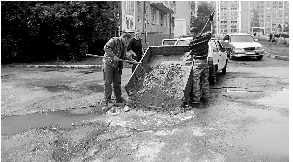
УК «Наш дом+» отличается благополучием и прогрессивным подходом к обслуживанию своих домов и дворов. Однако и здесь есть что отремонтировать. Притча во языцех - развороченные внутриквартальные проезды

- Подобный проект реализуется в Ангарске впервые. Конечно, есть много моментов, требующих детального изучения и определённого опыта. По задумке партии «Единая Россия» люди должны были сами определить свои проблемы, оценить техническую возможность проведения благоустройства, собрать все документы, провести общее собрание собственников помещений в доме, сформировать и подать заявку. И всё это за 25 дней (а по закону, например, общее собрание можно проводить только через 10 дней после оповещения). Конечно, такой труд под силу лишь очень продвинутой команде. Такие в нашем городе есть, но их пока единицы. Поэтому депутатскому корпусу пришлось активно включаться в эту работу. Как только был дан старт проекту, я собрала рабочую группу и мы стали досконально штудировать документы, чтобы помочь людям. Параллельно на территории избирательного округа №19 проводили встречи с жильцами, обсуждали с людьми возможности участия, все вместе формировали предложения, собирали документы, помогали проводить собрания и многое другое. Итог этой большой работы - три поданные заявки. Конечно, мне бы хотелось, чтобы участвовал каждый дом, но надо быть реалистами, ведь критерии отбора достаточно жёсткие. Однако проект заявлен на 5 лет, и, я уверена, когда люди