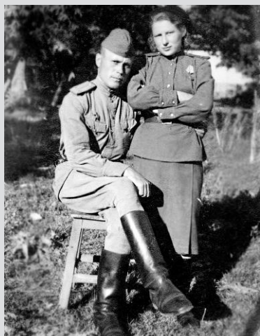
Это солнечное и теплое фото из семейного архива особенно мне дорого

После победы бабушка вернулась в родной Грозный, дедушка прослужил ещё год. Демобилизовавшись, он тоже приехал в Грозный и работал в нефтехимической промышленности. В 1951 году его отправили в Сибирь, где полным ходом шло строительство Ангарского нефтехимического комбината. Вместе с ним и маленькой дочкой приехала бабушка. Получив квартиру в одном из первых домов Ангарска, дедушка начал свой путь первостроителя города нефтехимиков. В 1952 году вместе с большой делегацией он ездил на учёбу в Германию, откуда на строящийся комбинат было