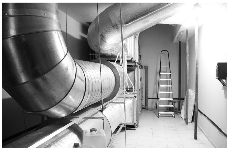
Мощная воздушная система охлаждения «спасает» лампы, температура которой достигает 400 градусов