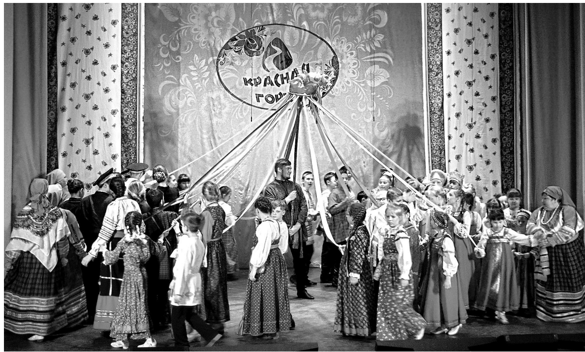
Всё быстрее и быстрее закрутились карусели