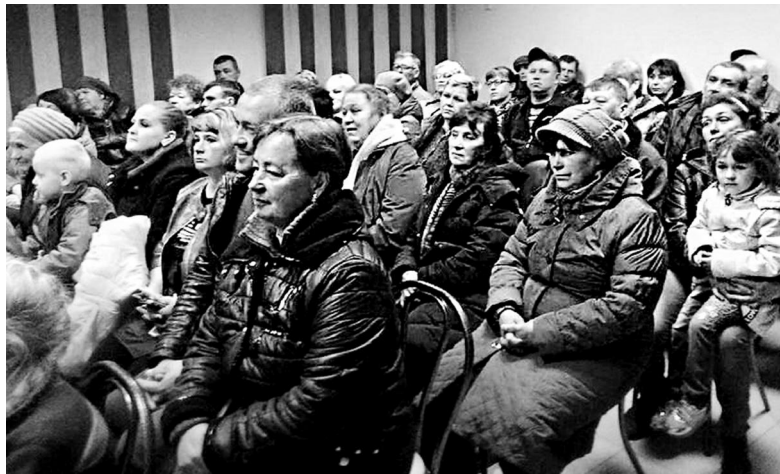
Специалисты администрации и депутаты встретились с жителями Строителя, у которых возникли вопросы по новому проекту ПЗЗ

ках до 30 га? Эти и другие вопросы поступили в администрацию Ангарского округа во время и после проведения публичных слушаний. Но один из главных вопросов - почему правилами землепользования и застройки запрещено ведение сельскохозяйственной деятельности на территории микрорайона?