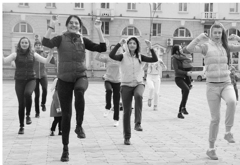
«Зарядка для чемпионов» - лучшее начало форума о здоровом образе жизни

После зарядки и флэшмоба мероприятие переместилось в ДК «Нефтехимик», где все желающие могли пройти бесплатные экспресс-тесты на выявление ВИЧ-инфекции (результат анализ был готов уже через 5 минут), получить консультацию у психолога, купить сувенир на благотворительной ярмарке, познакомиться с брошюрой «Мобильный хоспис», в которой доступным языком говорится о том, что делать, если у вас дома есть тяжело больной лежачий родственник. Как себя вести, куда обращаться за помощью.