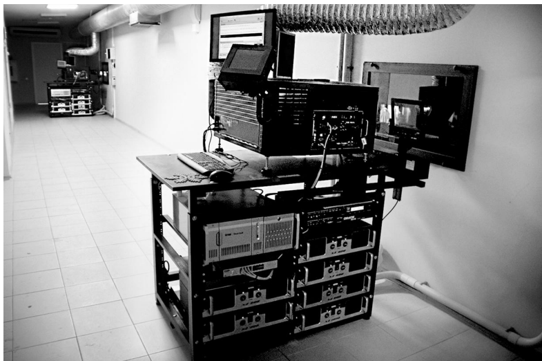
Так сегодня выглядит «сапожник»