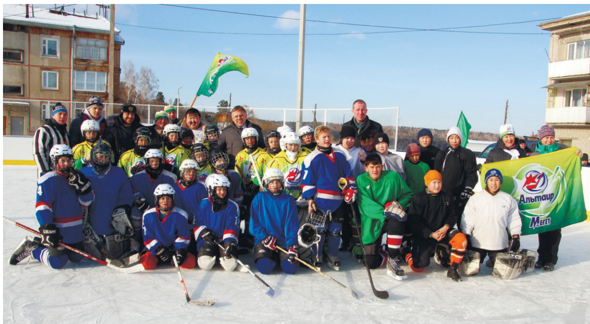
Знаковым событием для жителей Савватеевки стало открытие хоккейного корта и многофункциональной спортивной площадки. Скоро новые хоккейные корты появятся в Одинске и Мегете

Специально созданной рабочей группе удалось решить серьёзную проблему электроснабжения Мегета и деревни Зуй. Минувшей зимой оборудование областной электросетевой компании несколько раз выходило из строя, жители жаловались на перебои с электроснабжением и недостаточное напряжение в сети. Вопрос был поднят на совещаниях в