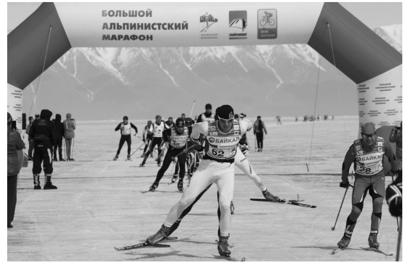
На финише в Максимихе лыжников «встречали» ворота Большого Альпинистского Марафона

В минувшие выходные в Ангарске прошли чемпионат и первенство АГО по тяжёлой атлетике среди юношей. Почти 50 ребят в возрасте от 9 до 18 лет показывали судьям, на что способны.