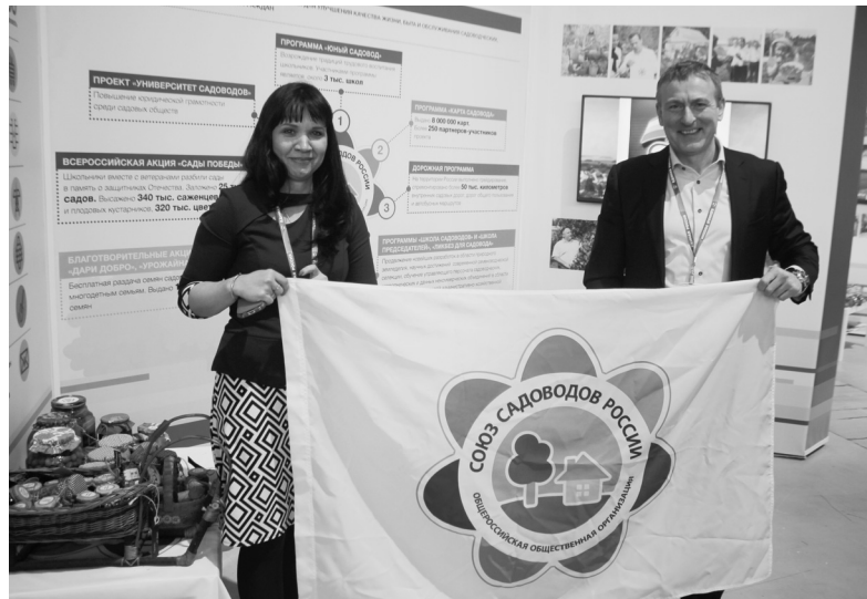
Сегодня делегаты от Ангарска, представляющие всю Иркутскую область, отправились на съезд Союза садоводов России

- Побывав на съезде, мне захотелось, чтобы проект «Дом садовода - опора семьи», который сегодня реализует политическая партия «Единая Россия», получил воплощение и у