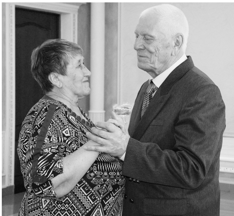
Супружеский вальс золотых юбиляров

решили не расставаться. Свадьбу сыграли 10 марта 1967 года.