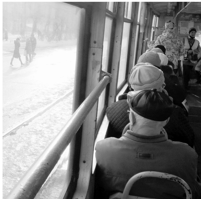
На проезд пенсионеров по садоводческим маршрутам в бюджете Ангарского округа предусмотрено 14,8 млн. рублей

на территории Ангарска. В прошлом году стоимость проезда составляла 16 рублей, из них 10 оплачивали родители, остальную сумму перевозчикам компенсировал муниципалитет. С начала 2017 года стоимость проезда возросла до 20 рублей, однако родители школьников по-прежнему оплачивают только половину. Школьники могут пользоваться льготой в течение учебного года - с сентября по май. В прошлом