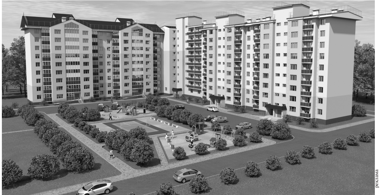
Квартира на ул. Радужной с выгодой до 300 000 рублей

И, наконец, в-третьих, покупка недвижимости в РК «Простор» стала еще выгоднее! Компания работает с муниципальной программой «Содействие развитию ипотечного жилищного кредитования и строитель-