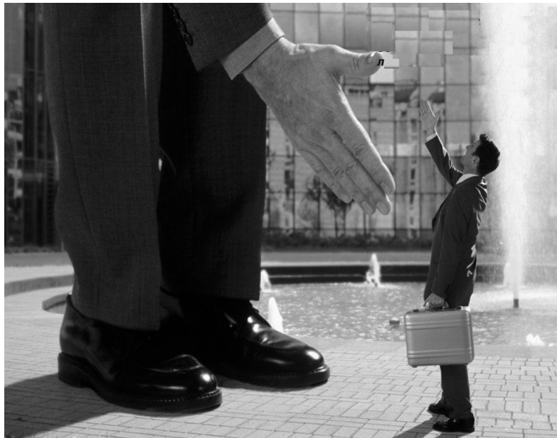
Фонд выдает займы под любые цели. Предприниматели просят деньги на приобретение нового оборудования, модернизацию предприятия, увеличение оборотных средств

- Мы говорим на одном языке с нашими предпринимателями. Просим минимальный пакет документов. Берем минимальный процент. В случае наличия необходимых документов можем предоставить кредит в день обращения. У нас есть клиенты, которые постоянно работают с нами, по 6-7 лет. Берут один заём, возвращают, обращаются вновь. Конечно, то, что мы увеличили максималь-