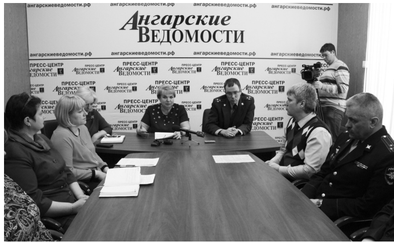
Все службы готовы прийти на помощь детям и родителям, есть методики и способы противодействия влиянию из Интернета

ства, когда ребенок стал замкнутым, у него страх в глазах, нежелание общаться со взрослыми. Он отгораживается от всех за закрытыми дверями, много времени проводит в Интернете, смотрит по ночам «ужасики». На теле появились царапины, раны, теряется интерес к прежним увлечениям.