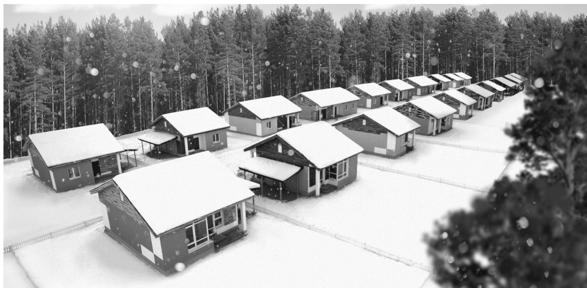
Дом площадью 72 м² с собственным участком в КП «4 сезона» - от 1 418 184 рублей

ству нового жилья», благодаря которой покупатели в 2017 году получают субсидию в размере 30% вместо прежних 20%.