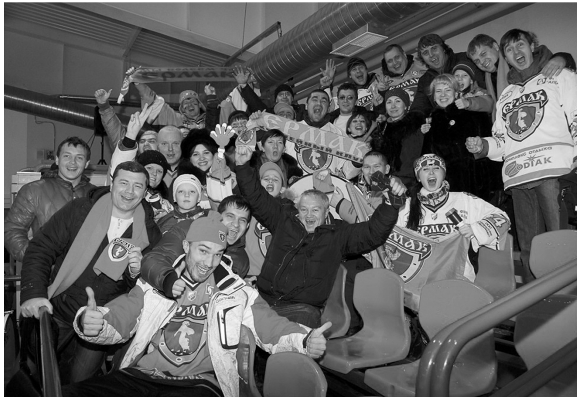
2011 год. Красноярск. Первая поездка поклонников ангарского хоккея на выездной матч «Ермака». Болельщики у нас замечательные!

бо! Мы болели, переживали, и мы понимаем сейчас ваши чувства.