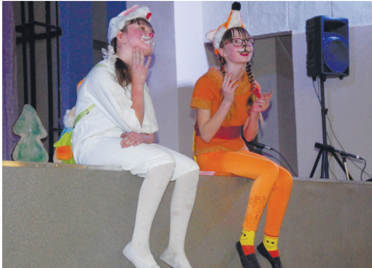
Даже авансцена нового зала располагает к яркой актерской игре, что и продемонстрировали юные таланты театра «Шкода»

Театральный зал ДК «Лесник» встретил первых зрителей детским спектаклем