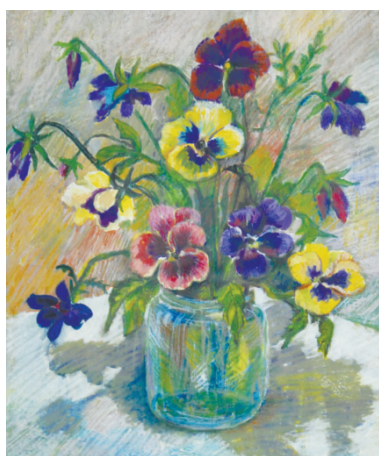
«Анютки октября» (работа Елизаветы Осипенко)

среди зимы, заставляют улыбнуться и почувствовать себя внутри маленькой женской Вселенной.