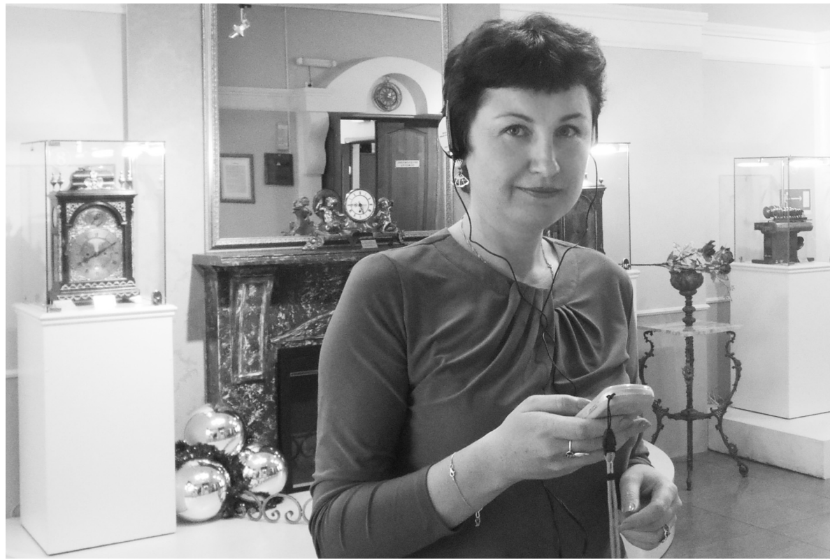
От перевода зависит, какое впечатление останется у иностранных гостей от посещения Музея часов и нашего города

Ангарские школьники помогут Музею часов выйти на новый уровень