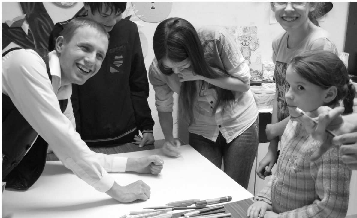
Создается проект детского антикафе. Это место, где платят не за еду, а за время, которое там проводят

Выбирали будущую профессию ангарские старшеклассники