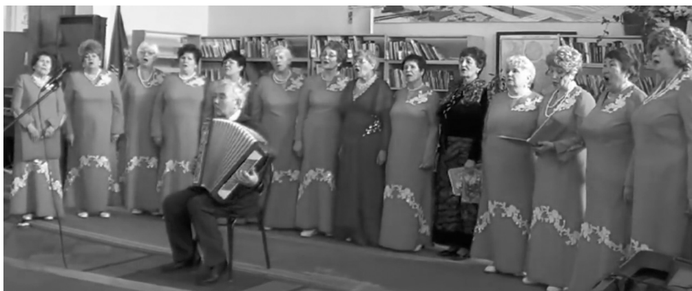
Ансамбль «Нежность» исполняет песни Галины Кобак

В библиотеке №3 Центральной библиотечной системы Ангарска прошел творческий вечер Галины КОБАК, посвященный 70-летию юбилею автора и композитора песен о родном крае, об Ангарске. Поздравить её пришли ветераны АНХК, участники хора «Красная гвоздика», ансамбля «Нежность», ангарские писатели, поэты.