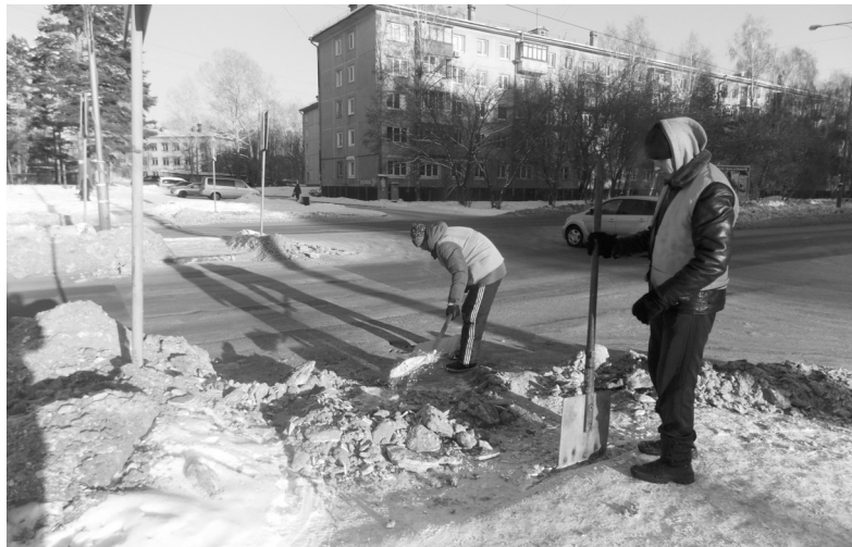
Методично орудя скребками и лопатами, работники ООО «Гермес» «шлифуют» бордюр возле перехода