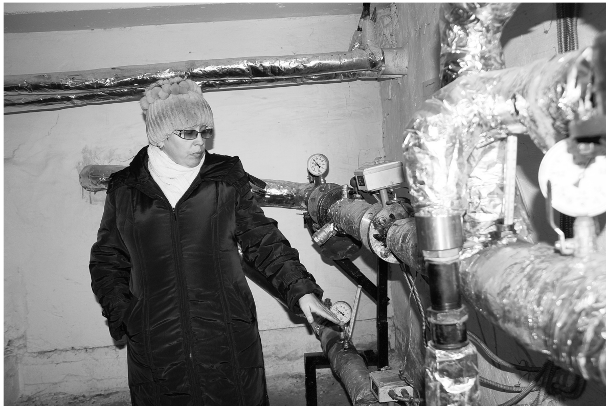
18 микрорайон, дом 1. Одно из мероприятий по энергоресурсосбережению - установка на тепловом узле циркуляционных насосов, которые позволяют и тепло экономить, и деньги жителей

С 1 января все расходы за превышение нормативов по общедомовым начислениям несут управляющие компании