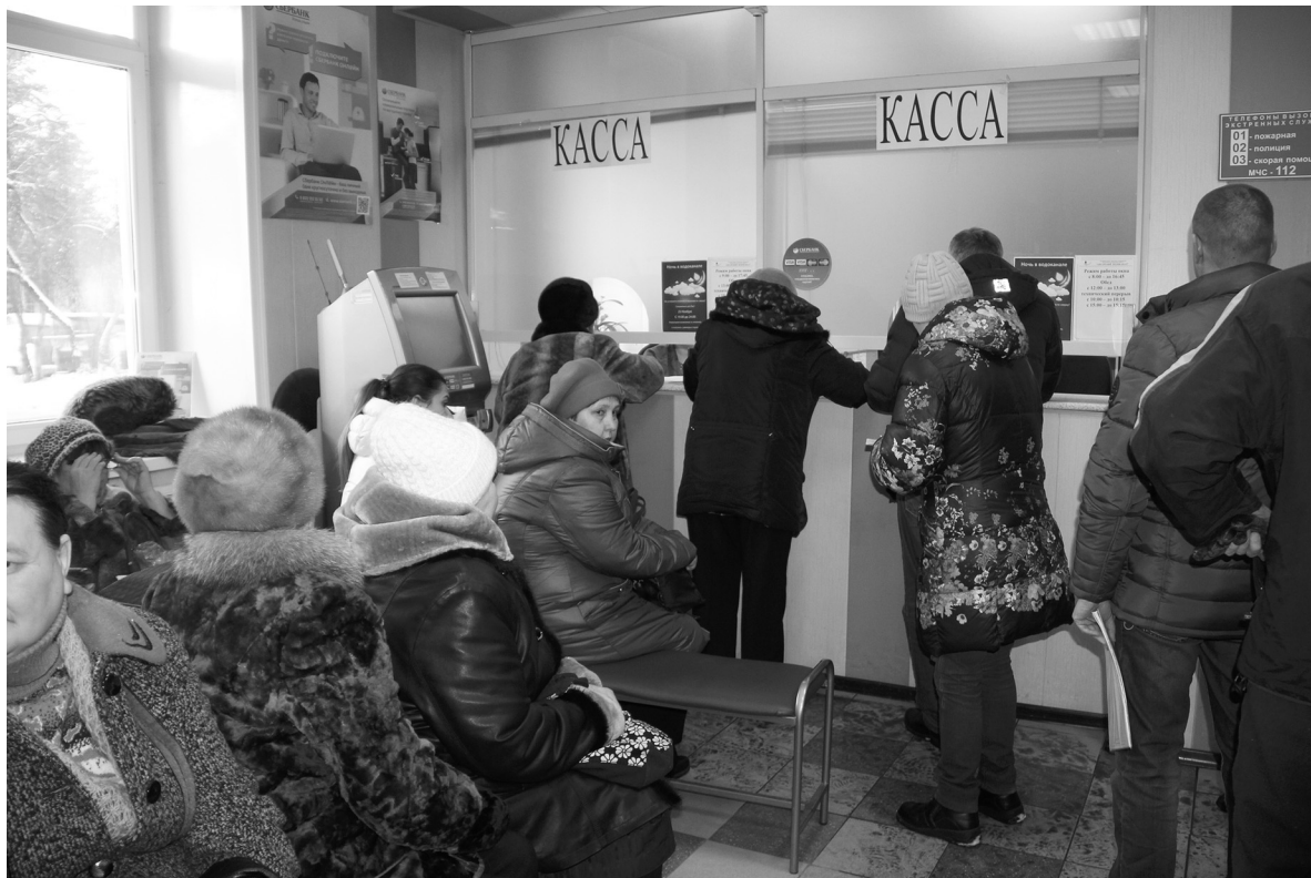
Установка счетчиков спасет от повышения оплаты за коммунальные услуги

С 1 января потребителям воды без приборов учета плату начислят с повышающим коэффициентом