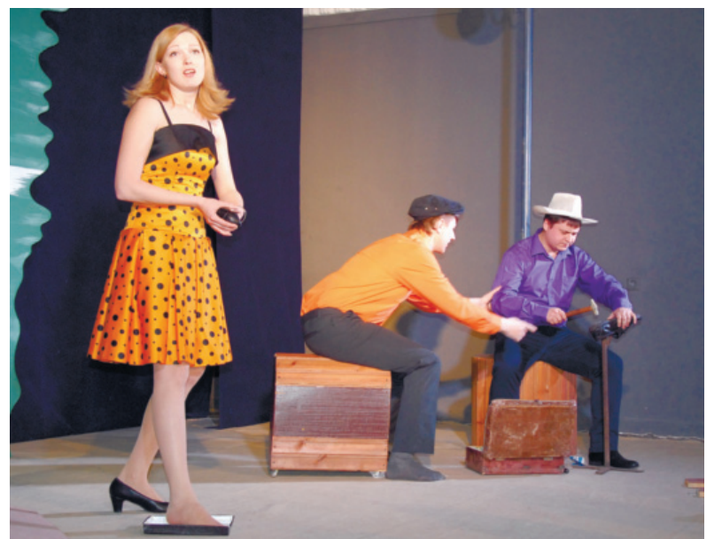
Сцена из спектакля «Стечение обстоятельств»