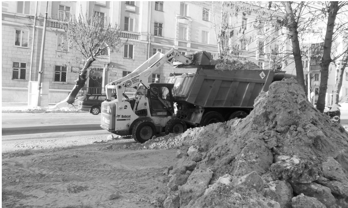
Весь день на улице Энгельса орудует снегоуборочная техника

Наш корреспондент своими глазами увидел, как на улицах Ангарска убирают снег