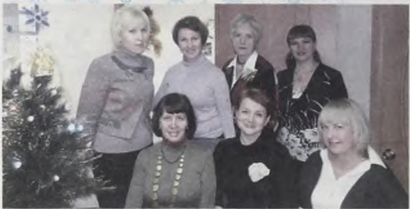
Коллектив отдела по торговле, ценообразованию и тарифам администрации Ангарского муниципального образования искренне поздравляет всех ангарчан с наступающим Новым годом!!!