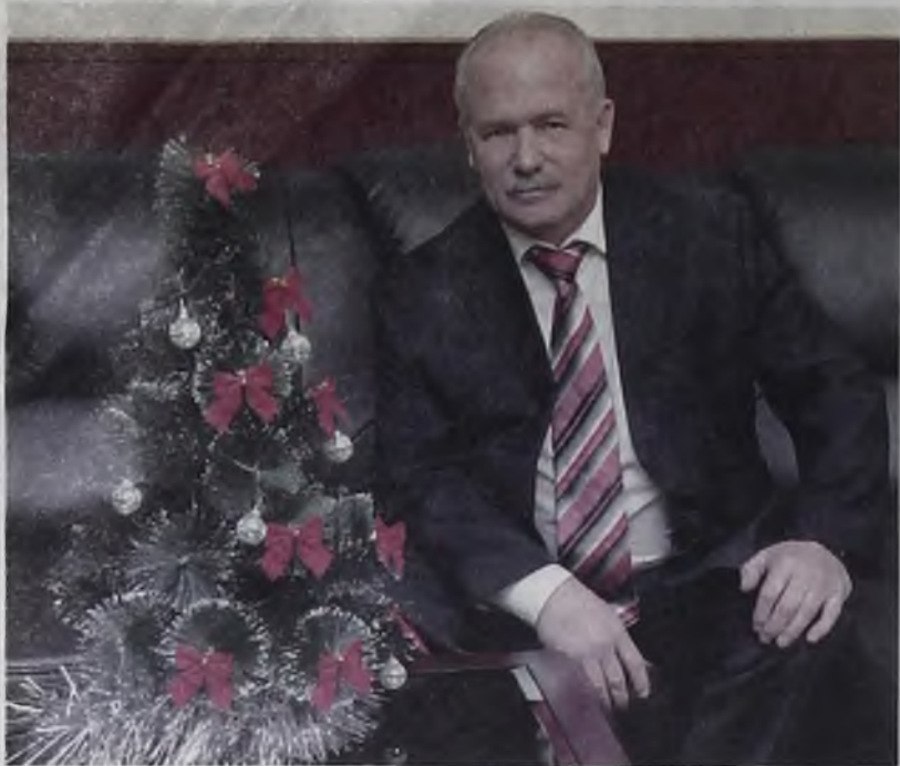
С Новым годом, дорогие земляки!

С самым любимым, волшебным, долгожданным праздником! В новогоднюю пору не только дети, но и взрослые ждут чуда и верят в сказку. Под бой курантов мы загадываем самые заветные желания – пусть они сбудутся у каждого. Пусть год грядущий принесёт душевную теплоту, взаимопонимание в семью, здоровье нашим близким, чтобы любви, добра и счастья хватило на весь год, и мы могли бы щедро делиться ими с окружающими.