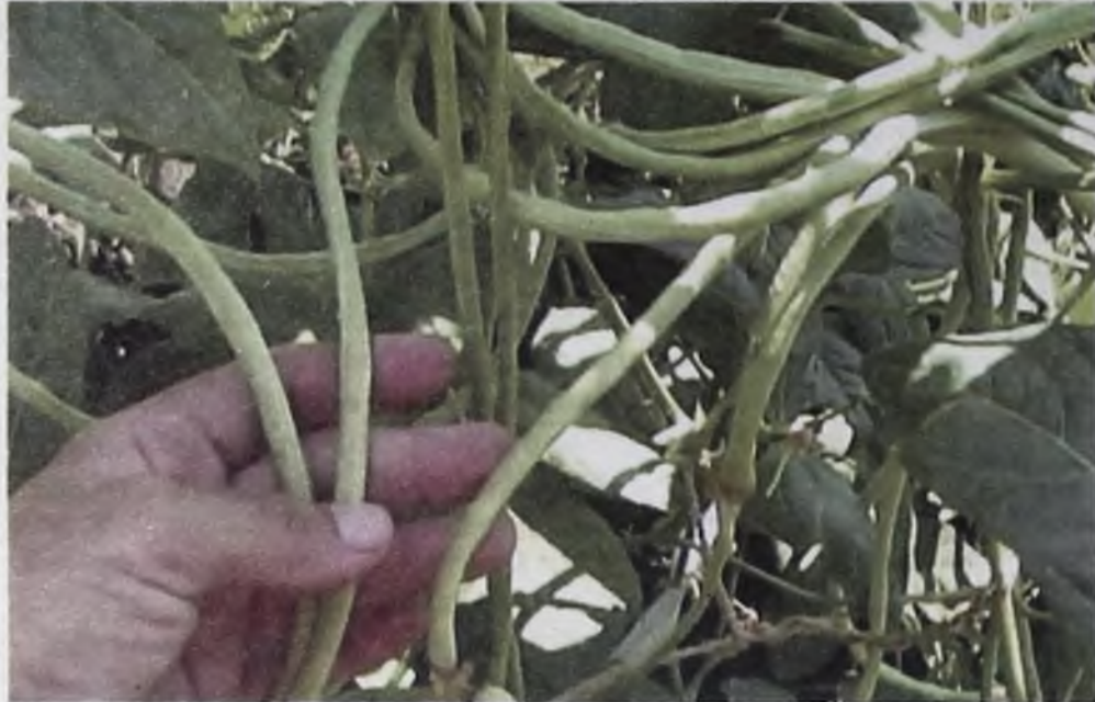
У спаржевой фасоли в пищу идут стручки и бобы