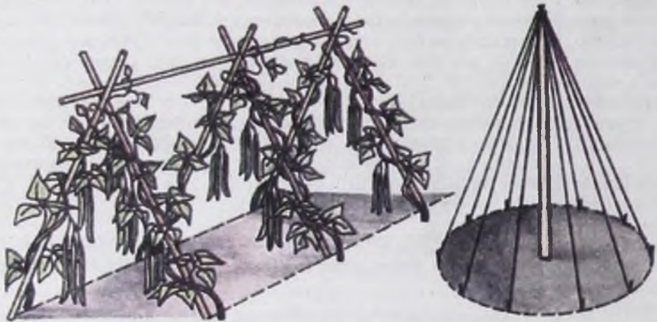
Фасолевыми пирамидами позволяют растениям правильно развиваться и дать обильный урожай

Фасоль наши садоводы-любители выращивают разных сортов и в больших количествах. В народе это растение называют «огородным мясом». Фасоль обладает высоким содержанием белков, углеводов, витаминов К, РР, С, группы В, каротина, минеральных веществ. В ней также содержится нуклеиновая кислота. А это – основа, из которой образуются наши клетки. Нуклеиновая кислота поступает через кровь прямо в клетки и способствует их обновлению, омоложению.