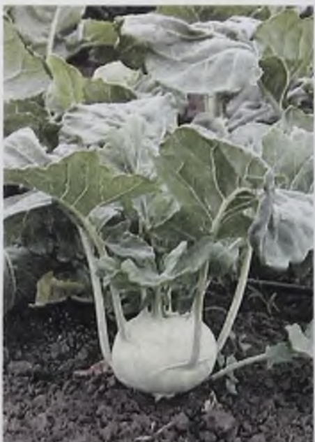
В белокочанной капусте съедобны верхушки, а в кольраби – корешки

Выбирая семена белокочанной капусты, садоводы обращают внимание на её предназначение: одни сорта – для хранения, другие – для засолки, третьи – ранние на летние салаты и в щи.