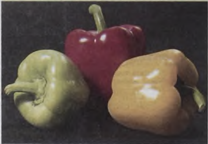
Садоводам-любителям интересно вырастить перцы, не только разных сортов, но и разных цветов

Сравнительно молодая культура, которую ангарские садоводы начали возделывать на своих дачных участках. Лет 10 назад люди не верили, что баклажаны можно выращивать в Сибири, так и норовили на выставках созревшие фиолетовые плоды руками потрогать, кусочек ногтем отколупнуть, убедиться, что они настоя-