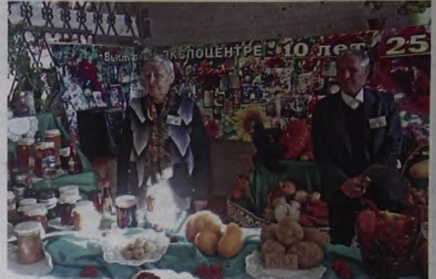
Клуб «Надежда» уже в течение 25 лет объединяет садоводов-любителей

Люди сами обеспечивают свои семьи разнообразной продукцией, включая зелень, овощи, ягоды, которые не входят в производственный ассортимент сельхозпредприятий АМО. При этом весь выращенный урожай садоводы закладывают на хранение или перерабатыва-