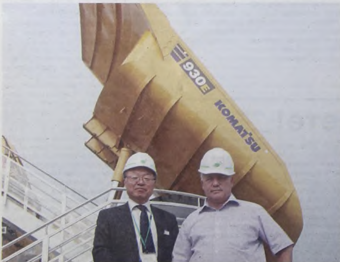
Особое впечатление оставила модель 93-Е Коматцу. Машину называют «большой и добрый здоровяк». Весит гигант 499 тонн, может погрузить до 300 тонн. Колесо этой техники признано самым большим колесом в мире, каждое по 4 метра и весом в 5 тонн

Деловой маршрут по Токио. Посещение корпорации «ISKRA INDUSTRY CO. LTD», которая производит медицинское оборудование, известное во всем мире: ультразвуковые сканеры, приборы для интенсивной терапии новорожденных, реанимационные системы... Компания