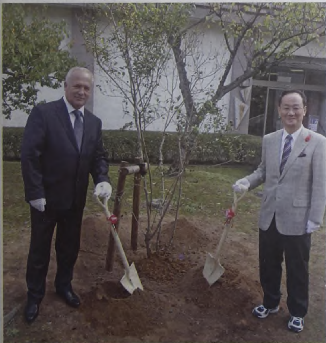
В знак дальнейшей дружбы посажена сирень. В планах у администрации японского города посадить алею в знак дружбы Ангарска и Комацу