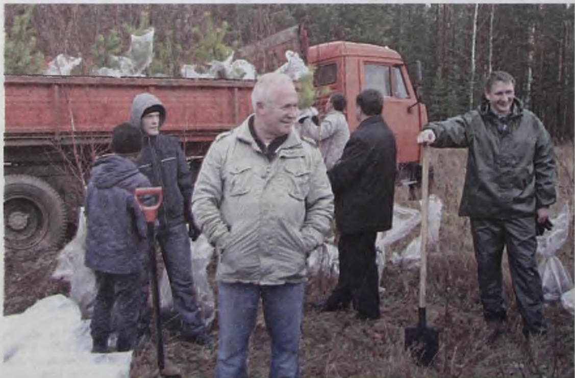
Подведение промежуточных итогов