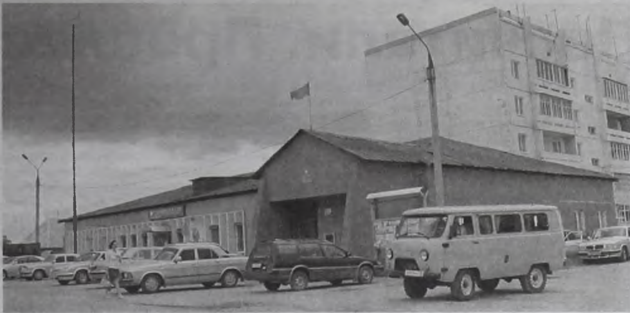
Мегетчане остаются за рамками референдума

Как я это представляю? Моё твёрдое убеждение: дискредитировавшая себя за время правления, власть должна снять с себя полномочия, как это происходит во всех цивилизованных странах. Вот такой вариант, по-моему, самый приемлемый и бескровный. Тем более, в случае добровольной передачи своих полномочий администрациями других поселений (Мегета, Савватеевки, Одинска), реально создастся прецедент единовластия (единовластия). Все остальные варианты не что иное, как спекуляция на народных деньгах. Точнее сказать – огромное желание как можно дольше оставаться у кормушки. Я имею в виду, в том числе и вариант предлагаемый городской администрацией под руководством Леонида Михайлова и поддерживаемый депутатской фракцией коммунистов в Думе района. Вариант, где все поселковые, городская и районная администрации сохраняются со своими четырьмя сотнями миллионов рублей содержания. У каждого в этом вопросе, как говорится, своя правда. И сегодня мы со своей правдой победили. Мы – большинство депутатов Думы Ангарского муниципального образования. И вам, избирателям, судить, кто честнее. Теперь нужен реальный федеральный закон, который даст нам инструмент