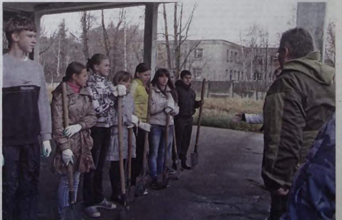
Краткий инструктаж для школьников перед посадкой деревьев