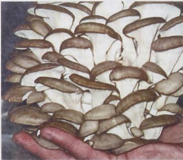
Грибы на дачном участке – удобно, практично, но не романтично

Также выращивать грибы можно в полиэтиленовых пакетах. 10 килограммов субстрата и 250 граммов мицелия, равномерно перемешивают и засыпают в прочные полиэтиленовые пакеты. После этого в пакете делают отверстия диаметром 3-5 мм по всей длине мешка. Через два дня мицелий приживается, появляясь в виде белого пушка. Обильно поливайте и ждите урожая.