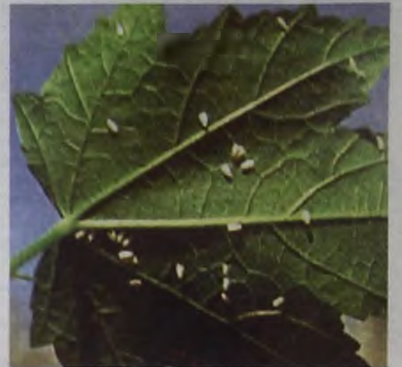
Если потряхнуть ветку пораженного растения, то в разные стороны сразу разлетается стайка белых мошек

Как это ни обидно, зачастую белокрылку мы разводим сами. Не исключено, что она проникает в дом вместе с комнатными цветами, которые на лето вывозят на дачные участки. Зимой насекомое спокойно переносит в тепле, а вес-