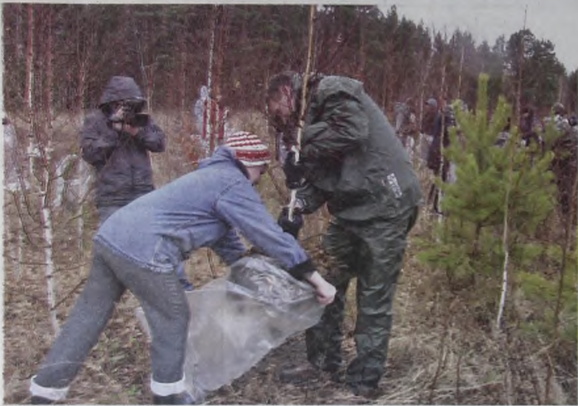
Вот так всё начиналось