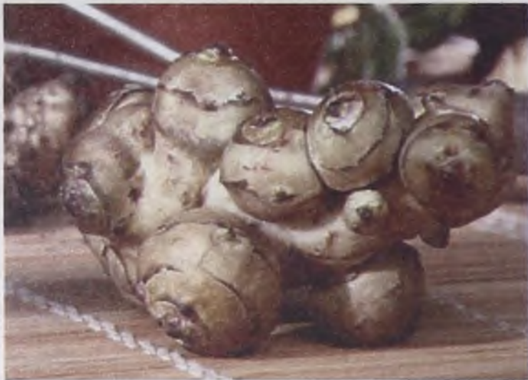
Топинамбур вытесняет с участка такие сорняки, как осот и пырей

О полезных свойствах топинамбура знают многие садоводы, но пока он остается малоизвестной, нетрадиционной культурой для нашей местности, несмотря на неприхотливость и полезные свойства. Его можно использовать как декоративное растение, употреблять в пищу и использовать как корм для животных.