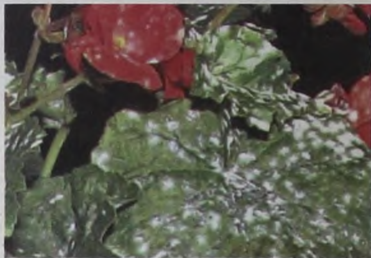
К заболеванию мучнистой росой особенно склонны кабачки, тыквы, флоксы

Мучнистая роса не имеет ничего общего с утренней росой. Скорее, ее надо было бы назвать мучнистой пылью. Это грибковое заболевание поражает не только цветы, но и овощные культуры, плодово-ягодные кусты. В нынешнем году мучнистая роса погубила немало смородины и крыжовника.