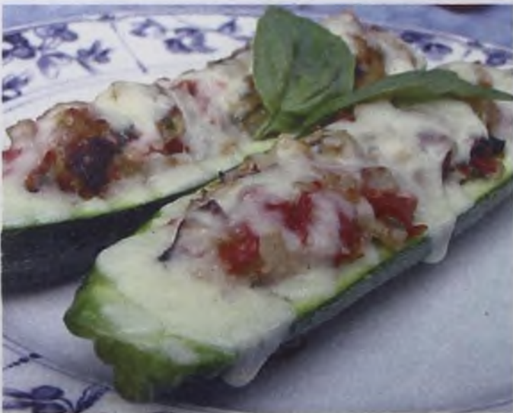
Топинамбур сначала кажется непривычным, а когда попробуешь – за уши не оттащишь

Кабачки нарезать кружками толщиной 2-2,5 см, удалить сердцевину и освободившееся место заполнить фаршем, уложить на смазанный растительным маслом противень, сверху полить растительным маслом и запечь в духовке.