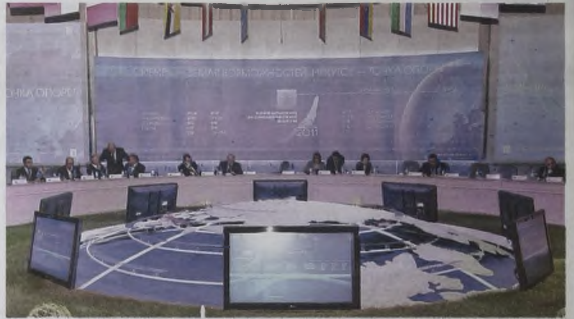
БЭФ – зал заседаний

Третий сценарий – «Новые возможности» – предусматривает эффективное сочетание комплексного развития ресурсного потенциала, человеческого капитала, ряда сегментов машиностроения, генерации и активного использования новых знаний и технологий. В этом случае развитие минерально-сырьевой базы регионов происходит на системной основе, с выделением крупных минерально-сырьевых узлов – центров экономического роста (ЦЭР).