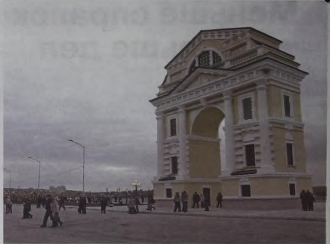
Московские ворота — триумфальная арка, сочетает в себе стили ампира, ренессанса и романского