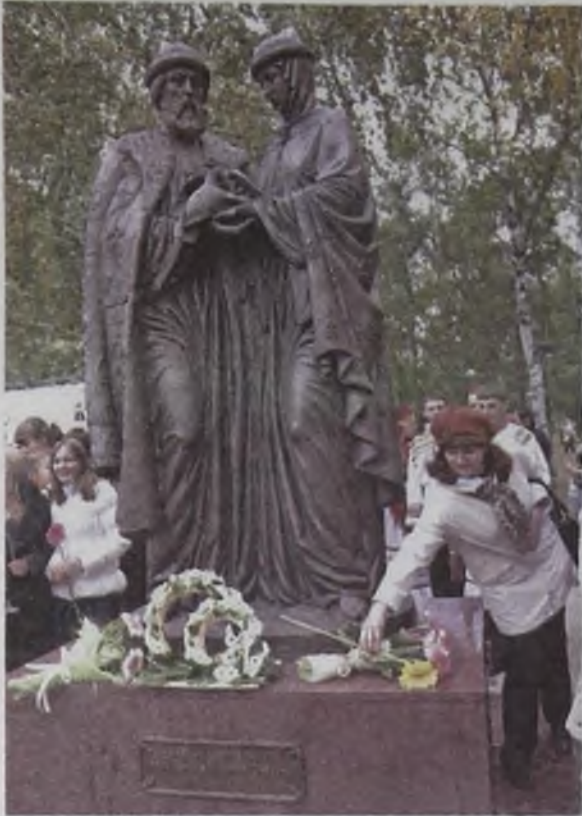
Памятник Святым благоверным Петру и Февронии Муромским установлен на территории Спасской церкви