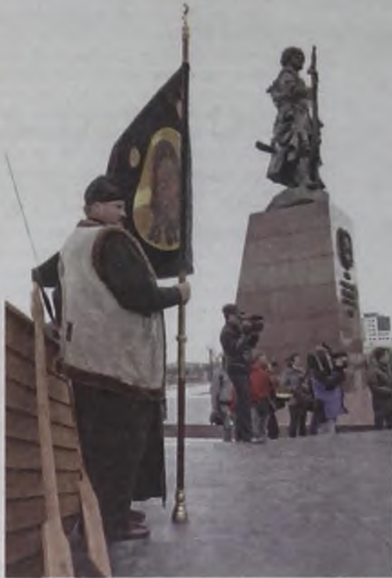
Благодарность от иркутян основателям Иркутска Якову Похабову с сотоварищи