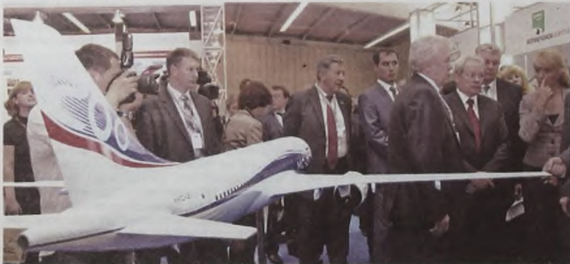
Экскурсия по выставке