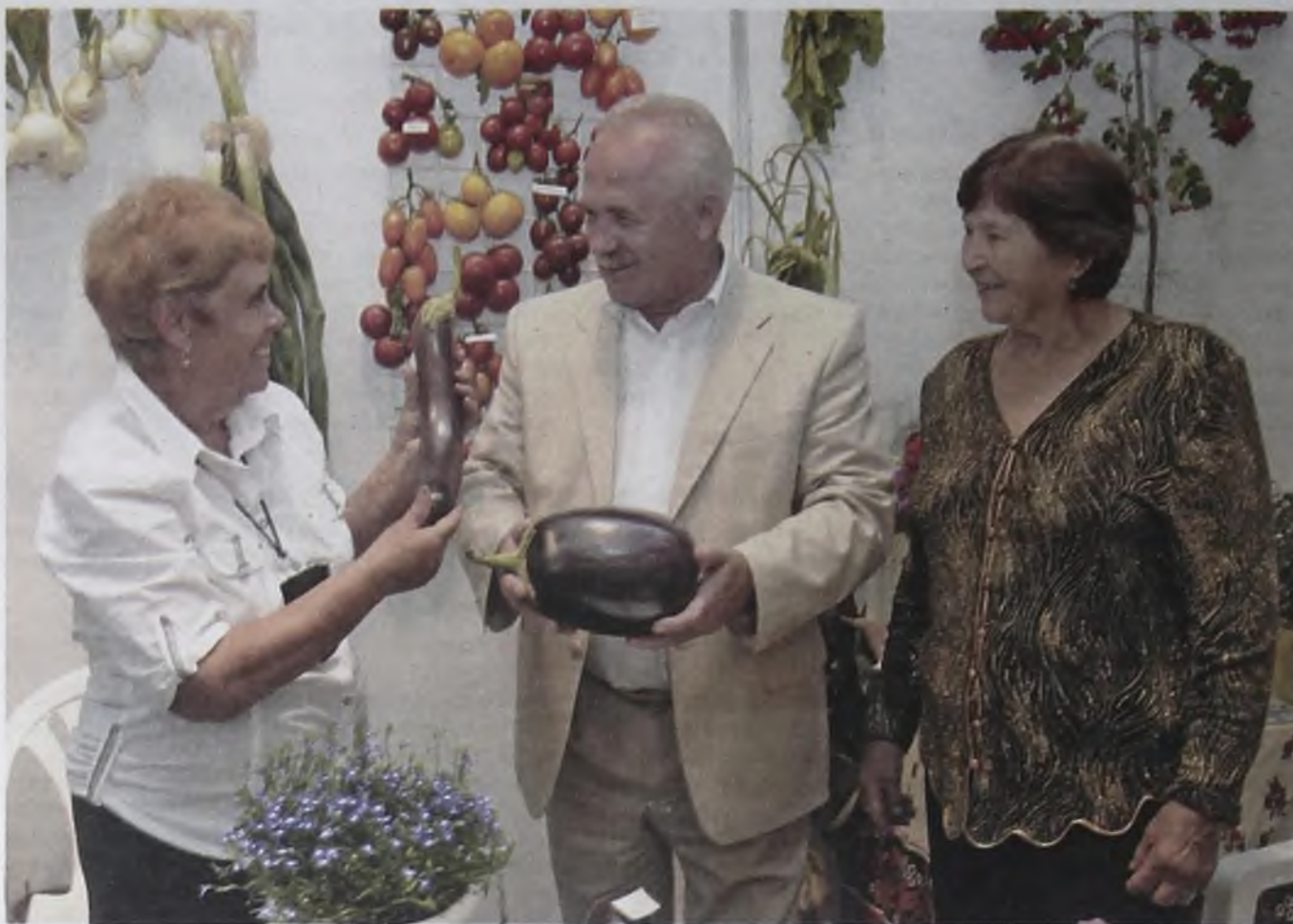
Экспозиция ангарчан выглядит достойно, богато