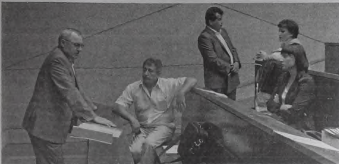
Все предложения, собранные членами политсовета Ангарского местного отделения партии «Единая Россия», будут изучены и доведены до сведения представителей власти на местном и региональном уровнях и учтены при формировании Народной программы

Нынешний, 2011 год, – время выборов в Государственную Думу РФ. Предвыборная кампания по формированию этого главного законодательного органа страны уже стартовала. Активнее других к предстоящим выборам готовится партия власти.