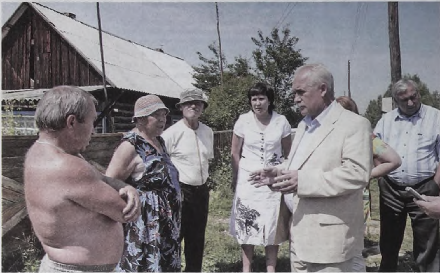
На улицах Ново-Одинска нет освещения. Летом это не столь заметная проблема, а осенью и зимой ситуация вызывает тревогу, особенно, когда детям приходится по темноте идти к автобусу, чтобы уехать в школу