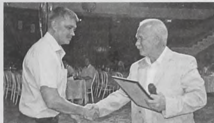
«Бойцы невидимого фронта» получали благодарности от Владимира Жукова, мэра АМО

За минувшие десятилетия изменились политические оценки и представления граждан о роли органов государственной безопасности, но неизменными остались задачи по защите суверенных интересов страны, обеспечению безопасной деятельности стратегических объектов, промышленных предприятий и населения.