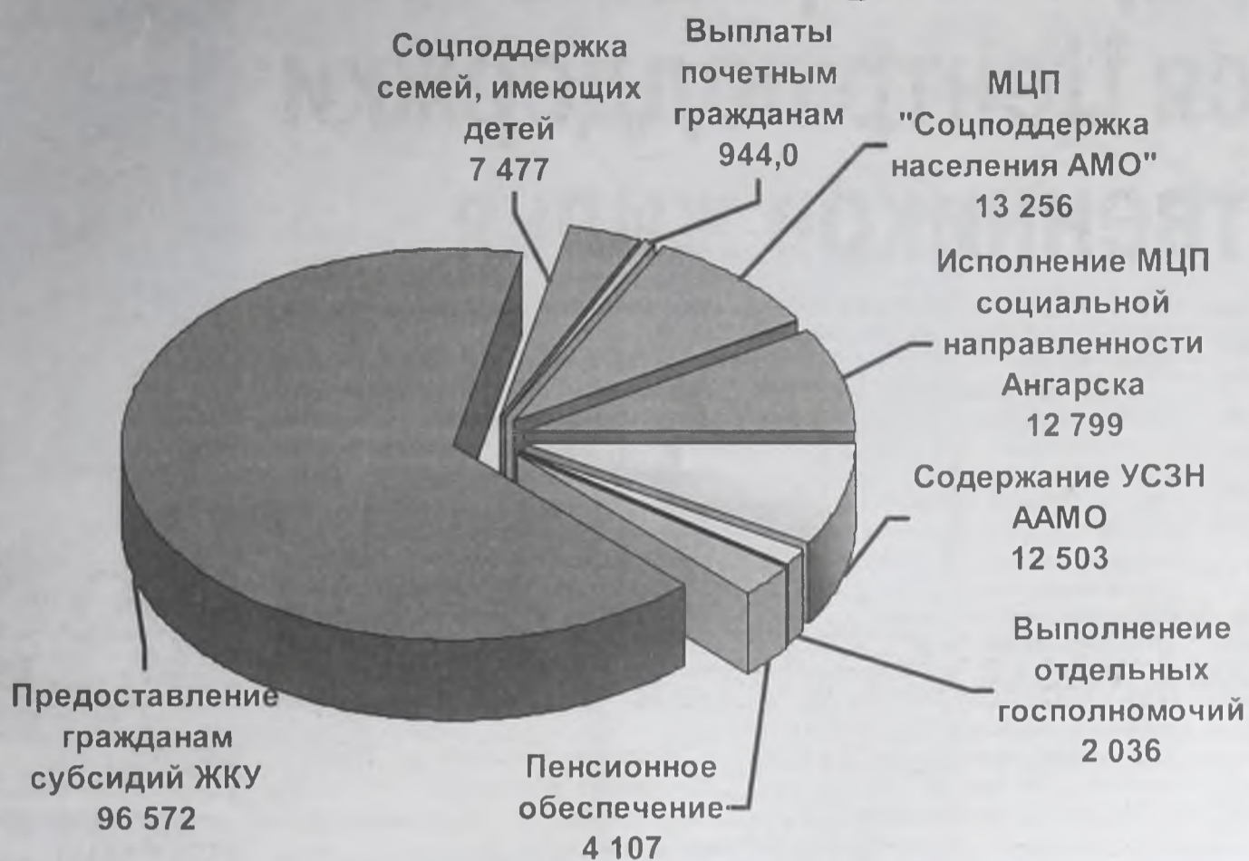
Исполнение по разделу «Социальная политика», тыс. руб.

В сельском хозяйстве выпуск продукции составил 572,2 млн руб., рост – на 13,6% по сравнению с 2009 годом. При том, что государственная поддержка села из средств федерального и