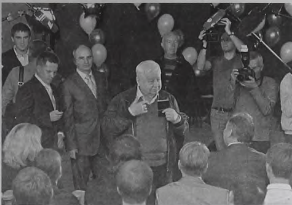
Олег Табаков отвечает на вопросы прессы

Папа в газете прочитал о проводимом Московской театральной школой кастинге в Иркутске. У меня оставалась всего ночь, чтобы выучить два стихотворения и басню. На кастинге сразу стало понятно, что ни слова из выученной басни я не помню, поэтому импровизировал на ходу. А потом еще пришлось рассказывать стихи Есенина – я их читал так, как себе представлял декламацию самого поэта. В конце экзаменатор, он же коллега Олега Павловича, спросил: «Почему Вы так кричите? Я Вас прекрасно слы-