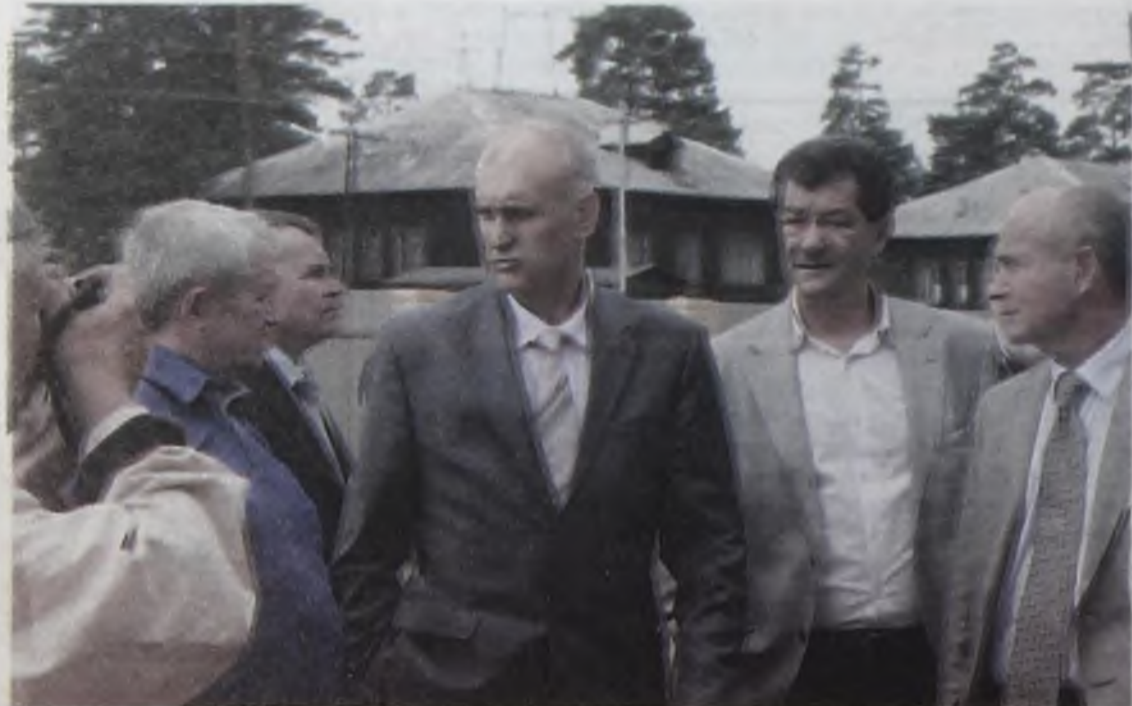
Николай Хиценко: диалог власти и бизнеса должен быть конструктивным