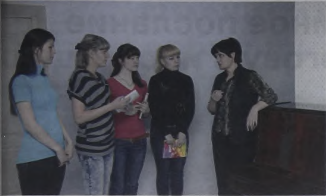
Практика в «Ангарских ведомостях»: всё по-взрослому