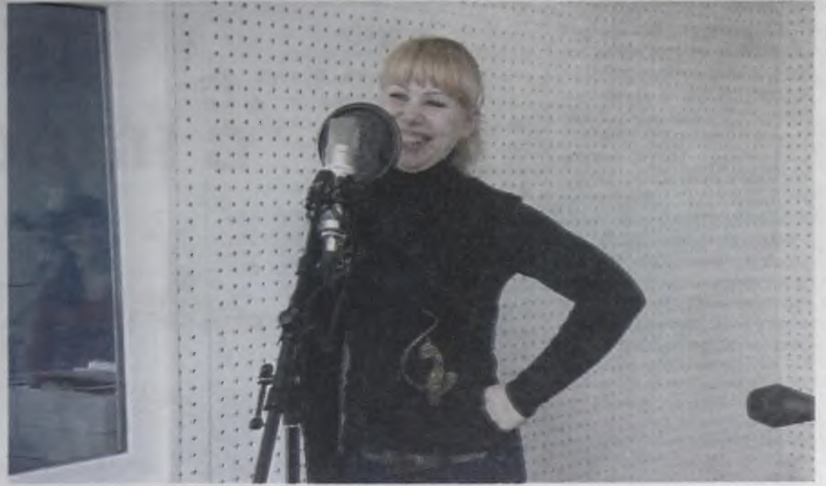
Секрет «продвиженцев»: главное – позитивный настрой

На старт проекта «ПРОдвижение» вышли 60 человек, до финала добрались всего 17. Награждение победителей состоялось 4 июня в зале заседаний администрации АМО.