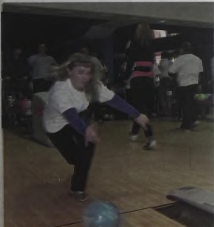
В карьере, как в боулинге: надо удачно выбить страйк

тные качества: целеустремленность, настойчивость, упорство, умение работать в коллективе – оттачивали в спортивных соревнованиях.