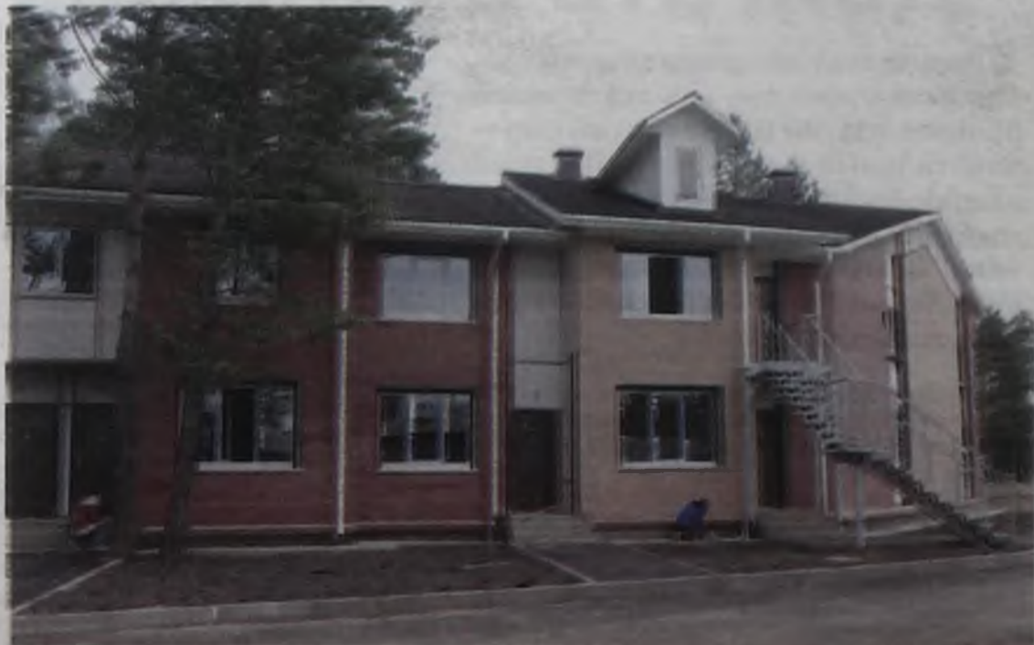
Гости посетили ещё и ЗАО «Стройкомплекс», и малоэтажный дом, собранный из сэндвич-панелей, в поселке Новый-4