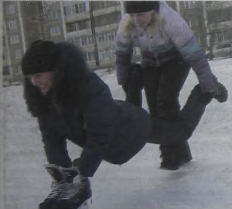
Участники проекта успевали и на практику ходить, и спортом заниматься