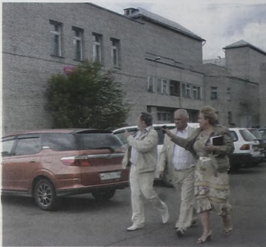
На роддоме утепляют фасад

непреодолимым препятствием. Сегодня в Иркутске (да и по всей стране) немало 4-этажных школ, никто сносить четвертые этажи в них не собирается. Наоборот, выделяются немалые деньги на реконструкцию этих учебных заведений,