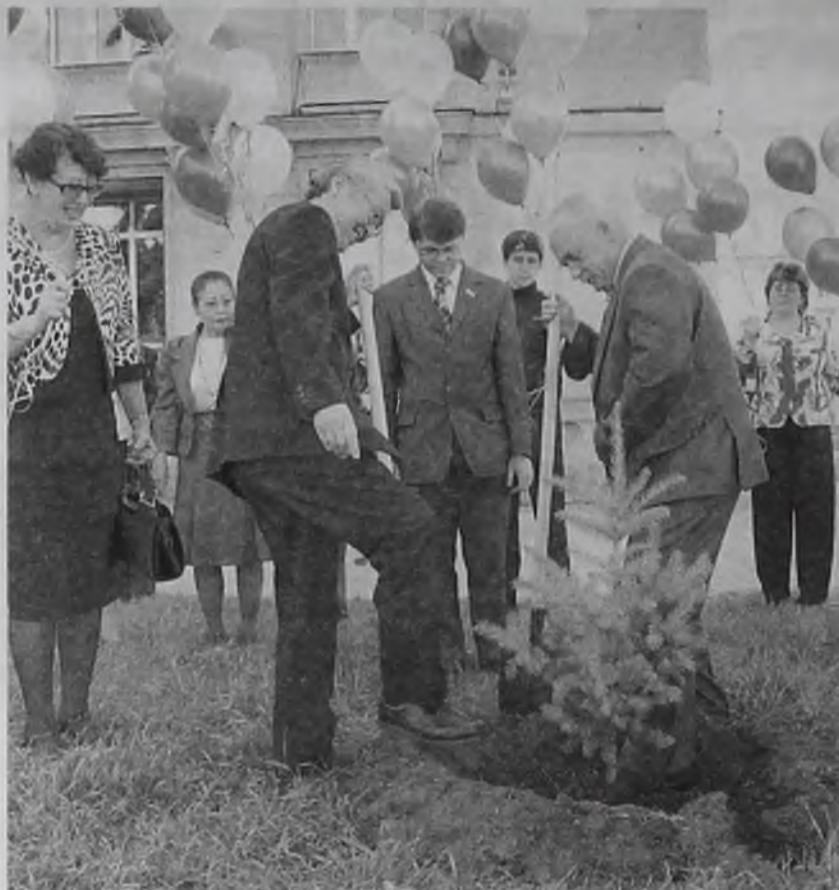
Две маленьких голубых ели являются свидетельством дружбы между Ангарском и Комацу. Только бы не дотянулись до этих символов чьи-нибудь жадные руки