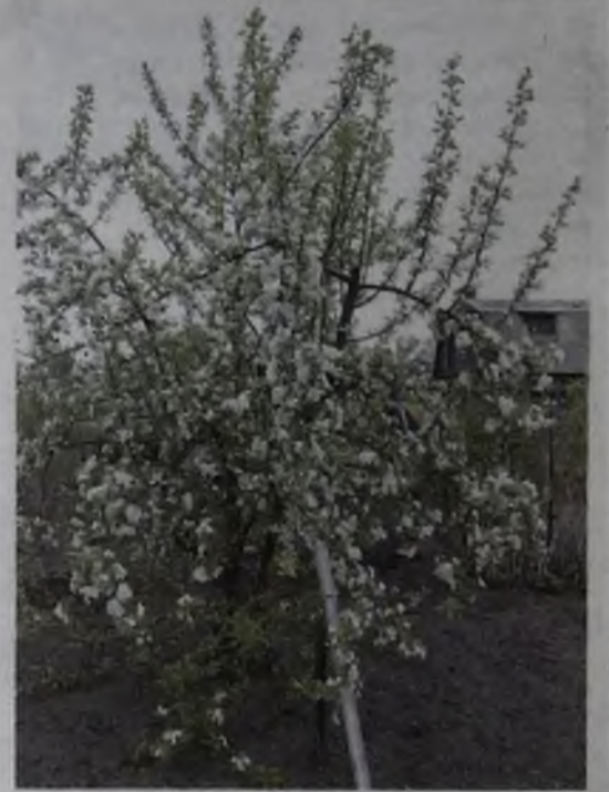
Это ещё цветочки – яблочки впереди

– Все зависит от того, насколько дерево сильное. Этот прием необходим лишь для лучшей приживаемости и развития плодового дерева. Дело в том, что на образование бутонов расходуется большое количество питательных веществ. Еще слабая корневая система вынуждена использовать элементы питания за счет имеющихся внутренних запасов, что ослабляет рост дерева. Такие цветки, как правило, все равно опадут. Если дерево зацвело на второй год после посадки, бутоны лучше удалить, а если на третий, четвертый, то можно оставить.