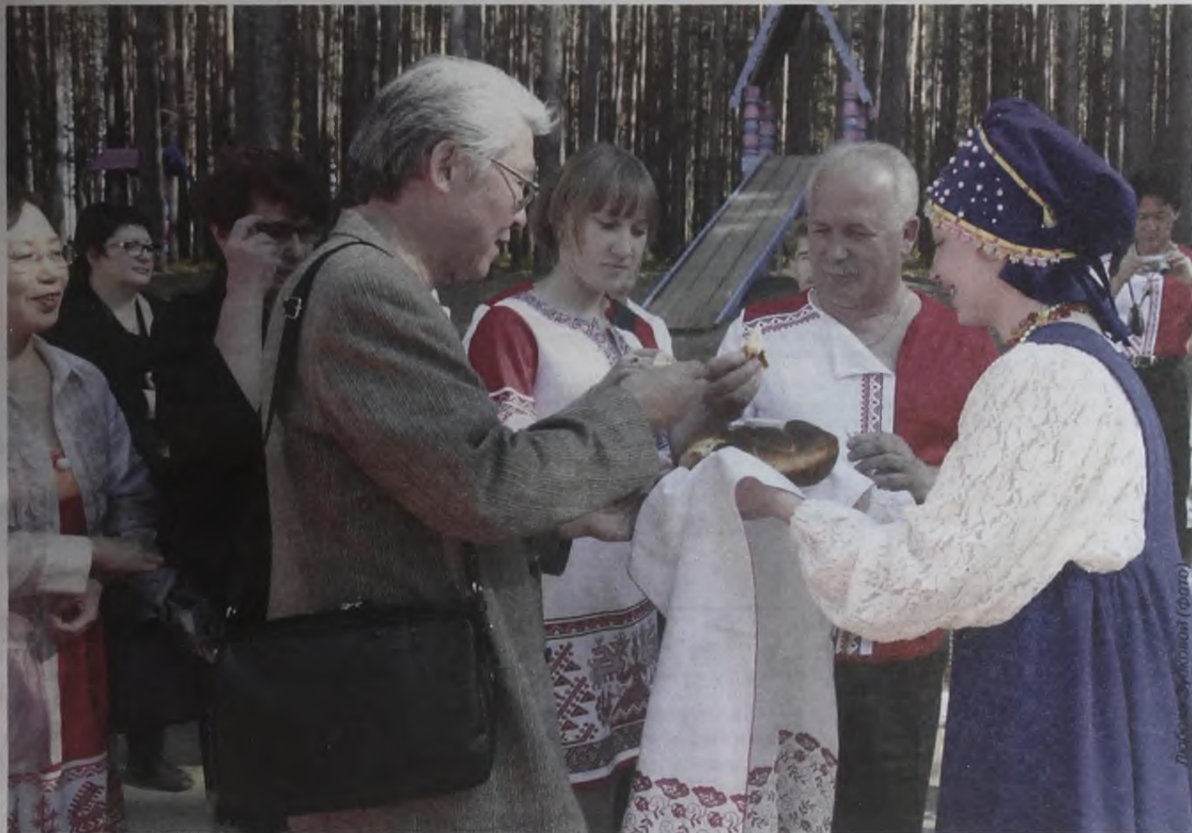
В старинном селе Савватеевка уважают обычаи предков и дорогих гостей встречают хлебом-солью

Делегация из Японии, города-побратима Комацу, стала дорогим гостем главного торжества года – 60-летнего юбилея Ангарска. Для восточных соседей приготовили насыщенную культурную программу, включающую поездку на Байкал, посещение учреждений образования, музеев, фестиваля деревянной скульптуры и фольклорного праздника в Савватеевке.