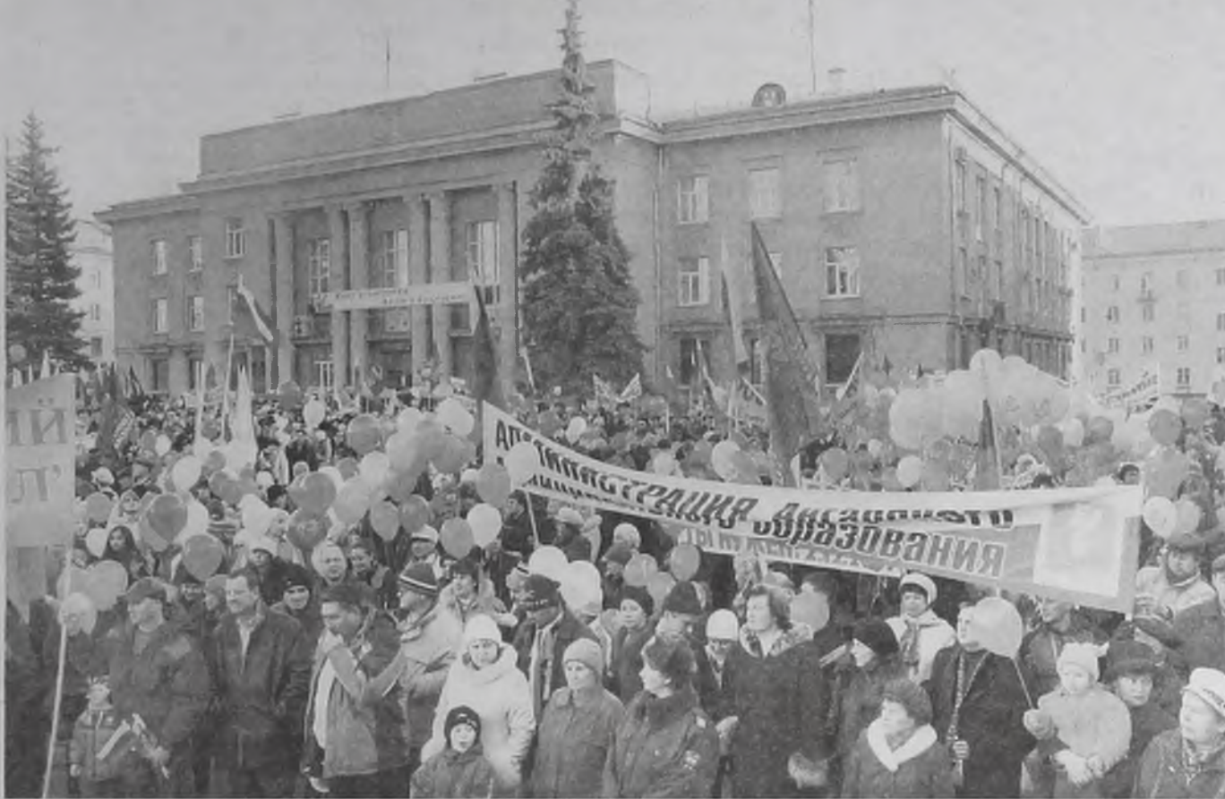
Ангарчане этот город строили, поднимали, облагораживали, они до боли в сердце переживают за его настоящее и будущее

рация Ангарска выдают нам «идеальный вариант объединения». Говоря о светлом будущем города, новая «команда», по сути, готовит разъединение, распад территорий АМО. Перспективы самого Ангарска при этом становятся весьма туманными, а права горожан ущемляются.