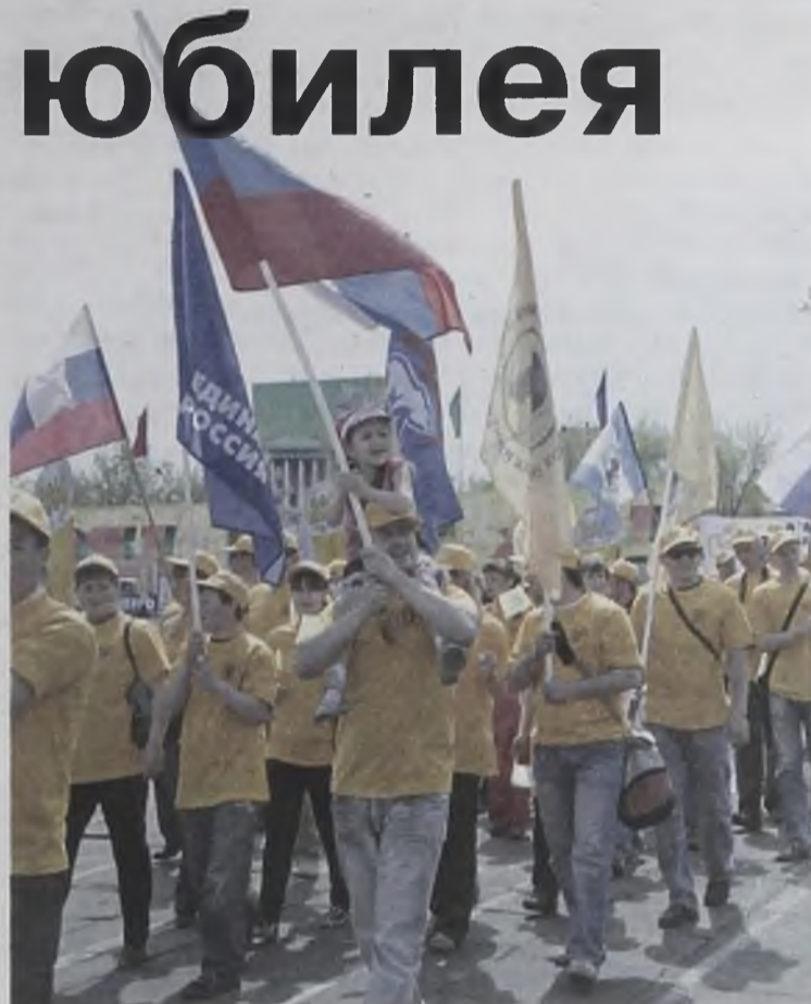
Театрализованный праздник на стадионе открыл парад предприятий Ангарска. На АМО приходится 13 процентов промышленной продукции, производимой в Восточной Сибири