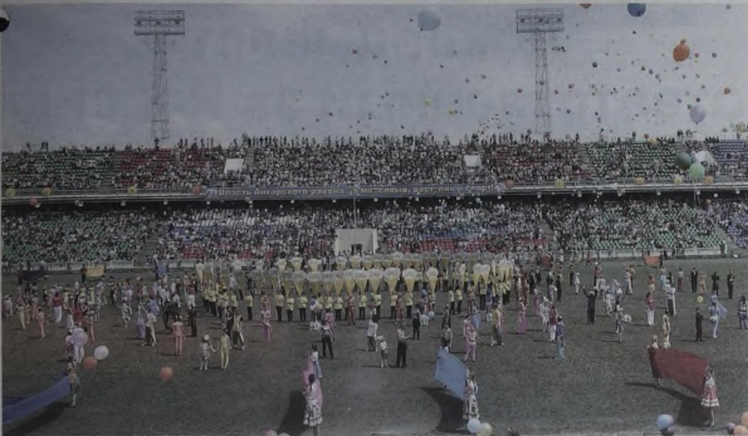
Этот город – самый лучший город на земле!