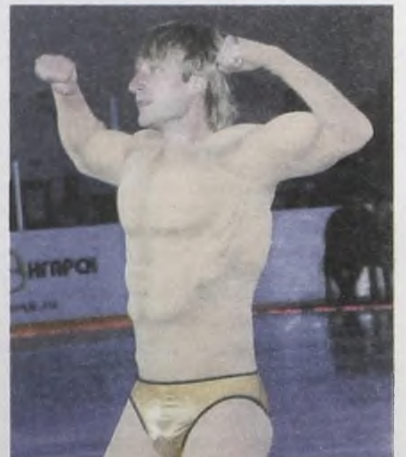
Евгений Плющенко в честь юбилея Ангарска пошутил и показал знаменитый и любимый номер «Секс-бомб». После него подарил верхнюю часть костюма одному из зрителей, а нижнюю пообещал презентовать в следующий приезд

После Ангарска спортсмен отправится в Санкт-Петербург, где две недели будет ставить новую программу, затем – на тренировки и сборы в Испании, Эстонии и Италии. Далее в спортивном графике – этапы Кубка России, чемпионаты России, Европы и мира. Несмотря на столь плотное расписание, Евгений заверил: