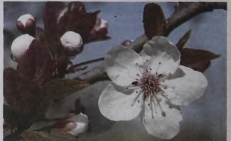
От сливы нужны не только цветочки, но и ягодки

опылителей, из года в год плохо плодоносит и осыпается. Выход тут только один – выбросить это дерево или