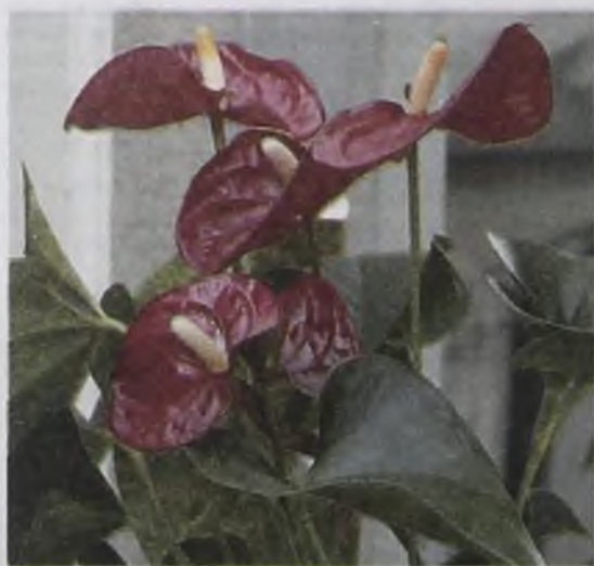
Антуриум – олицетворение храбрости, неординарности, страсти, поэтому он считается мужским цветком. В народе его называют «мужское счастье»

Антуриуму не требуется много земли. Иногда отросток высаживают в большой горшок, а потом года два, пока он разрастается, не могут дожидаться цветов. Экзотическое растение не любит яркого солнца, при попадании