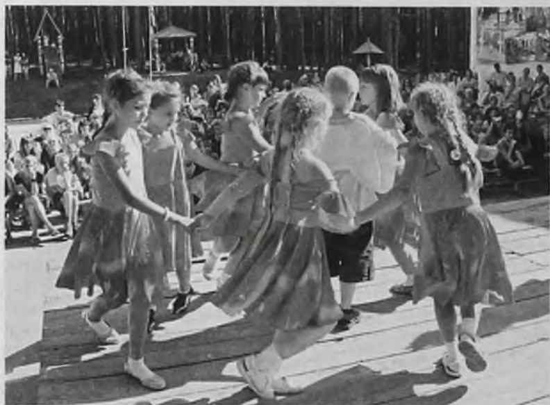
Этим летом маленькие ангарчане отдохнут в «Здоровье», «Саянах», «Юбилейном», а также в других оздоровительных лагерях региона

– Возможность отдыха на безвозмездной основе предоставляется раз в год, – уточни-