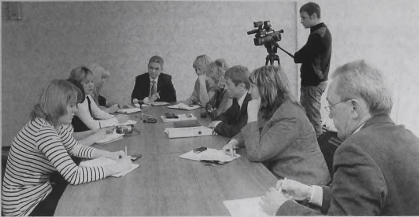
Встреча журналистов с идеологами и исполнителями проекта в пресс-центре газеты «Ангарские ведомости»

К занятиям приступят первые 30 человек. Они прошли