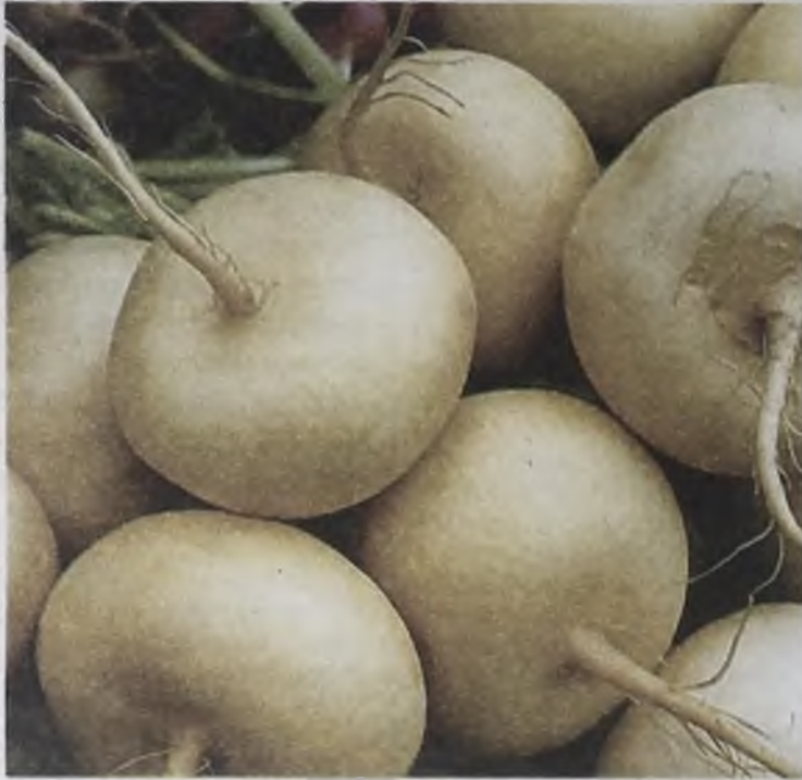
Погрызть репку полезно и пионеру, и пенсионеру

Репой не только кормились, но и лечились. Корнеплод включает в себя на-