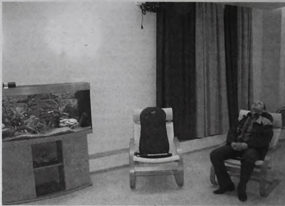
В комнате психологической разгрузки расслабляешься, успокаиваешься, забываешь о неприятностях: о ворчании тещи, о том уроде, что подрезал на перекрестке, чувствуешь прилив сил для трудовых подвигов

проект, направленный на профилактику внешних ситуаций и заботу о здоровье сотрудников. В течение первых часов смены специалисты самостоятельно проходят тестирование в программе «БиоМышь». Компьютерная мышь с помощью встроенного сенсорного датчика в течение двух минут анализирует работу сердечно-сосудистой системы и выводит информацию о самочувствии человека на экран. Если все в порядке – данные сосредоточены в зеленой зоне таб-