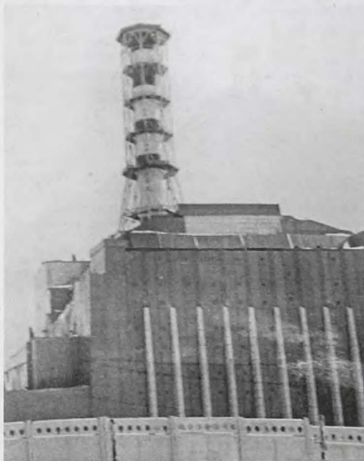
Чернобыльская АЭС времен ликвидации последствий аварии

Во дворце культуры «Энергетик» 26 апреля чествовали ликвидаторов. Этим людям довелось «увидеть ад, бороться с ним».