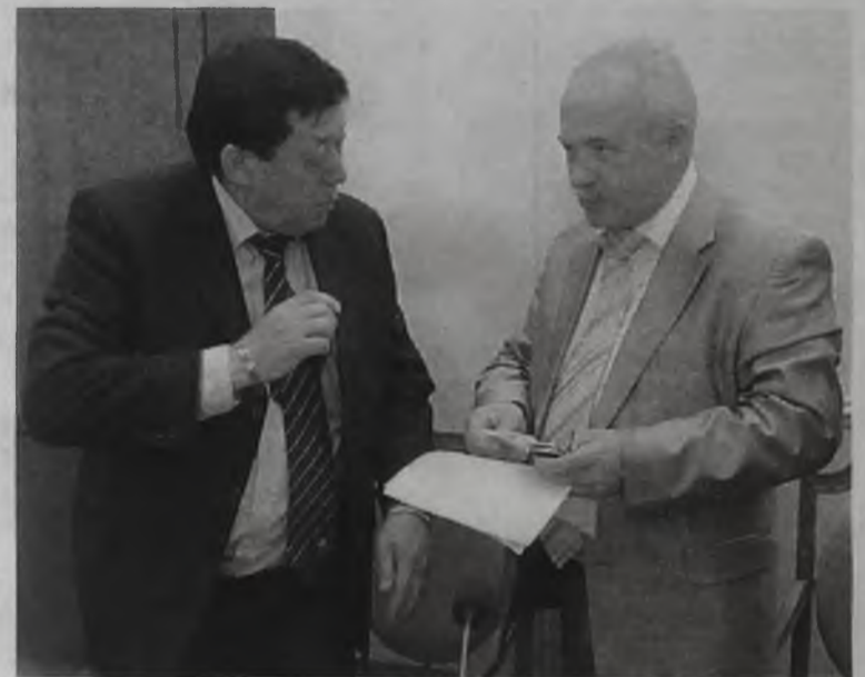
Начало конструктивного диалога

Во время визита консулов представители предприятий и администрации АМО обсудили