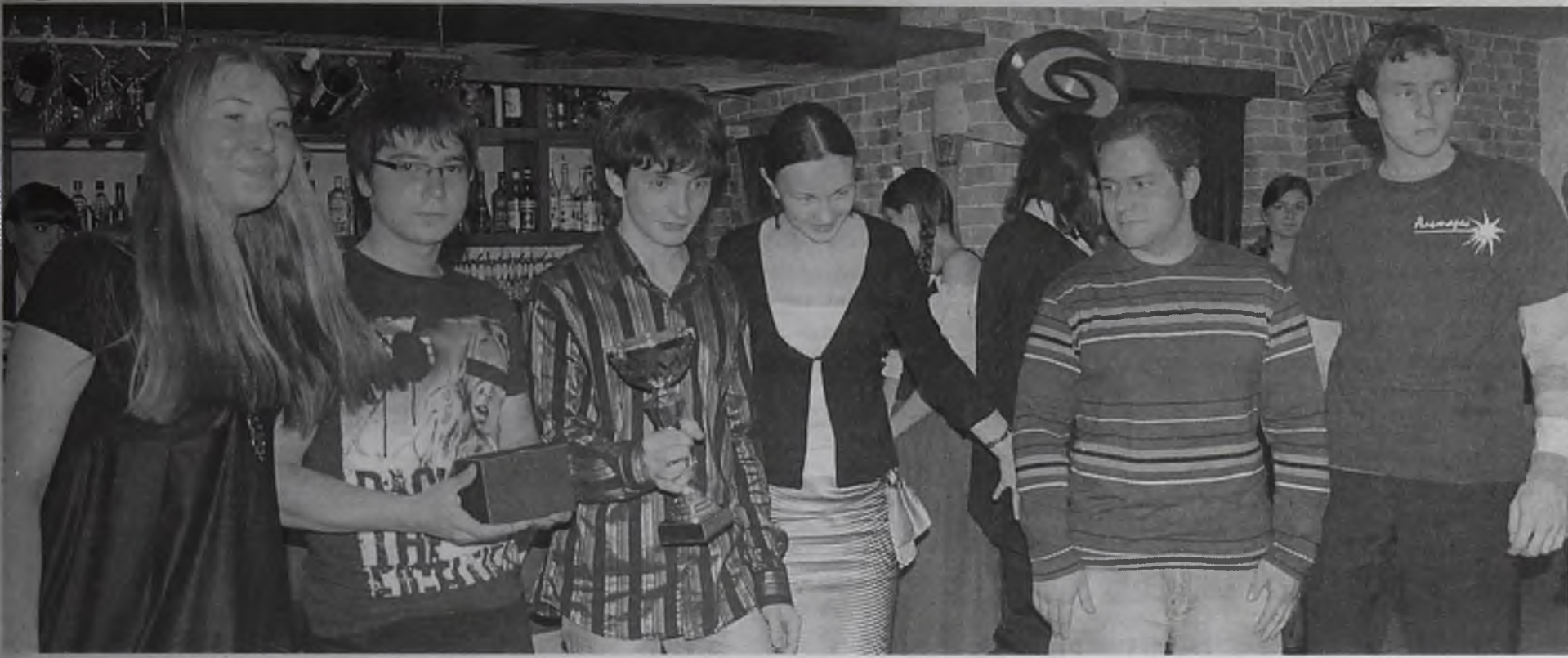
Кто по привычке привык жаловаться, что у нас плохая молодежь, тот никогда не был на ангарских турнирах «Что? Где? Когда?». На игре со звездами школьники легко обошли команды и АЭХК, и АНХК, и учителей, и СМИ заодно