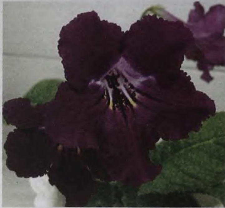
Стрептокактусы стремительно набирают популярность