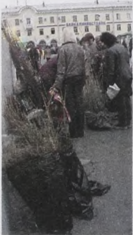
Длинная очередь – признак качества саженцев

Но наряду со специалистами товары на продажу привозят очень разные люди. Среди них встречаются мошенники. Был случай, когда с грузовика продавали яблоньку-дич-