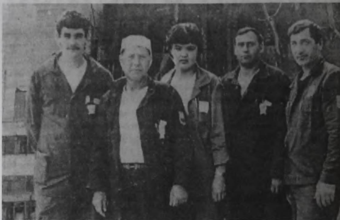
Ангарчане в Чернобыле

В Чернобыле он работал водителем управления малой механизации, занимался буксировкой дизель-станций, компрессо-