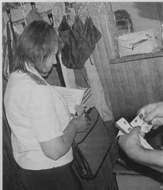
О социальной ответственности должен помнить каждый

Одновременно во всех районах Иркутской области, в том числе и в Ангарске, прошли рейды органов Пенсионного фонда и районных отделов службы судебных приставов по принудительному взысканию задолженности по страховым взносам. Совместные «выходы» проводятся уже во второй раз. Впервые эта мера была предпринята в ноябре 2010 года, а 19 и 20 апреля этого года «все повторилось».