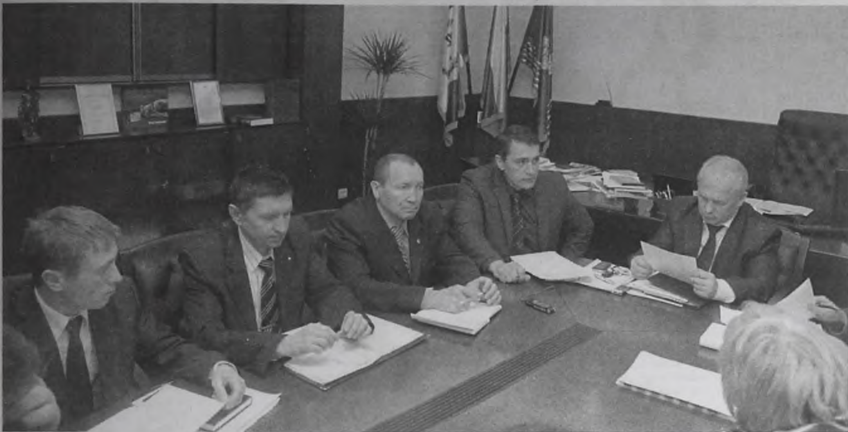
«Работа по профилактике наркомании ведется, снижение идет, оно ощутимо, но недостаточно, чтобы мы все разом успокоились»

Распространение наркотиков и борьба с наркоманией – два воина, которые выступают по разные стороны жизни, а, возможно, и смерти.