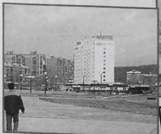
Братск 246,3 тыс.чел.

В Сибирском федеральном округе Приангарье на втором месте по убыли населения (после Алтайского края) – 7 процентов, Иркутская область – 5,9 процента