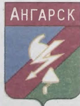
Самый первый герб Ангарска

Очень хотелось бы, чтобы эта красавица, похожая на крылатую богиню Нику, действительно, принесла нашему городу многочисленные победы, достижения и создала приятную среду для проживания ангарчан!