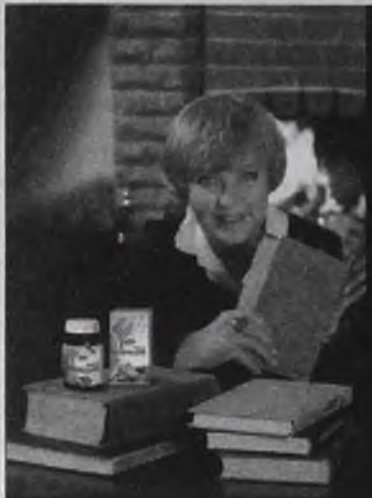
Народная артистка СССР АДА РОГОВЦЕВА

Улучшенная формула по качественному составу бальзама превосходит предыдущие аналоги.