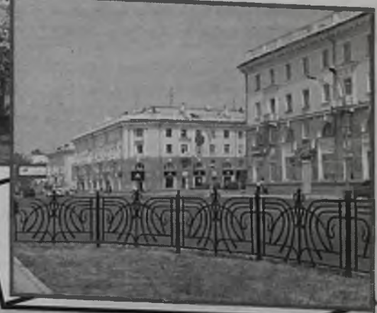
Ангарск 233,5 тыс.чел.