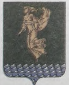
Официальный, утвержденный существующий герб нашего города