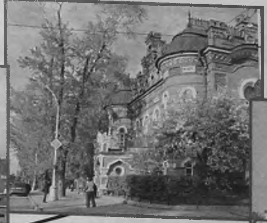
Иркутск 587,1 тыс.чел.