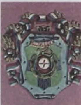
Герб образца 1992 года