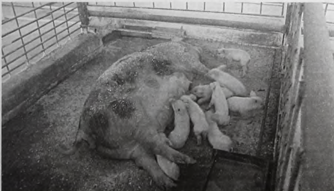
На сегодняшний день в «Звереве» – 1200 свиной, в основном – для увеличения поголовья, а не на забой

Александр Пашков