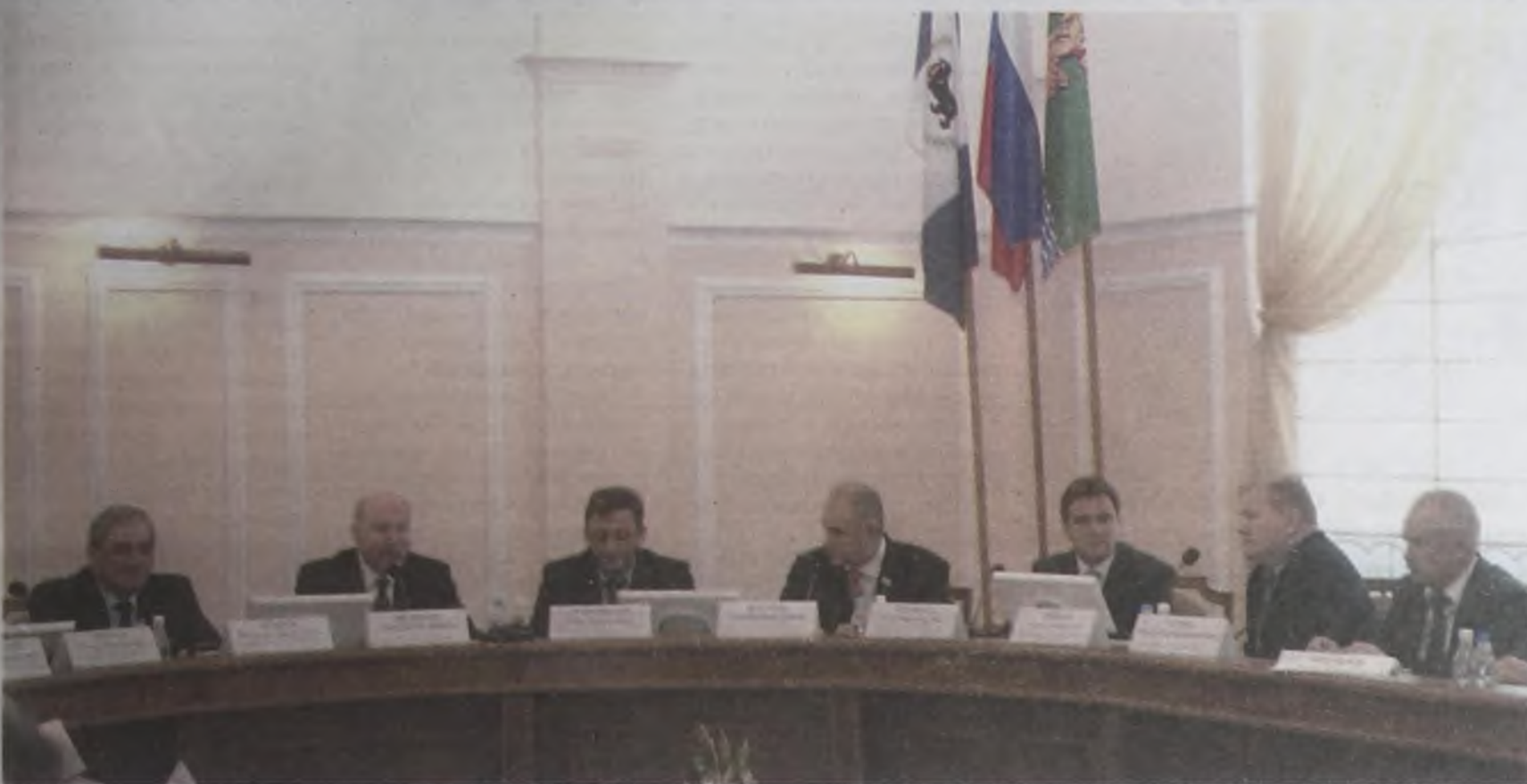
Выездное расширенное совещание Совета Федерации состоялось в Ангарске