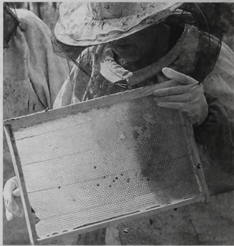
Это правильный мед от правильных пчёл

Испортить натуральный продукт можно даже нагреванием, что нередко делается для более удобной фасовки. Температура свыше 40 градусов губительна для ферментов, составляющих главную