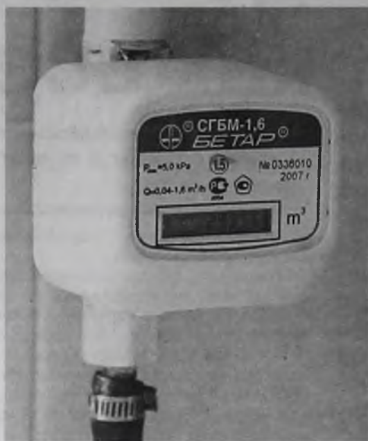
При устойчивом спросе и дефиците товара цены на приборы учета газа будут только повышаться

Я не против приборов учета. Двумя руками «за»! Платить надо только за то, что потребил! Но прежде чем заставлять людей устанавливать счетчики, нужно предоставить приборы учета в достаточном