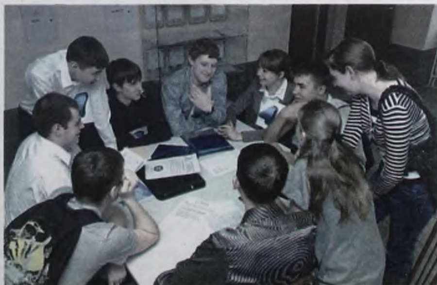
Ребята должны были грамотно аргументировать позицию в отношении перспектив развития атомной энергетики, продемонстрировать знания вопросов экономики, экологии и безопасности атомных объектов

Команды разделились на две группы – «за» и «против». Ребята должны были грамотно аргумен-