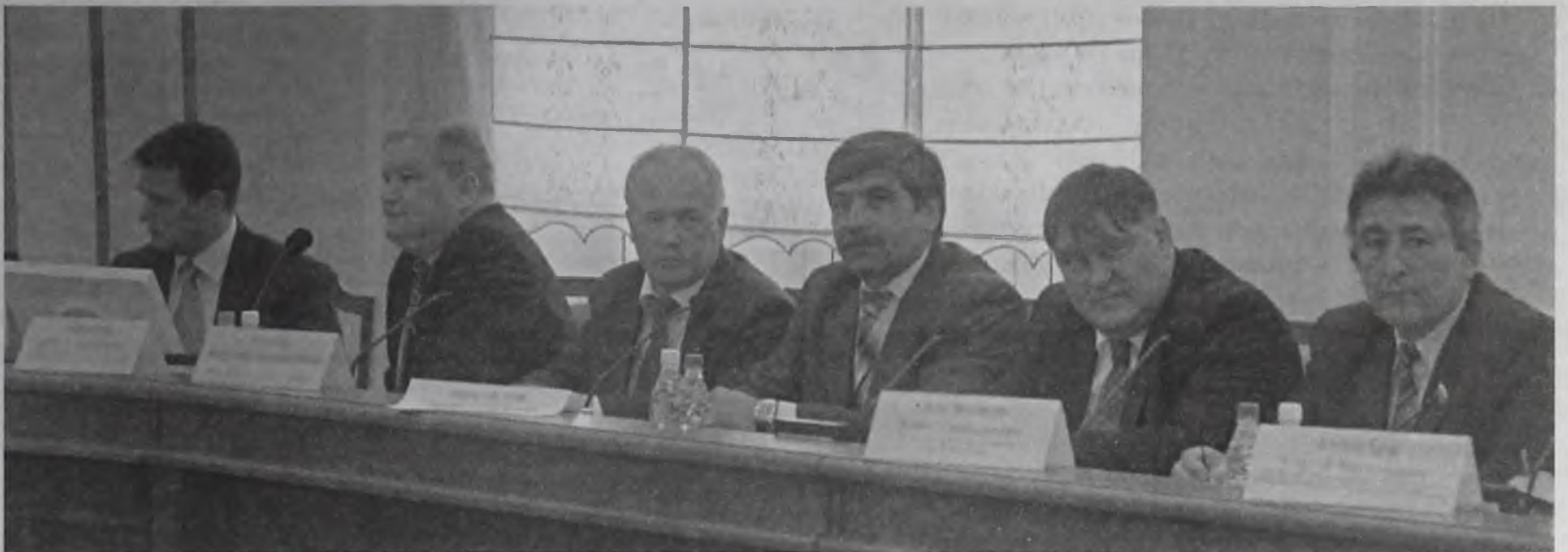
Можно ли решить эти проблемы законодательным путем, почему уже принятые нормативные акты до сих пор не работают, реально ли эффективное взаимодействие властей, генерирующих и управляющих компаний? Эти и другие вопросы обсуждали на выездном расширенном совещании членов Совета Федерации РФ

Губернатор проиллюстрировал данный тезис примером: «Ирина