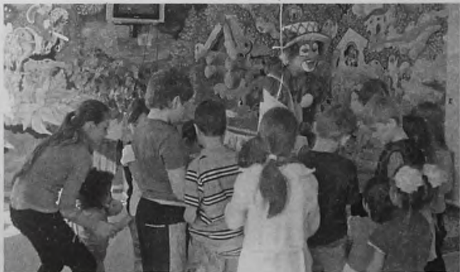
Давно известно: смех и радость улучшают самочувствие, способствуют скорейшему выздоровлению

Благотворительная акция «Максимум улыбок» прошла в Ангарской детской больнице. Праздник смеха и веселья для ребятишек организовали волонтеры.