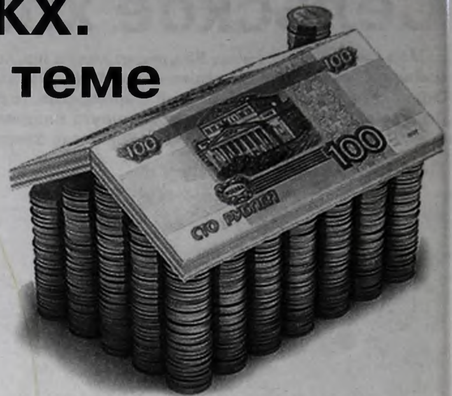
Единой методологии расчета тарифов не существует: сегодня каждый волен сам трактовать, что и в каком объеме входит в тариф, а что не входит

В формировании тарифов ЖКХ гораздо более существенную роль играют тарифы, которые устанавливают ресурсопредоставляющие компании (Иркутскэнерго, Водокан-