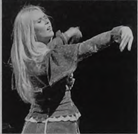
Пелагея была разной. Ворковала голубкой, грустила, срывалась на плач, кружилась, как в половецких плясках

Звучали казачьи и цыганские напевы, наивные самоироничные народные романсы, старорусские песнопения. Она была разной. Ворковала голубкой, грустила, срывалась на плач, кружилась, как в половецких плясках. А после песни «Стежки-дорожки», в которую была включена цитата из оперы, сказала робкое «Спасибо» и добавила: «Мы очень волнуемся, когда впервые приезжаем в город. Так волновались мы и перед этим концертом. Как воспримут, поймут ли? Ведь у нас непростой материал. А вы все поняли. Спасибо вам за