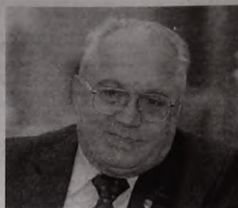
Виктор Садовничай, ректор МГУ, выступая на церемонии открытия Года химии в России РАН

«Мне кажется, здесь делают сейчас ошибку со школой. Школа должна обязательно иметь дисциплины, связанные с физикой, химией, математикой, потому что это — база. Базовое образование в школе обязательно быть сильным».