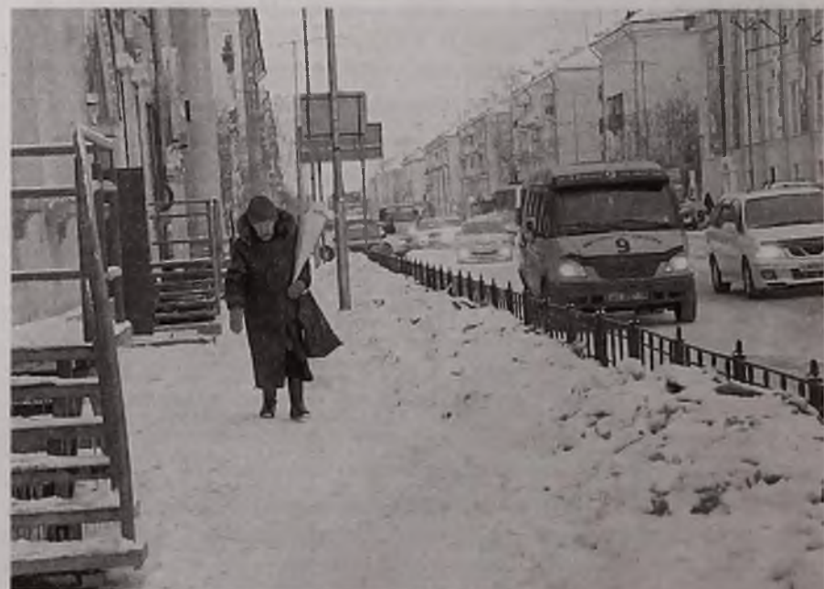
Из-за некачественной уборки снега пешеходы не чувствуют себя в безопасности даже на тротуаре