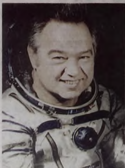
Георгий Гречко — летчик-космонавт, установивший рекорд СССР и мировой рекорд по продолжительности космических полетов

В каждый визит Гречко стремился побывать на предприятиях города, встретиться с простыми ангарчанами и ангарчанами «посложнее». Он стал одним из первых почет-