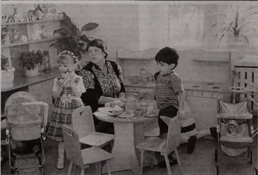
Новая группа открылась в детском учреждении № 94 во вторник, 22 февраля. Она рассчитана на 20 детей