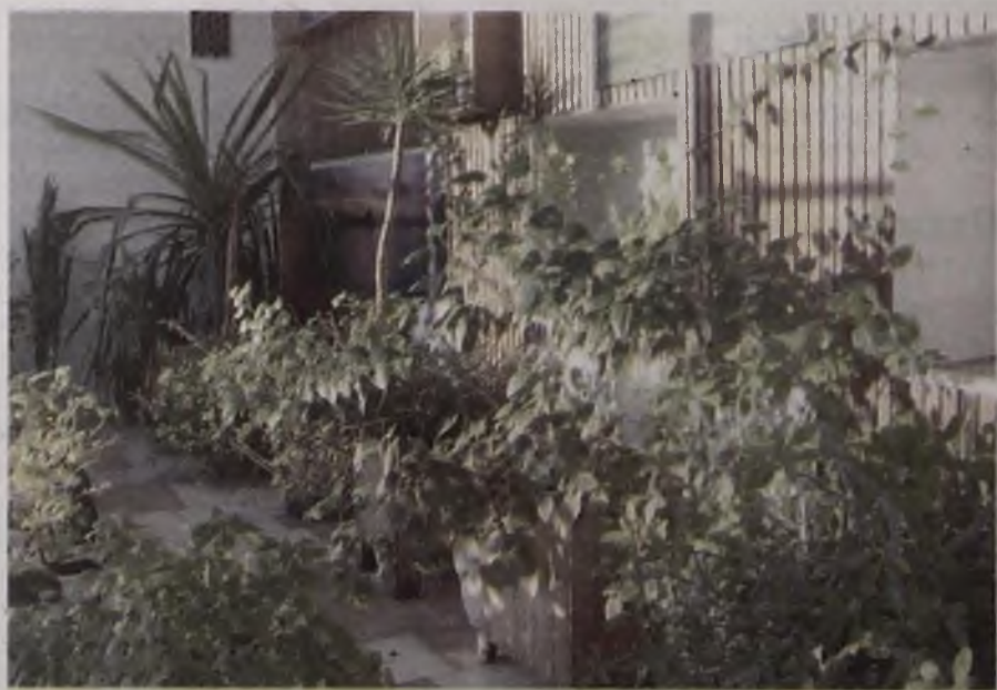
И пусть на улице минус 30°, в зимнем саду всегда тепло и солнечно

Дендрологу идея понравилась, и она стала привозить в Ангарск кокосовые и финиковые пальмы, плющи, камелии, азалии и кактусы. Все это прижилось, несмотря на суровые