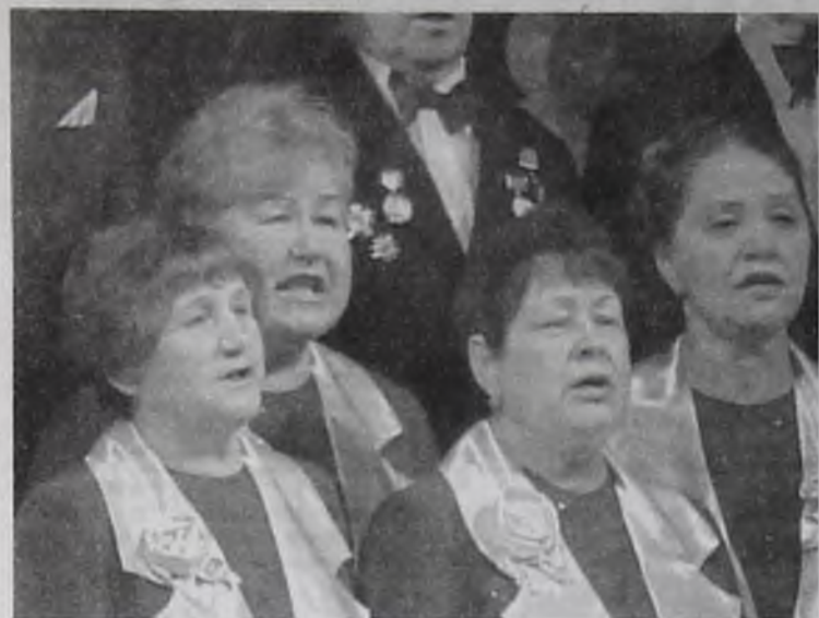
Все участники заключительного концерта городского фестиваля примут участие в юбилейных торжествах