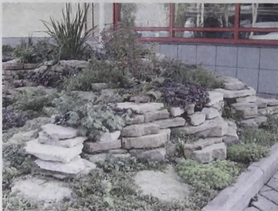
Сад ваш, а пейзаж швейцарский