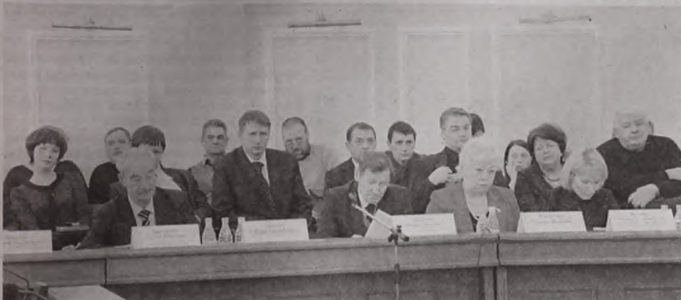
За выборами главы администрации Ангарского района наблюдали почетные граждане, представители аппарата губернатора, депутаты Законодательного собрания, прокурор Ангарска

Внеочередное заседание Думы АМО, на котором рассматривался вопрос о назначении на должность главы администрации Ангарского муниципального образования, состоялось в минувший четверг, 17 февраля.