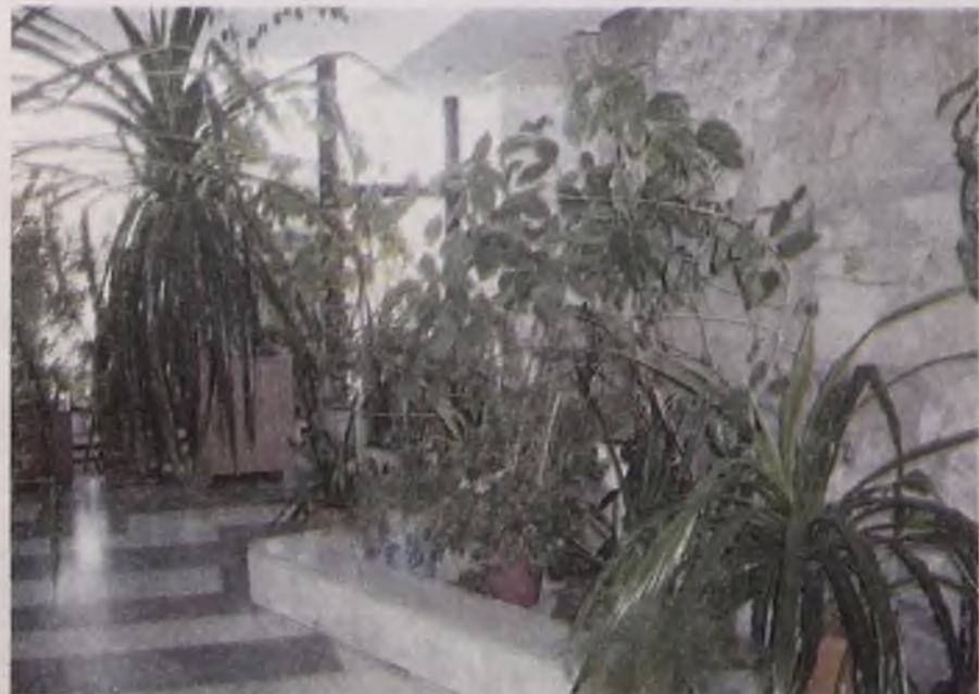
В зимнем саду «Современника» можно расслабиться и «подумать о вечном»

Но, как это всегда бывает, сами хозяева, то есть мы с вами, настолько привыкли к опунциям и молочаям, произрастающим во Дворце, что и за чудо-то их не считаем. А зря! Не во всех дворцах, да что там дворцах! — не во всех городах есть такое чудо-чудное, дивное, как зимний сад в ДК «Современник».