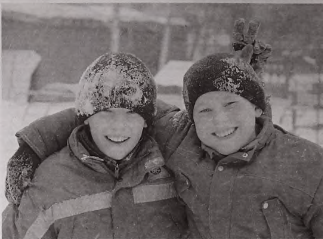
Воспитанники областного детского дома чаще улыбаются — это лучший подарок к юбилею

Воспитанники детского дома учатся в обычных общеобразовательных школах №№ 3 и 24, которые находятся неподалеку. Вернувшись «домой» и сделав уроки, ребята отправляются в кружки и секции, которых здесь не перечесть: шахматы, вольная борьба, вокальный ансамбль, тестопластика и флористика, центр развития личности (отдельно для