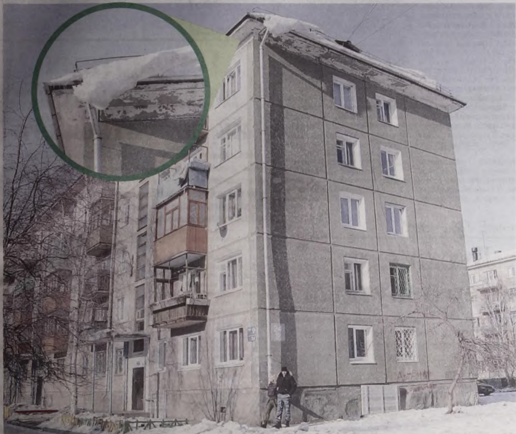
Чтобы избежать неприятностей, надо самому быть осторожным и детям строго-настрою наказать не ходить под крышами, где нависают сосульки. Целее будет!

Каждый год одно и то же: весна, оттепель, сосульки! Ледяные и снежные наросты грозят обрушиться с крыш на головы неосторожных прохожих. Поберегитесь!