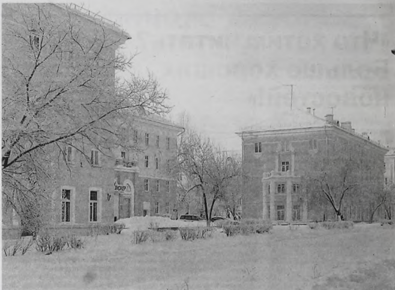
Сфера ЖКХ в Ангарске всегда вызывала много споров