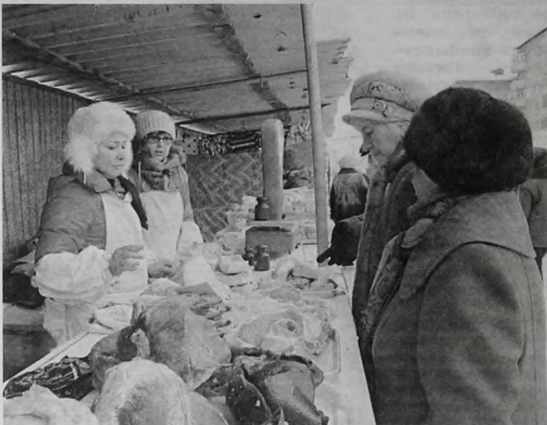
На рынке «Сибирячок» ангарчане вновь смогут купить недорогую и качественную продукцию

10-15 процентов ниже, чем в магазинах розничной торговли. Свежая и копченая рыба, ассортимент мясной продукции, мороженое и все, что нужно к новому столу также можно будет приобрести и в ДК нефтехимиков. Там ярмарки пройдут 22 и 25 декабря. Начало в 12 часов.