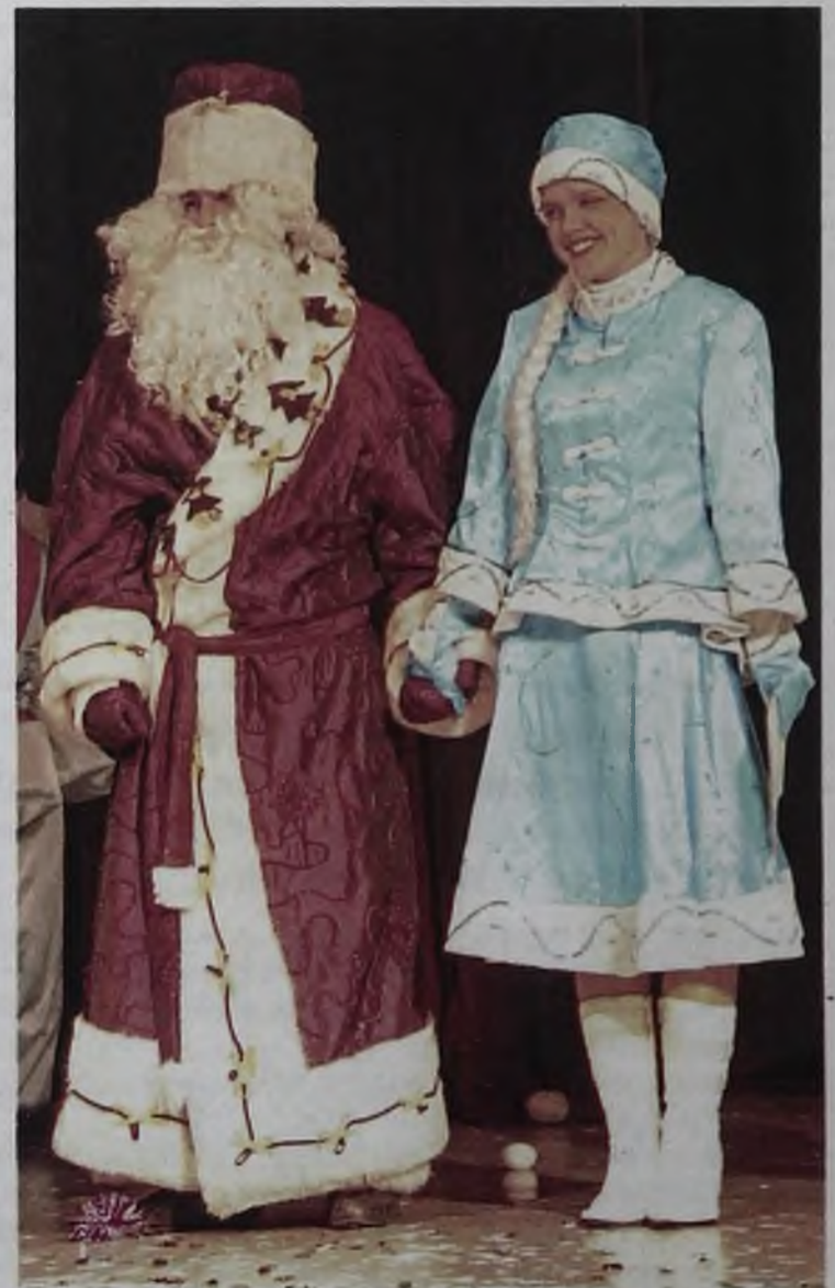
Подготовила Марина Томских