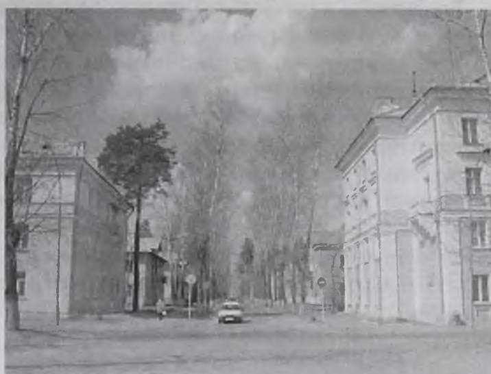
Улица Октябрьская. Здесь находится первый кирпичный дом

что первые ясли были расположены в нынешнем здании челюстно-лицевой клиники, что памятник Ленину собирали по частям и открыли 21 апреля 1961 го-