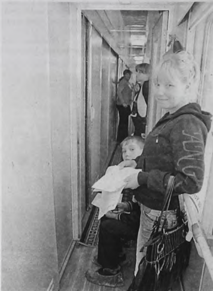
Поезд-поликлиника создан таким образом, что пациент сначала попадает в регистратуру, затем направляется в диагностическую лабораторию и, получив результаты экспресс-анализов, в течение дня обследуется у специалистов