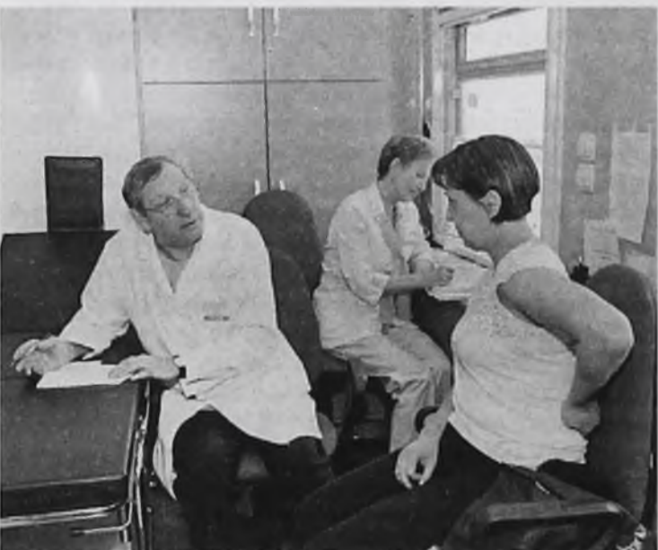
Врачи и медсестры трудятся, пока в поезде есть пациенты. Рабочий день длится до 8-9 часов вечера