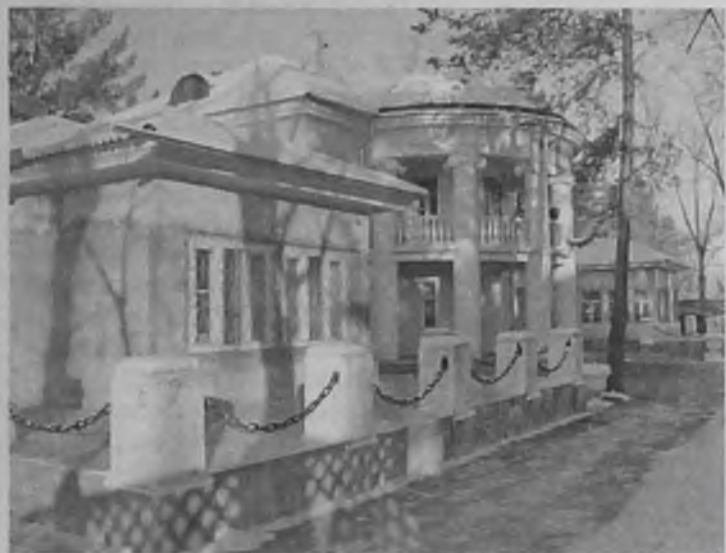
Здесь располагались первые в нашем городе ясли