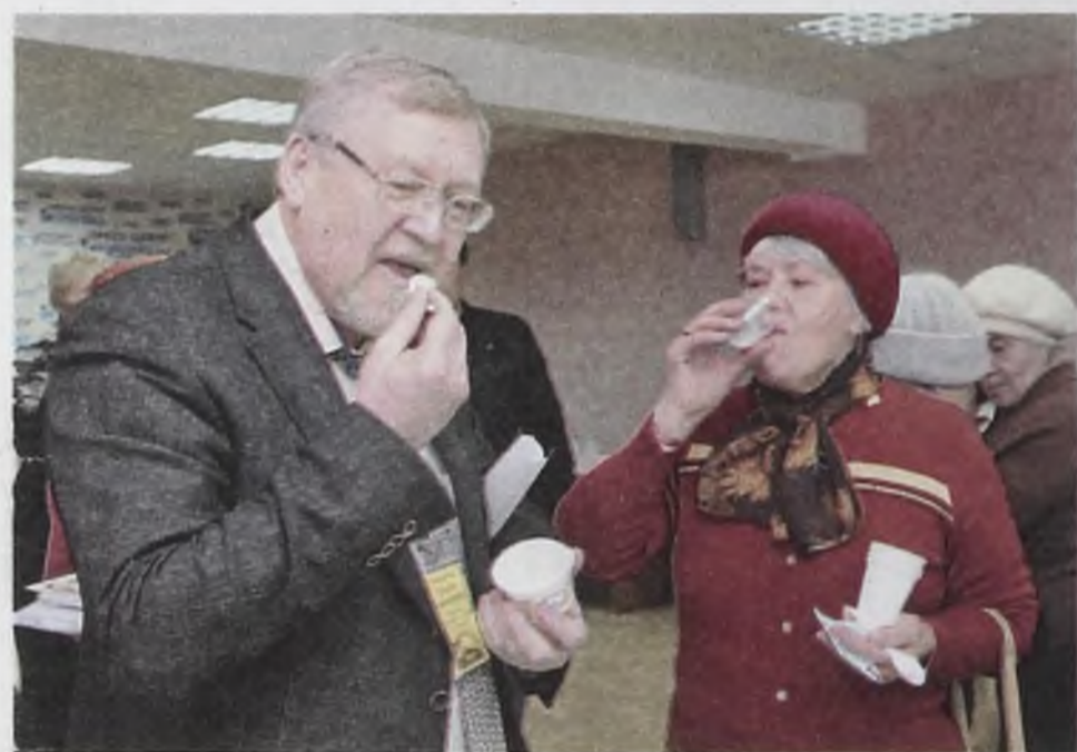
У конкурентов вкусно, а дома – пальчики оближешь