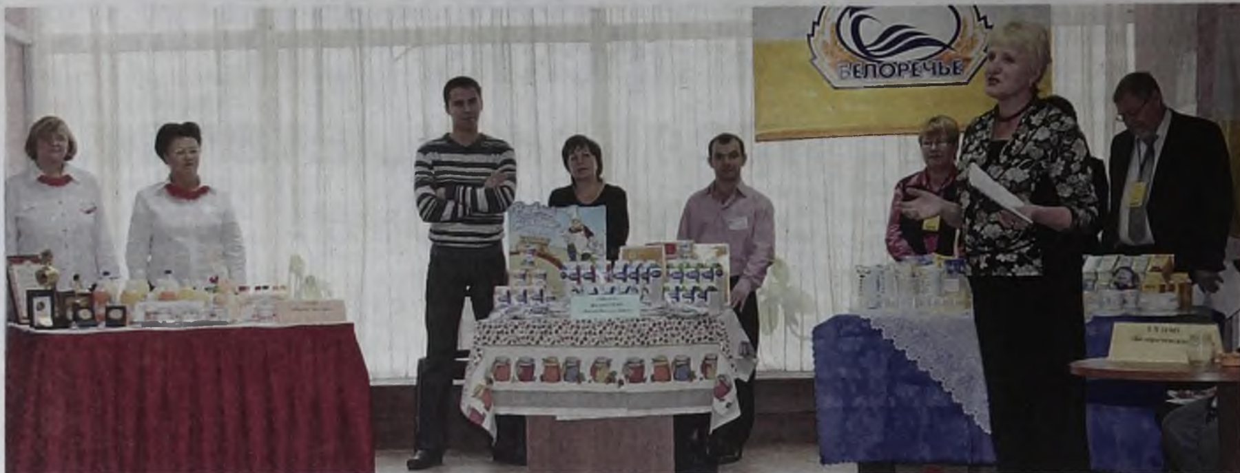
Всем предприятиям – участникам дегустации – были вручены благодарственные письма от мэра АМО

Сказочные мечты сбываются не только в Новый год, но и во Всемирный день качества. В пресс-центре «Ангарские ведомости» 11 ноября текли молочные реки в кисельных берегах. Продукцию представили три предприятия: ООО «Фирма Лактовит», СХ ОАО «Белореченское», «Молка» (филиал ОАО «Вимм-Билль-Данн»), а оценить на вкус молочное изобилие могли все желающие.