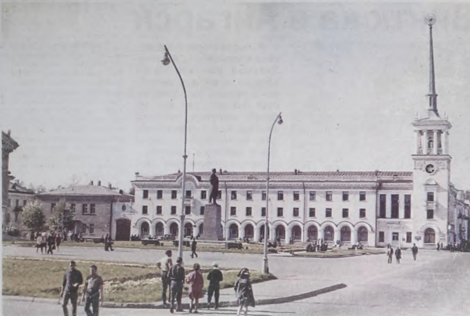
На фото из архива – кадр кинохроники, где площадь Ленина со старинными фонарями и здание почтамта со звездой вместо часов.

Выход второй серии телеочерка – это подарок всем жителям Ангарска, ветеранам, первостроителям в ка-