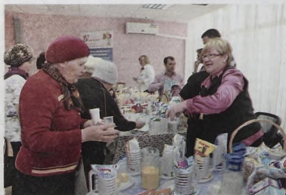
«Но как на свете без любви прожить?» – жалобно вопрошала со сцены Алла Пугачёва. «Любовь приходит и уходит, а кушать хочется всегда», – ответили бы ей участники дегустации. А если бы певица побывала на нашем мероприятии, слова песни прозвучали уже по-другому: «Но как на свете без еды прожить?»