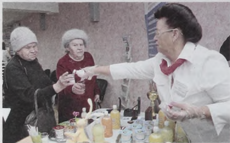
Ну, за внуков!