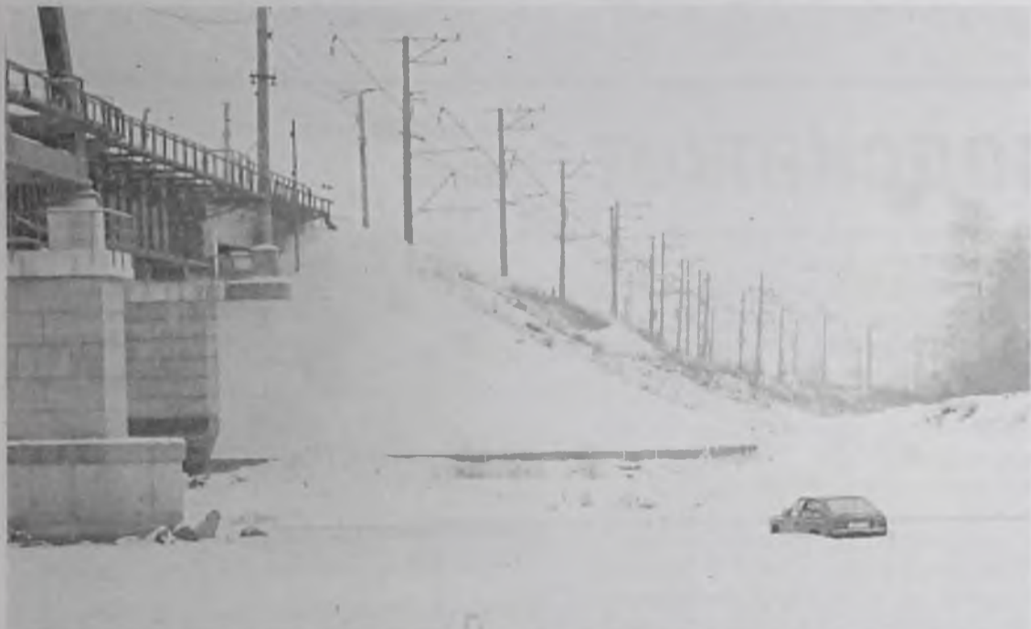
Наказания за проезд по несанкционированной переправе нет, это остаётся «на совести» водителя

Чьих рук дело спасение утопающих, инспекторы по маломерным судам знают на сто процентов. Поэтому и говорят: «Мы можем только предостеречь». Наказания за проезд по несанкционированной переправе нет, это остаётся «на совести» водителя. Хотя дело тут скорее в инстинкте самосохранения, но и с совестью у сограждан не всегда лады.