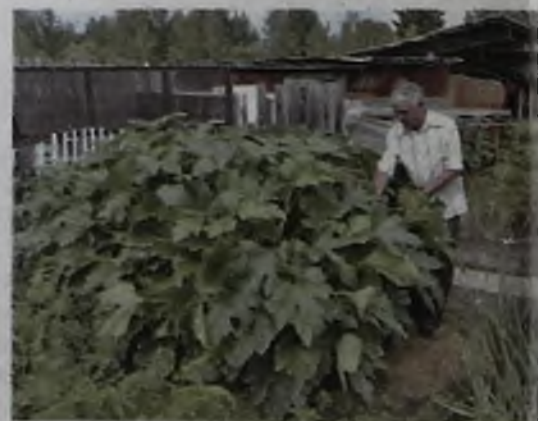
Подготовила Ирина Бритова.

Вы зря считаете, что опыт предков забыт. Самые лучшие и овощи, и плодово-ягодные деревья будут расти и плодоносить, если их выращивать на такой почве, о которой Вы пишете. Это органическое земледелие, и оно не забыто. Так выращивают зелень и овощи очень многие наши садоводы-любители.