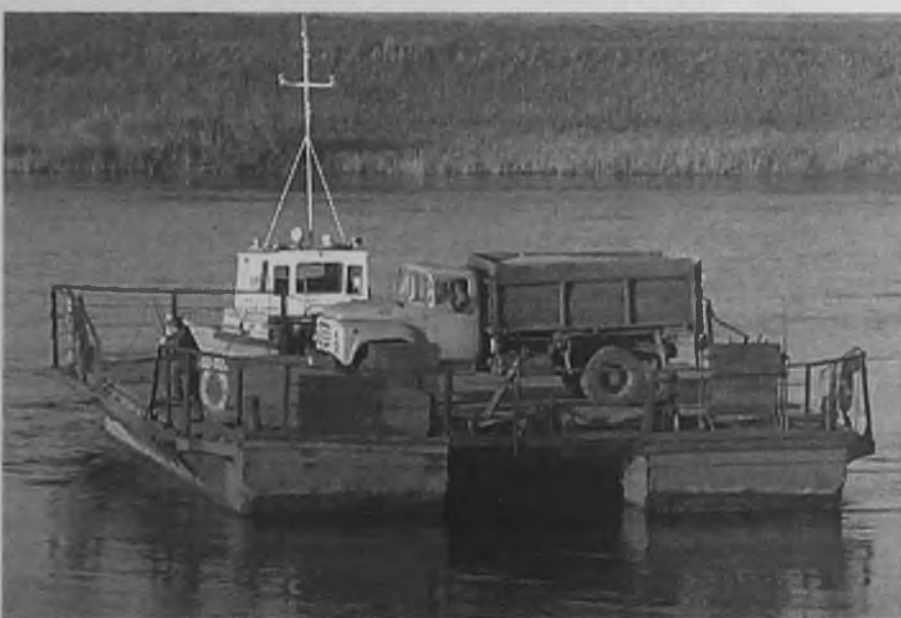
Грибники и садоводы, рыбаки и охотники с удовольствием пользуются услугами парома

В далёком 1985 году областные власти решили устроить паромное сообщение между правым и левым берегами реки Ангары, соединив таким образом промышленные центры Прибайкалья с сельскохозяйственными районами Усть-Ордынского бурятского автономного округа. Первые годы