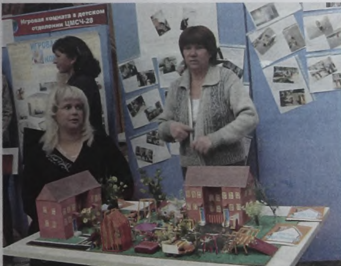
На ярмарке было представлено 39 проектов