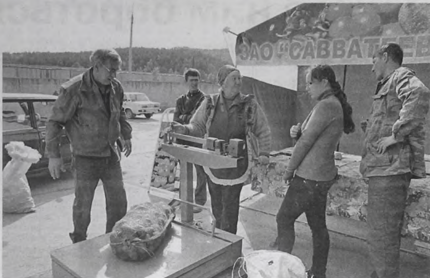
В Сибири картошку не растить – без доходов быть

ЗАО «Савватеевское» бюджетные деньги своевременно направило на покупку современных технологий выращивания овощей. В итоге даже не в самых благоприятных погодных условиях в накладе не остаётся. В нынешнем году урожайность картофеля составляет до 35 тонн с гектара. Для сравнения, средняя урожайность по Иркутской области – 16-18 тонн с гектара.