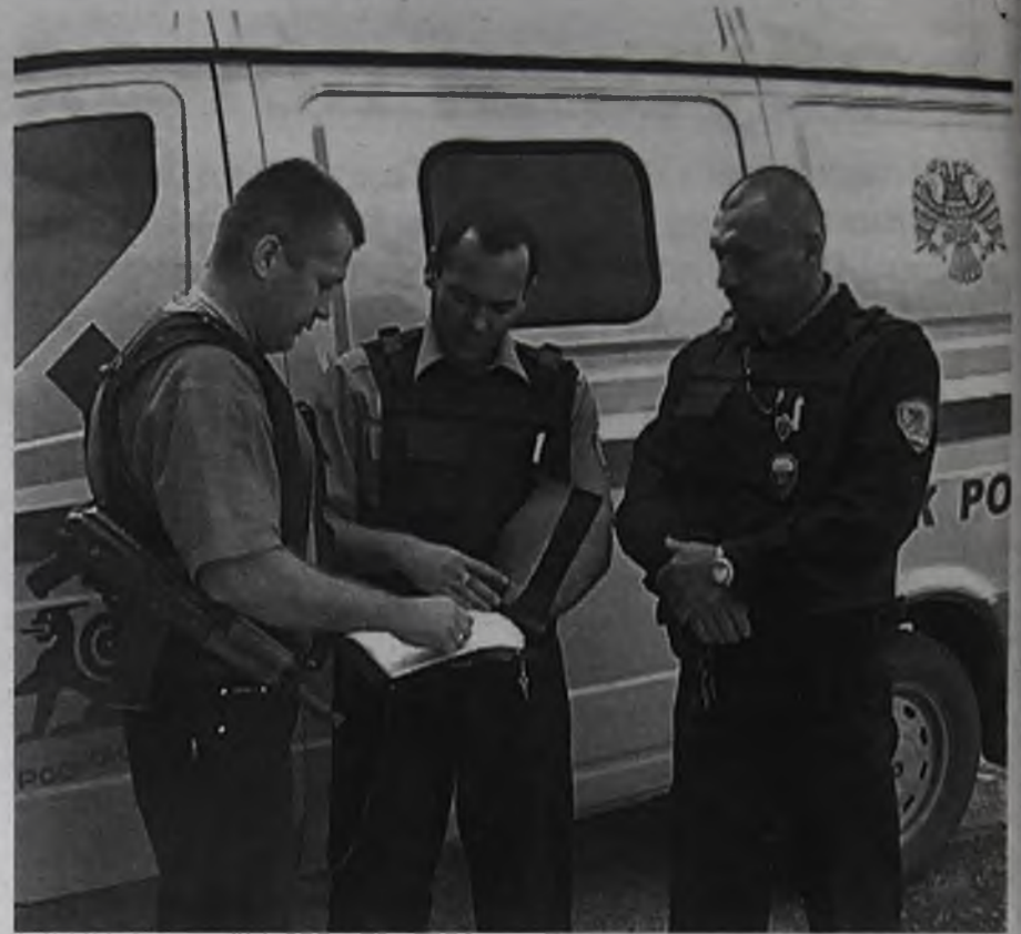
Прорабатываем маршрут, оцениваем ситуацию – и в путь