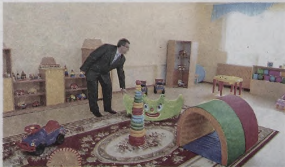
В такой сад сам бы ходил!

Всего с начала этого года в Ангарском районе было введено 220 дополнительных мест на базе существующих детских садов. Их большая часть рассчитана на малышей раннего возраста. А через несколько дней после капитального ремонта в центре города откроется ещё одно дошкольное учреждение