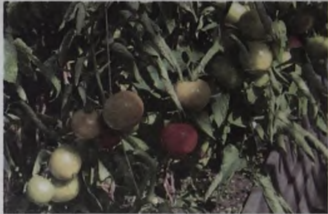
Индетерминантные сорта дают щедрый урожай при постоянном уходе

Если нет хорошей теплицы, или дача находится в отдаленных садоводствах, куда ездить приходится один-два раза в неделю и ухаживать за растениями ежедневно нет возможности, лучше отойти от индетерминантных сортов томатов. Так как в холодных условиях куст дает всего