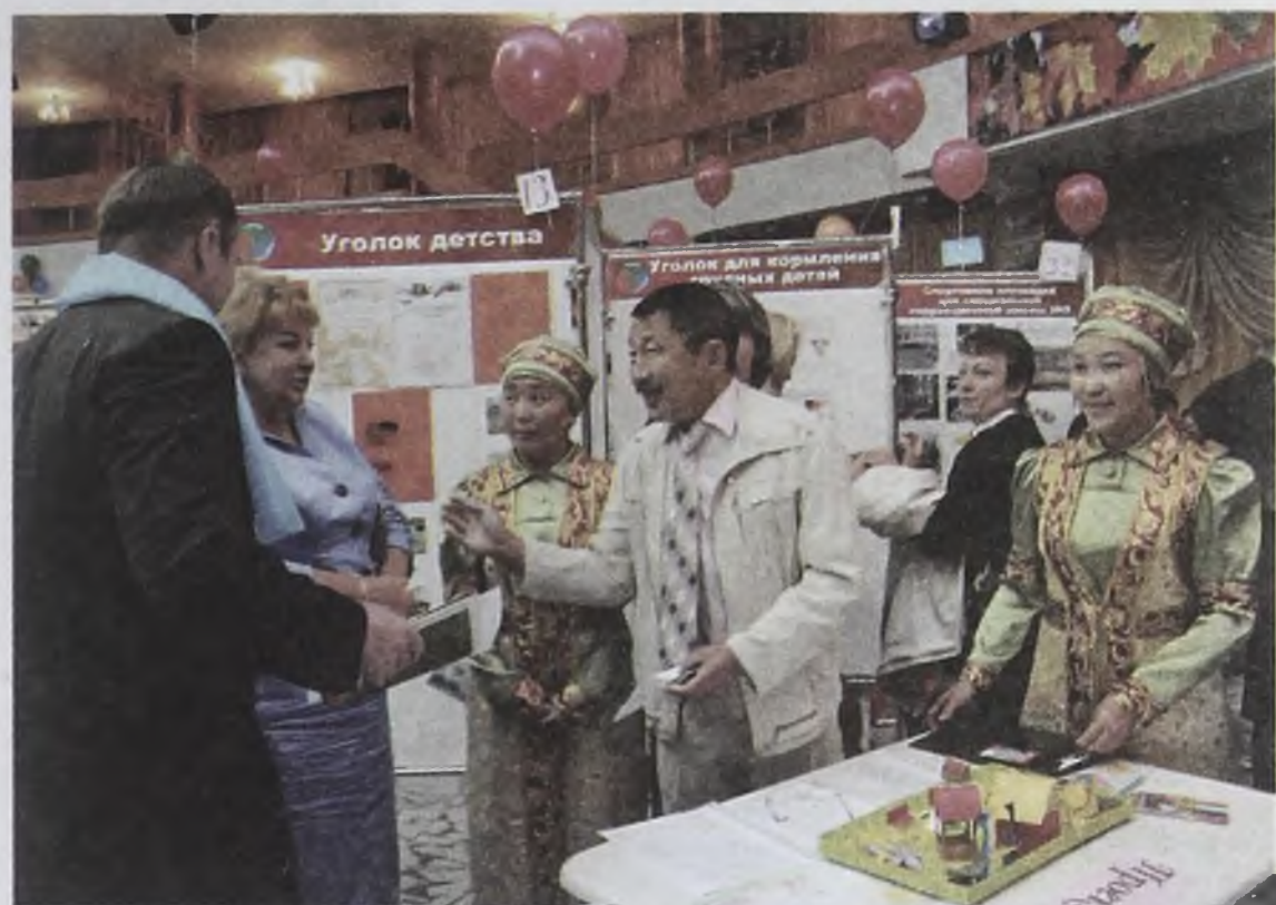
Представители Одинска привезли на ярмарку проект детской площадки