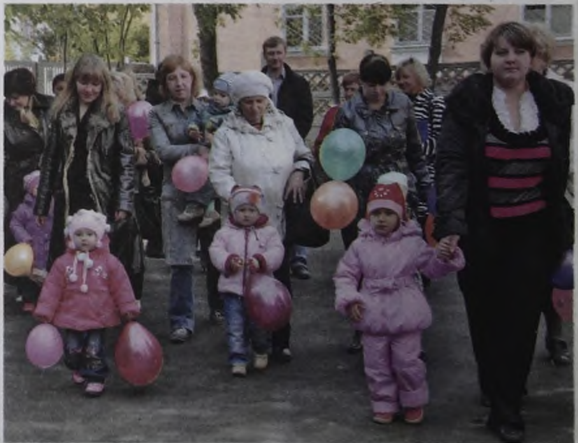
Марш с шариками гораздо приятнее, чем марш с колясками

Подрядчики подготовили детский сад под ключ. Новые окна, двери, коммуникации... От старого учреждения остались только стены. Из районного бюджета также было профинансировано приобретение мебели, технологического оборудования, игрушек.