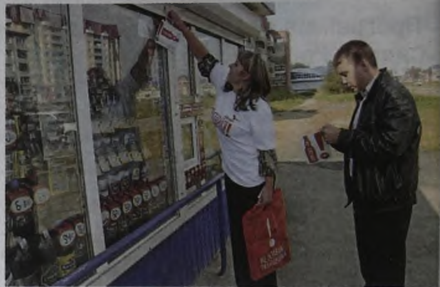
Участников акции можно было узнать по белым майкам со специальным логотипом