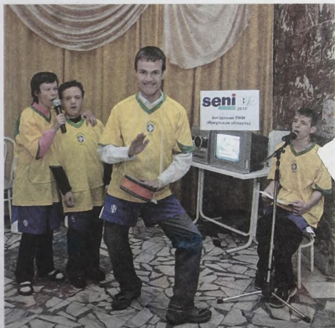
Наибольший интерес вызвали проекты, связанные с реабилитацией детей-инвалидов