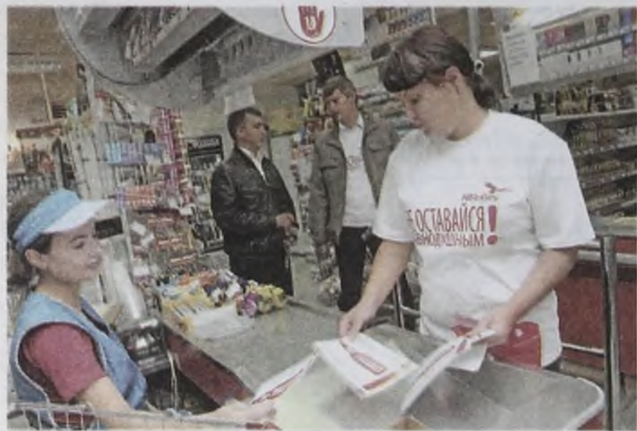
Не оставайся равнодушным, если увидишь, что продают пиво несовершеннолетним!