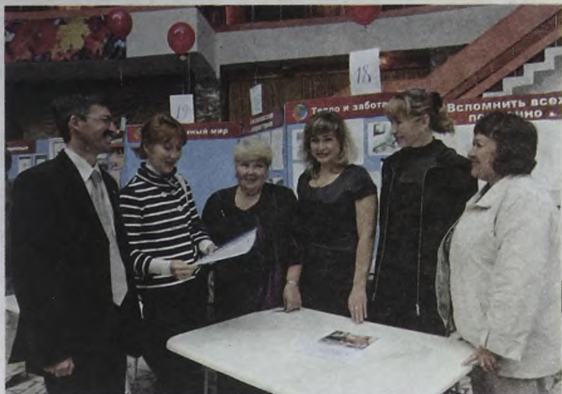
Вторая ярмарка социальных проектов, которая состоялась в ДК «Современник» 16 сентября, в очередной раз показала: бизнесмены и предприниматели не остались в стороне