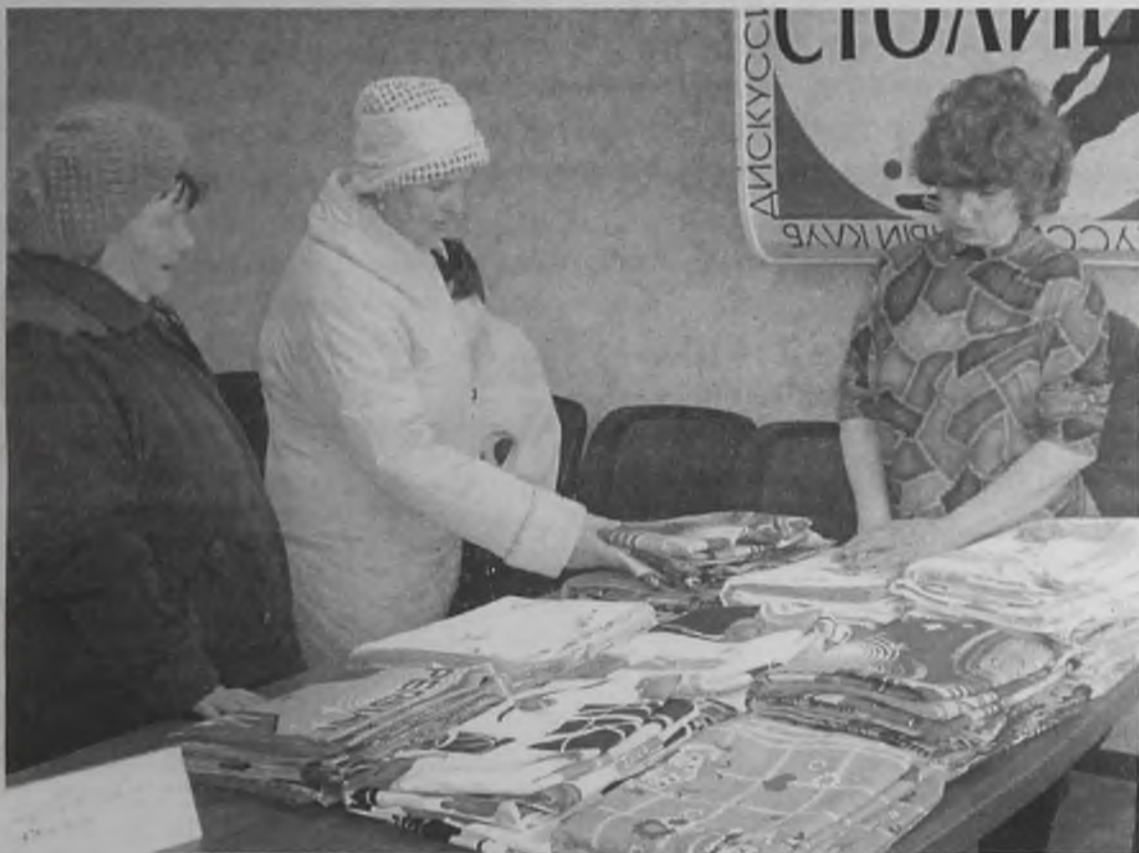
Приобретая изделия, сшитые в общественной организации инвалидов «Феникс», вы поддерживаете этих людей не только материально, но и морально

Выставка-продажа изделий, которые изготавливают в общественной организации инвалидов «Феникс», с успехом прошла на базе пресс-центра «Ангарские ведомости» в конце марта. По многочисленным просьбам ангарчан в рамках празднования Дня пожилого человека редакция газеты «Ангарские ведомости» совместно с общественной организацией «Феникс» вновь организует выставку-продажу.