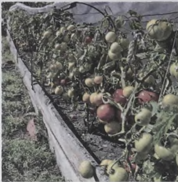
Новые сорта томатов не требуют особого ухода, но при этом отличаются урожайностью. С одного кустика за лето можно собрать 3-4 килограмма помидоров