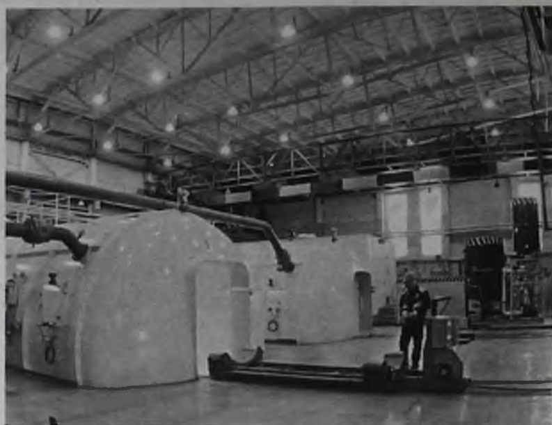
Установка перелива гексофторида урана

Комбинат в полном объёме и в установленные сроки исполняет