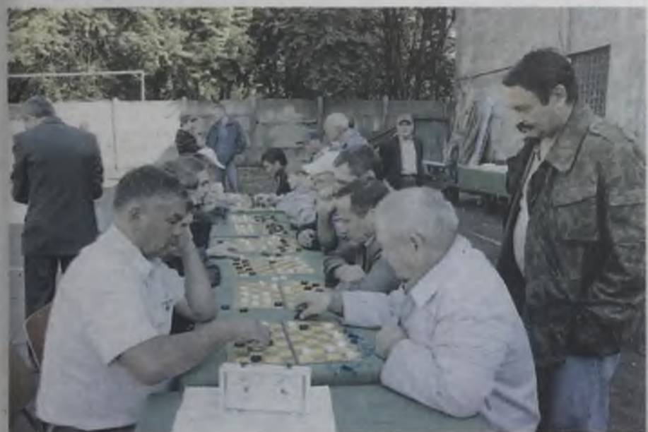
Благодаря хорошей погоде, турниры по шахматам и шашкам удалось провести на свежем воздухе