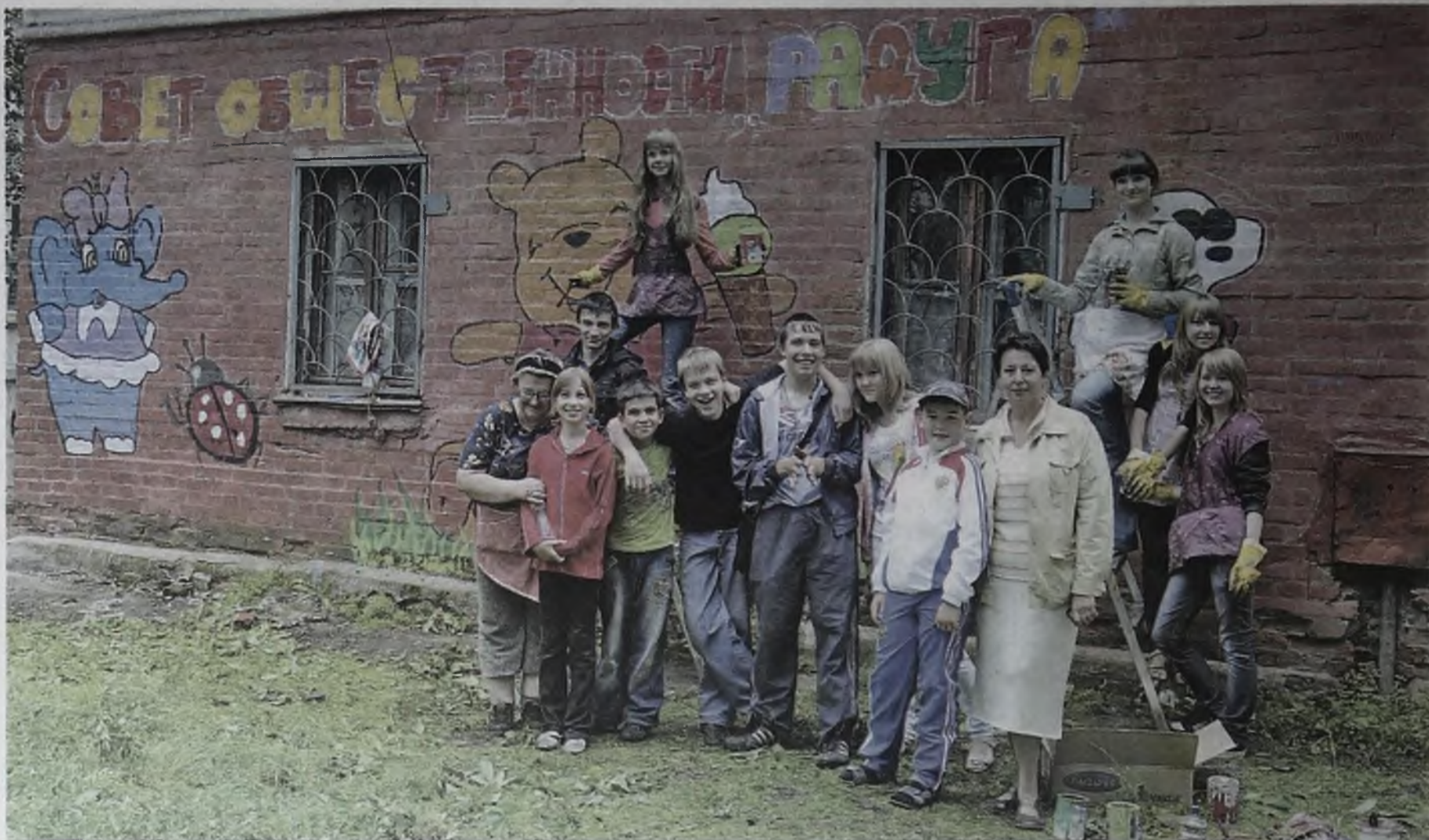
Помощников для воплощения замыслов нашлось много: местная детвора с удовольствием включилась в работу