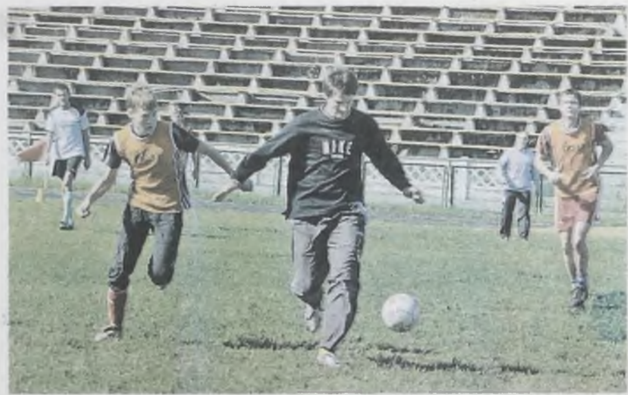
Чемпионы мира тоже начинали с дворовых площадок