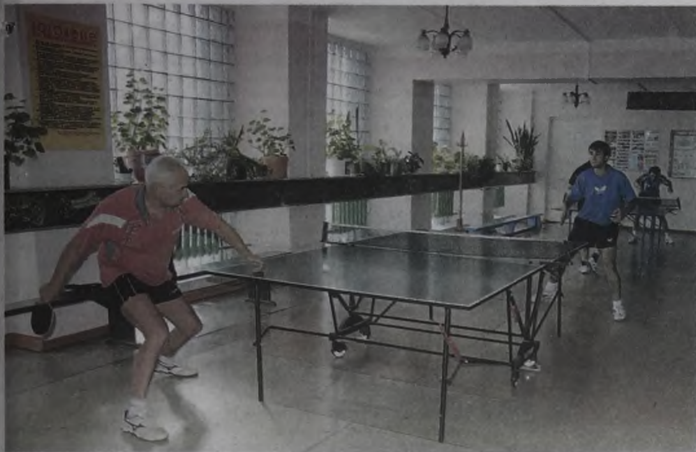
Теперь праздник проходит не только на стадионе, но и на спортивных площадках по всему городу