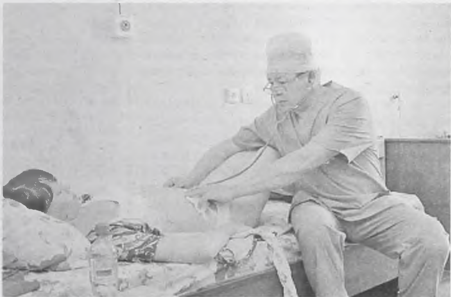
Хирургия – это наполовину наука, наполовину – искусство. И это как раз та область, где лучше учиться на чужих ошибках. Свои слишком дорого обходятся