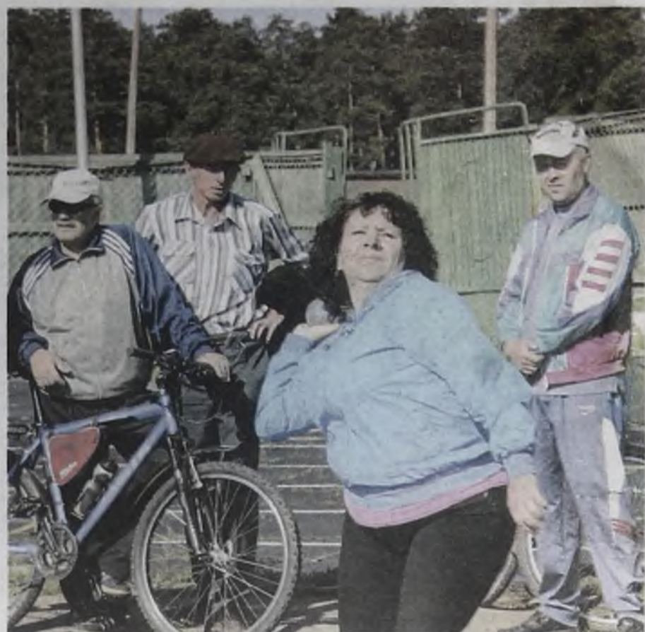
Быстрее, выше, сильнее – девиз на все времена