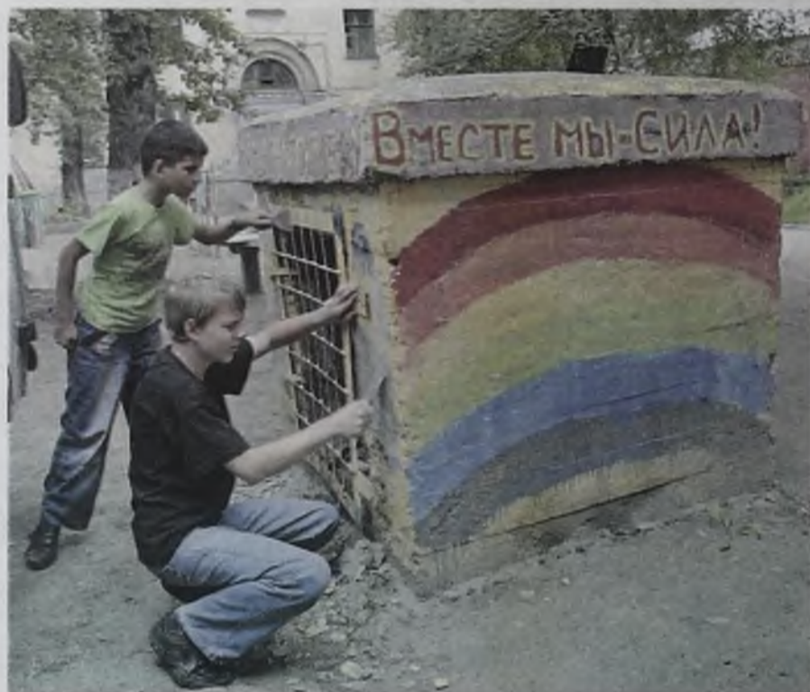
Неказистые дворовые сооружения дети превращают в арт-объекты