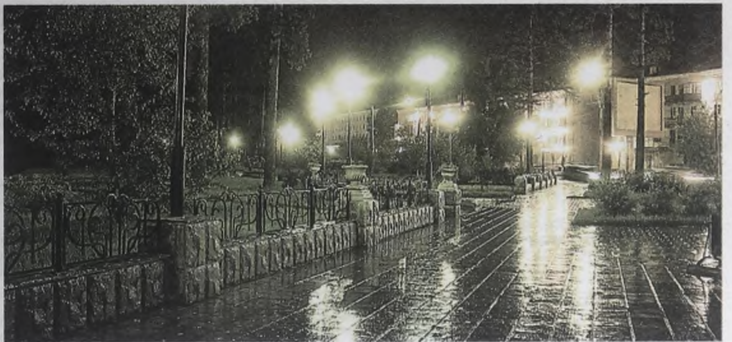
Сквер на перекрестке улиц Чайковского и Карла Маркса