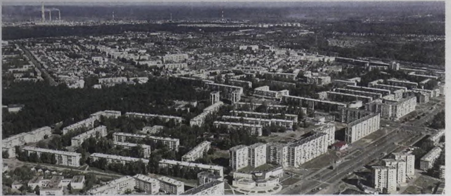
7 а микрорайон с высоты птичьего полета. Съемка с дельтаплана