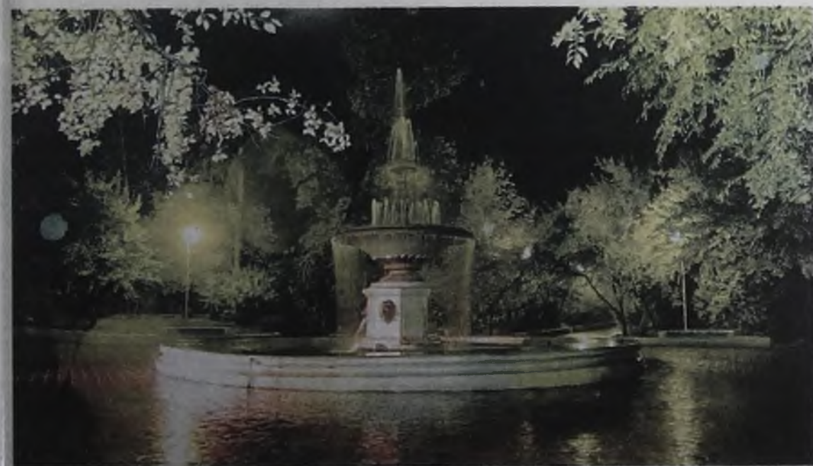
Фонтан в парке за ДК нефтехимиков. Фотография сделана с подсветкой фар пяти машин