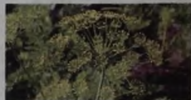
Кто вперед съест укроп: человек или гусеница?

тения и вы увидите, что на них завелись гусеницы. Обрабатывать химикатами укроп, а также другую зелень (салаты, петрушку) нельзя. Поврежденные растения уничтожьте.