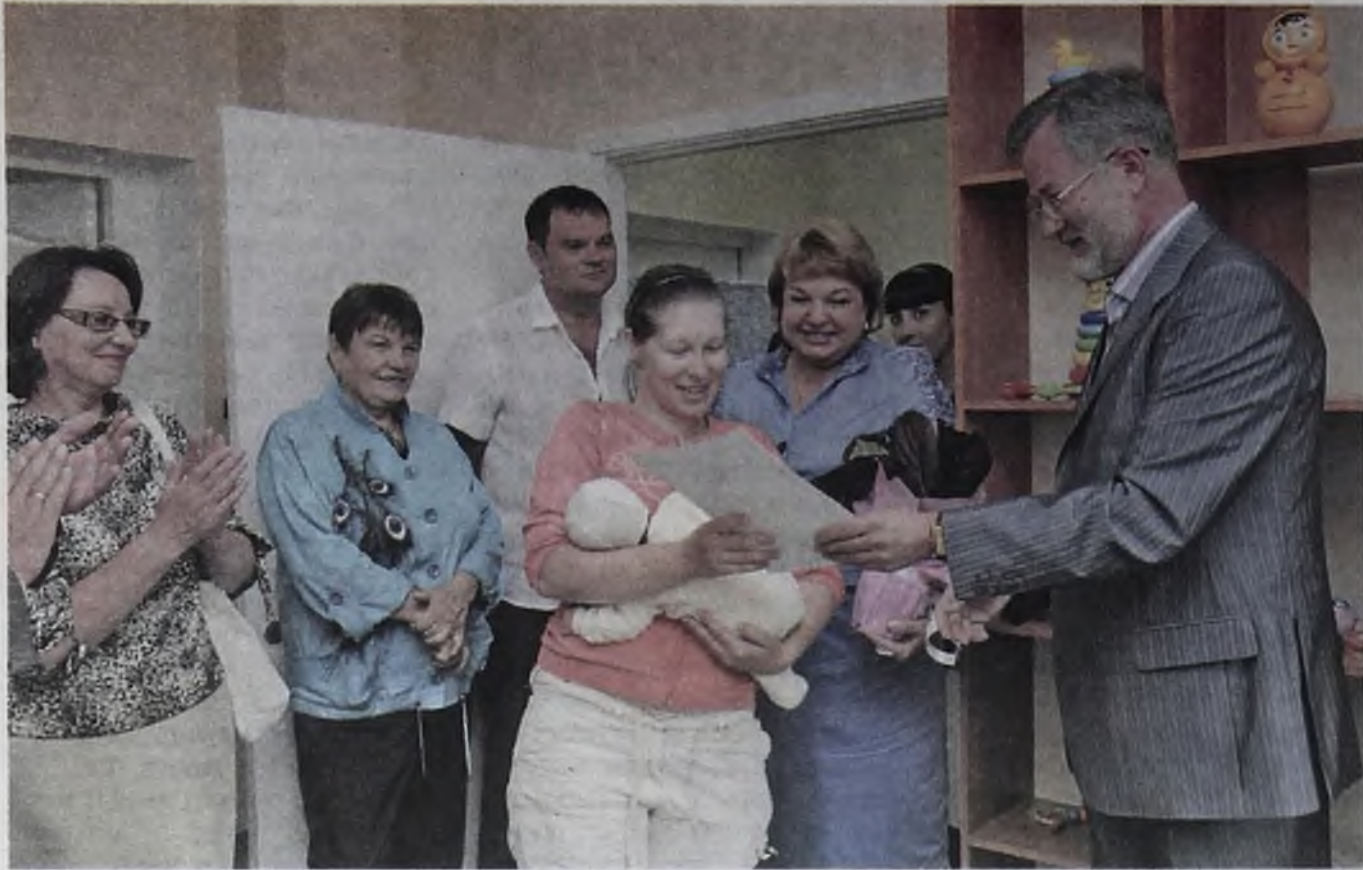
Мама, которые понимают важность грудного вскармливания, получили благодарственные письма от главного врача больницы