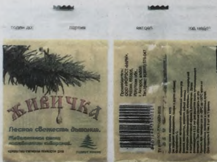
Наша продукция выглядит только так, как показано на фотографии, и мы гарантируем качество своего продукта

Мы вынуждены через газету довести до вас эту информацию. ООО «Форэст-Фарм» организовано в 2005 году, занимается производством средства гигиены полости рта из смолы лиственницы. Торговое название «Живичка». «Живичка» это 100-процентный натуральный продукт, вырабатываемый из