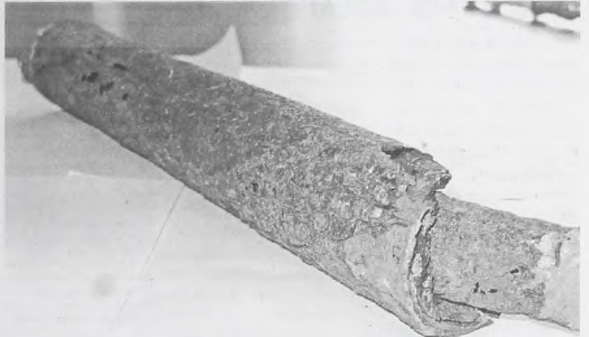
Труба из дома №18 в 8 микрорайоне. В вашем доме такие же трубы?

В этом есть юридические нюансы. Все зависит от того, какую форму управления многоквартирным домом выбрали сами жильцы. Если собственники договорились с жилищниками о непосредственном управлении, то управляющие компании вправе заключить договор с Горгазом от их имени. Если на общем собрании жильцов было принято решение о заключении