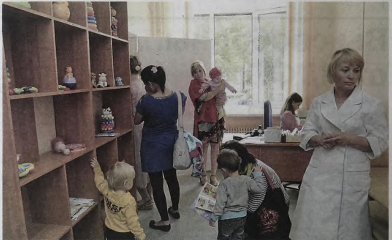
Помимо общения с медиком мамы имеют возможность собираться вместе и обмениваться опытом