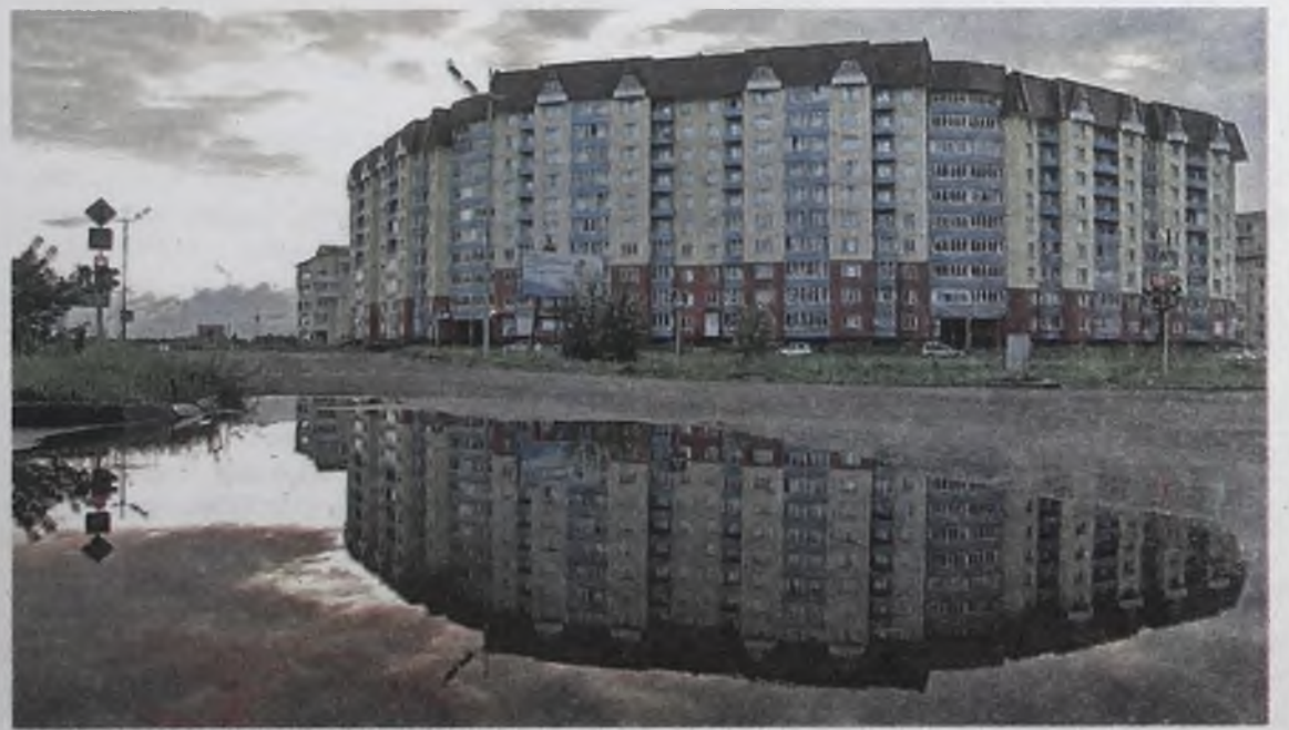
32 микрорайон. Отражение