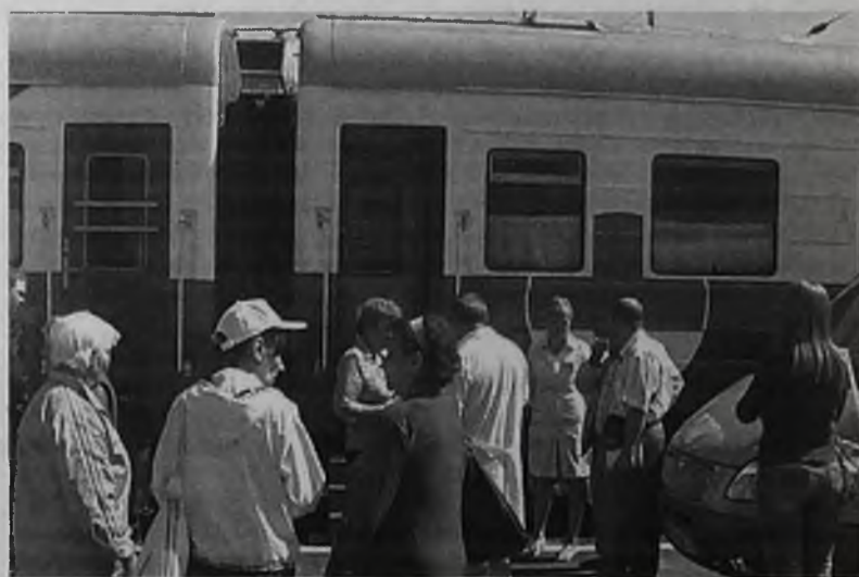
Специалисты «Академика Федора Углова» вели прием в течение десяти часов

Ольга Куриленкова