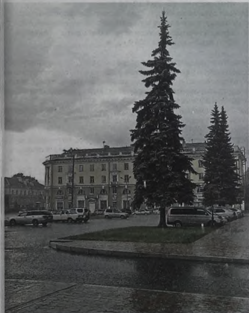
Площадь Ленина. Ливень настоящему художнику не помеха

Для нашего города это событие, потому что последний раз подобное издание увидело свет 29 лет назад. Как говорится, много воды утекло с тех пор. Изменились и город, и люди, и даже страна. Он позволил людям смотреть на город своими глазами: с высоты птичьего полета, ночью, днем, в дождь и погожий день.