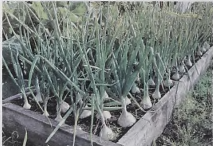
Сушить лук следует на солнце, так как солнечный свет убивает болезнетворные грибы и бактерии, находящиеся на поверхности луковички

Время выкапывания лука подскажут перья: как только они полегли – приступаем к уборке. Не затяги-