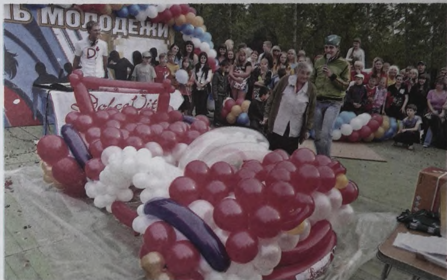
Главный приз — автомобиль из шаров от «Акварина» — выиграла бабушка и попросила заменить его деньгами. Был проведен аукцион — «транспортное средство» ушло за 1100 рублей