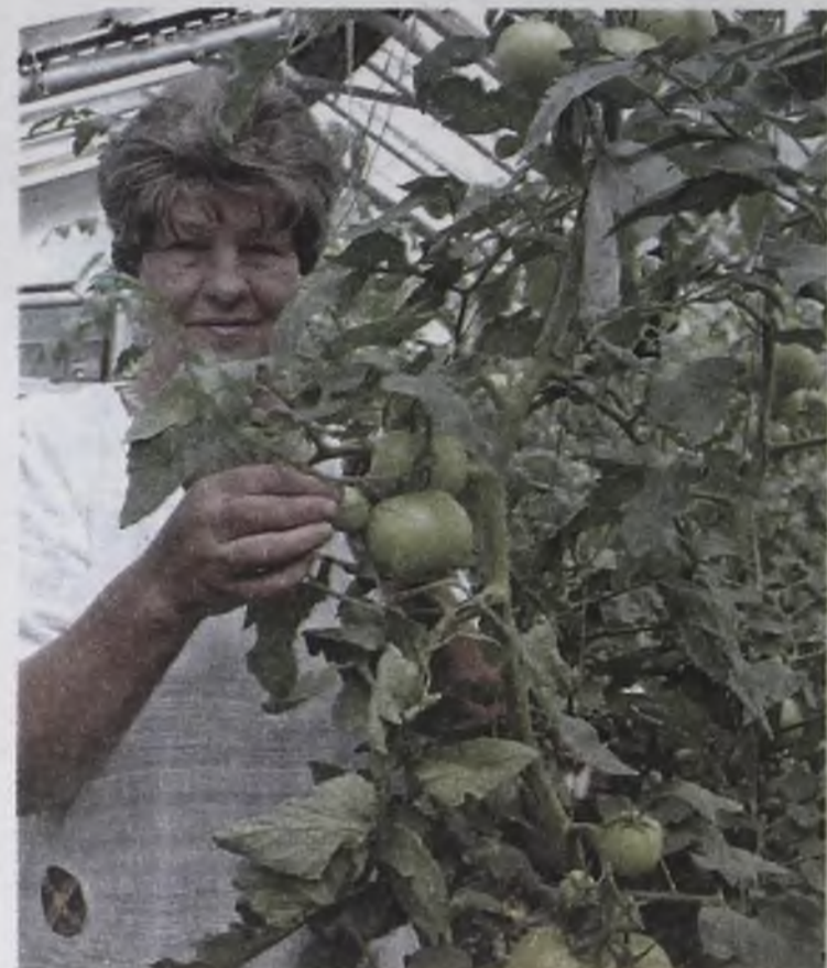
Сортоиспытания на своих дачных участках проводят около 150 членов клуба «Академия на грядках»

— Активно сотрудничаем с отечественными селекционерами. Долгая дружба нас связывает с фирмой «Гавриш». Её основали в 1990-х годах ведущие ученые академии им. Тимирязева, когда государство перестало финансировать селекцию, они организовали предприятие по производству семян. Сейчас высококлассные специалисты этой фирмы не только снабжают садоводов и сельхозпредприятия качественными семенами, но и обеспечивают научной литературой, книгами по овощеводству, плодово-ягодным культурам. Надо отметить, их семена, агротехника не уступают голландским технологиям. Фирма «Гавриш» раньше занималась в основном томатами, зато сейчас мы убедились, что у них самые