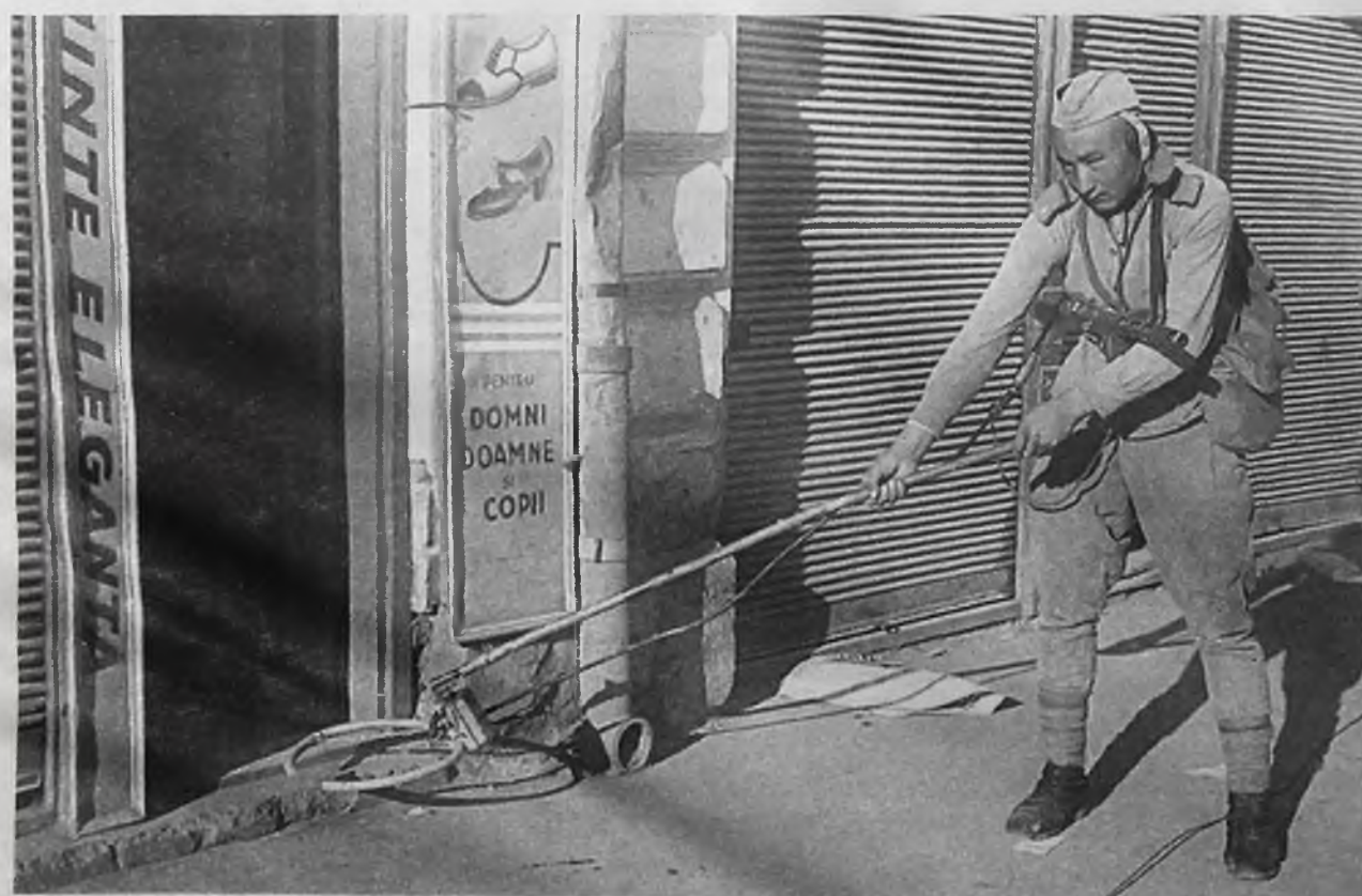
1944 год. Советский воин-казак проходит через город, освобожденный Красной армией

В остальных постсоветских республиках (за исключением стран Балтии) — менее 200 тысяч.