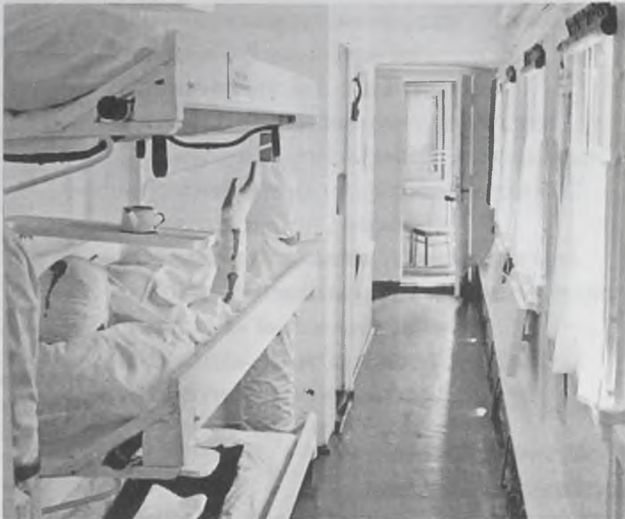
Так выглядел военный поезд, спасающий жизнь