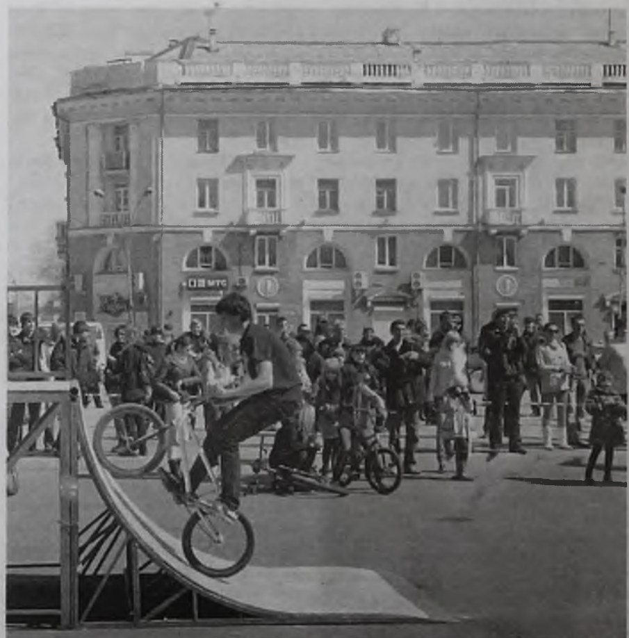
Здоровый образ жизни на словах и на деле. Здоровый и смелый

Коммунистам оказалось тесно на одной площади с будущим поколением.