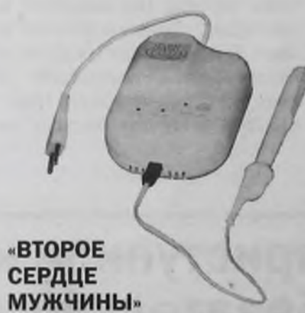
«ВТОРОЕ СЕРДЦЕ МУЖЧИНЫ»

– Специалисты завода регулярно выезжают и проводят в городе Ангарск заводские выставки-продажи. Позвонив на нашу Горячую линию 8-800-200-01-13 (звонок бесплатный), Вы узнаете, когда в вашем городе состоится ближайшая выставка-продажа, на ней Вы сможете проконсультироваться и приобрести АЛМАГ по заводской цене. Кроме того, только на такой прямой выставке-продаже возможны акции в виде дополнительных скидок для льготных категорий граждан. Подробную информацию обо всей продукции «ЕЛАМЕД» Вы найдете на нашем сайте www.elamed.com . ОГРН 1026200861620