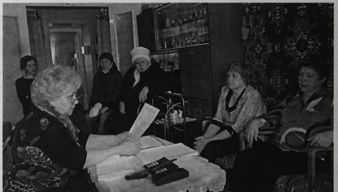
Счетная комиссия подводит итоги заочного голосования

Однако сумма 8 рублей 14 копеек с квадратного метра, предложенная жильцами, не окончательная. В ней не были учтены вознаграждение уп-