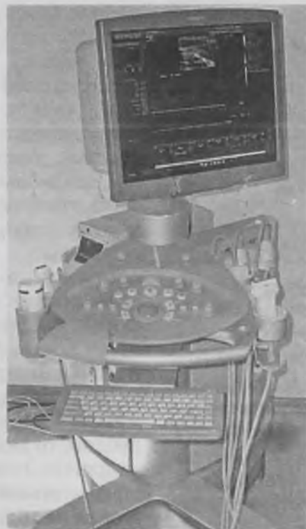
Ещё один шаг к лучшему. Теперь в БСМП работают 4 аппарата для проведения УЗИ. Если раньше пациенты могли ждать очереди на исследование месяц, то теперь ожидание длится максимум неделю.

выми специалистами, проводить для них так называемый «входной тест». Особенно это касается сотрудников так называемых «стрессовых» отделений — это диспетчеры скорой помощи, приёмный покой и регистратура. В эти дни у меня прохо-