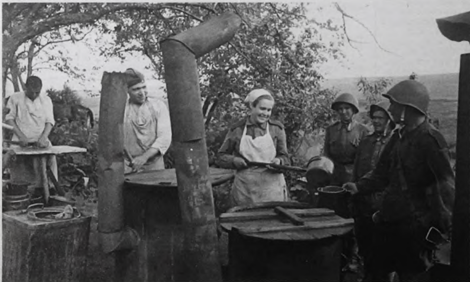
Выдача пищи на полевой кухне, 1942 год.