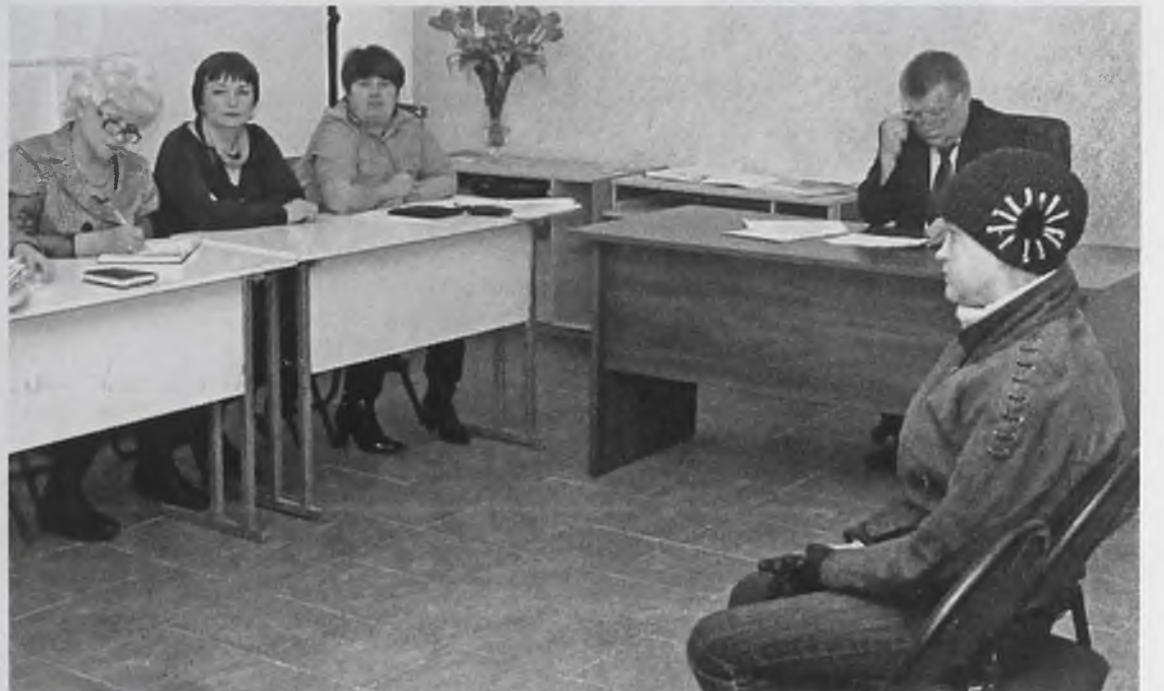
На выездном заседании комиссии по делам несовершеннолетних в рамках профилактической акции «Безнадзорник» было рассмотрено 23 персональных дела. Из них 11 по семьям, находящимся в социально опасном положении, 12 – по административным правонарушениям, совершенным подростками.

Юные любители выпить теперь находятся в поле зрения инспектора по делам несовершеннолетних.