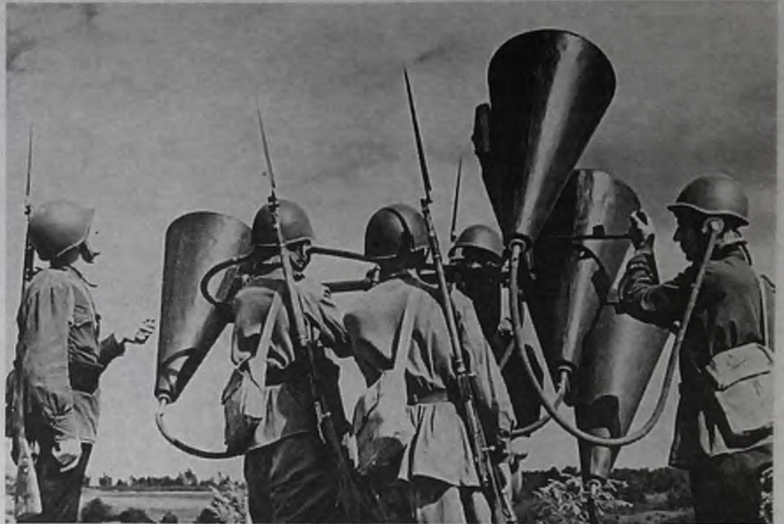
Слухачи – представители самой редкой военной профессии, 1942 г. На всю советскую многомиллионную армию слухачей было всего 2 – 3 сотни. Они «слушали небо» с помощью громоздких воронок, предупреждая о налетах фашистской авиации. Среди слухачей было много музыкантов и слепых людей, у которых особенно обострен слух. На протяжении нескольких часов надо было поворачивать рупоры и держать в одном положении голову. Требовались невероятные усилия, так как в воздухе было множество разных звуков: пулеметная дробь, взрывы снарядов. И этот грохот еще усиливали приборы. Не всякий мог выдержать, многие теряли слух.