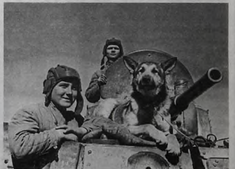
Друзья-танкисты, 1942 г.