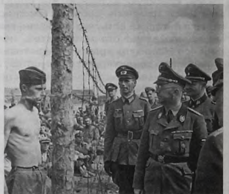
Рейхсфюрер СС Генрих Гиммлер инспектирует лагерь для советских военнопленных. Во время войны немецкий вермахт взял в плен примерно 5,7 млн. советских военнослужащих. До февраля 1942 года 3,3 млн. советских военнопленных умерли от голода, холода или были расстреляны. Для немецких охраняемых команд существовало распоряжение: «При проявлении малейших признаков сопротивления со стороны военнопленных, беспощадно применять оружие! По военнопленным, пытающимся бежать, немедленно стрелять (без окрика), стараясь в них попасть».