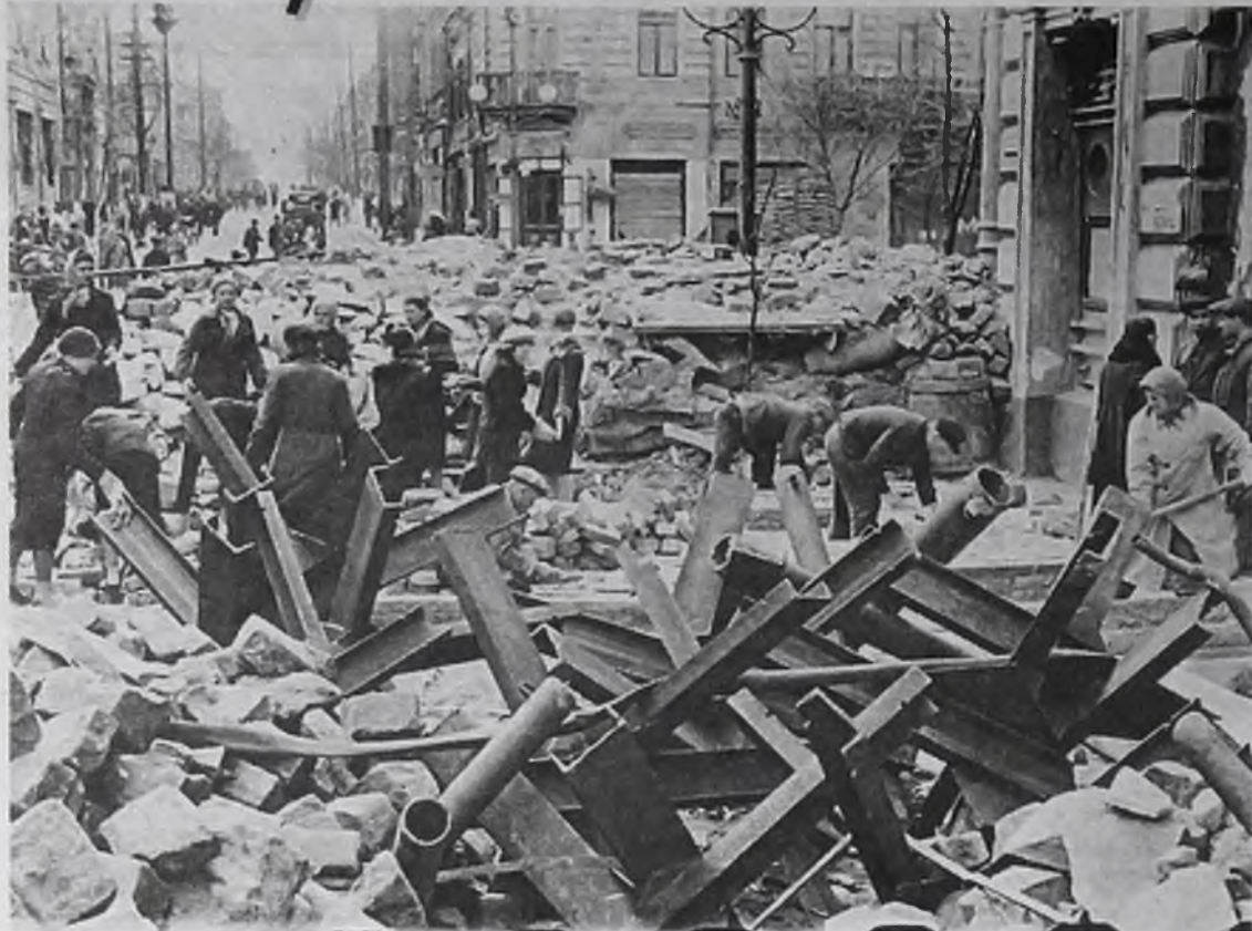
Жители Ростова-на-Дону строят баррикады, 1941 г. Эти баррикады 21 ноября сдерживали фашистские танки, которые двигались прямо по тротуару. На них с верхнего этажа дома бросились вниз две девушки, обвешанные бутылками с зажигательной смесью. Как их звали, и кто они были – мы, наверное, так никогда и не узнаем.