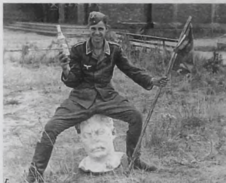
Немец отдыхает, 1942 г. Не стоит забывать, что воюют государства, а умирают обычные люди. И эти обычные люди также нуждаются в разрядке между боями. Так в России развлекался немецкий солдат, который потом послал эту фотографию своей девушке.