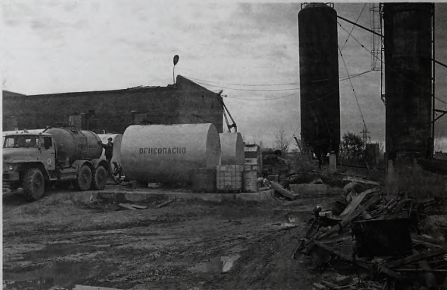
Нефти в свободной продаже нет, а мини-НПЗ работают