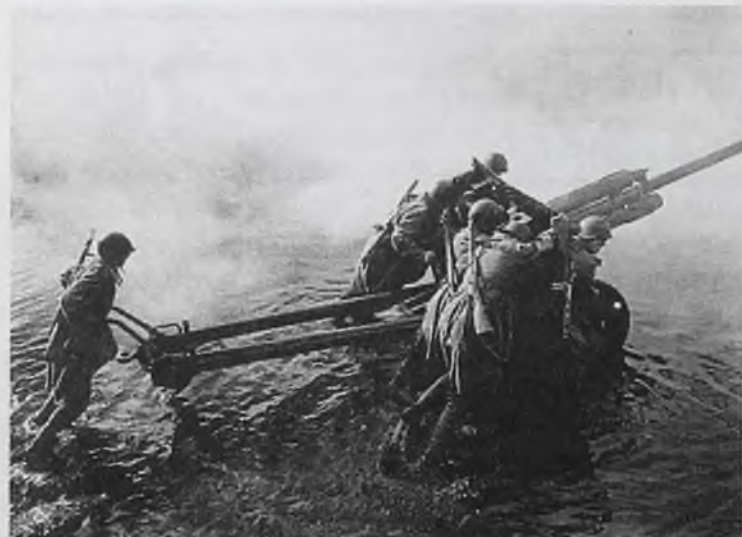
Передача советского артиллерийского расчета, 1944 г. Среди фотографий, сделанных в годы Великой Отечественной войны, есть немало снимков, которые можно не просто назвать «свидетельствами эпохи», а настоящими произведениями фотоискусства. Данная фотография – одна из них.