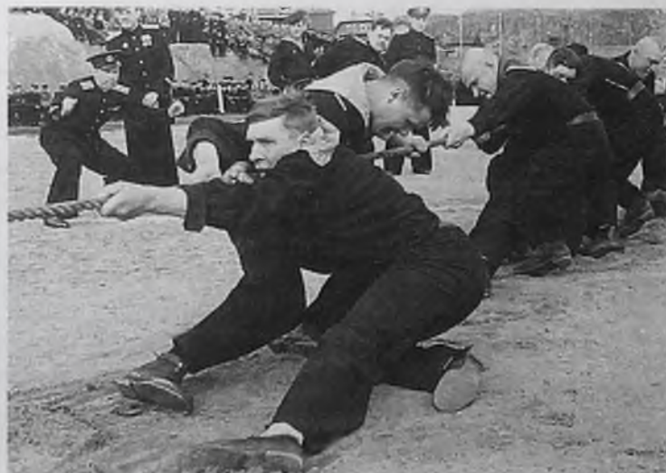
Спартакиада на северном флоте, 1942 год. К началу Великой Отечественной войны в стране было свыше 100 тысяч спортсменов-разрядников, более 3105 тысяч спортсменов. Но спортивные традиции не угасли даже в суровые военные годы. Так, в декабре 1941 года в Москве был разыгран Кубок по хоккею с мячом, состоялись конькобежные соревнования, прошел шахматный чемпионат на первенство города. А в 1942-м была эстафета по Садовому кольцу и Спартакиада на флотах.