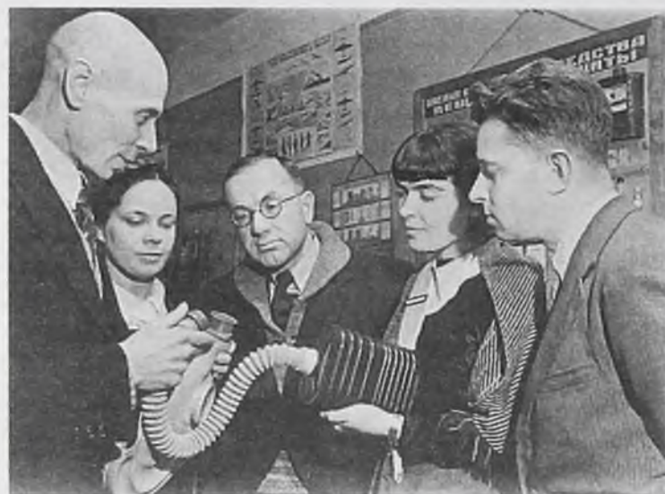
Актер Игорь Ильинский на занятиях оборонного кружка, Малый театр. 1941 год. В начале войны массовое военное обучение трудящихся было максимально приближено к требованиям современной войны. Были организованы оборонные кружки и учебные подразделения, занятия в которых проводились на пересеченной местности. В 1941 году насчитывалось 156 тысяч учебных групп, 26 680 команд и 3500 отрядов, в которых различными военными специальностями овладевало 2 600 тысяч человек.