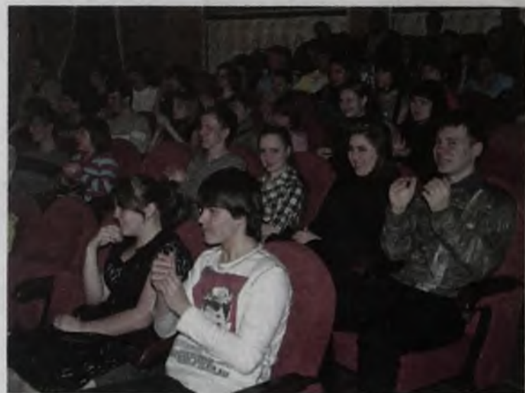
Зал постоянно взрывался от хохота. Команды шутили лихо и весело. Теперь ангарчане знают, что наши ленивые маршрутки на самом деле катают вату...

Ангарская лига КВН становится всё более популярной, юмор качественней, зрителей с каждым разом всё больше. В ДК нефтехимиков пять команд