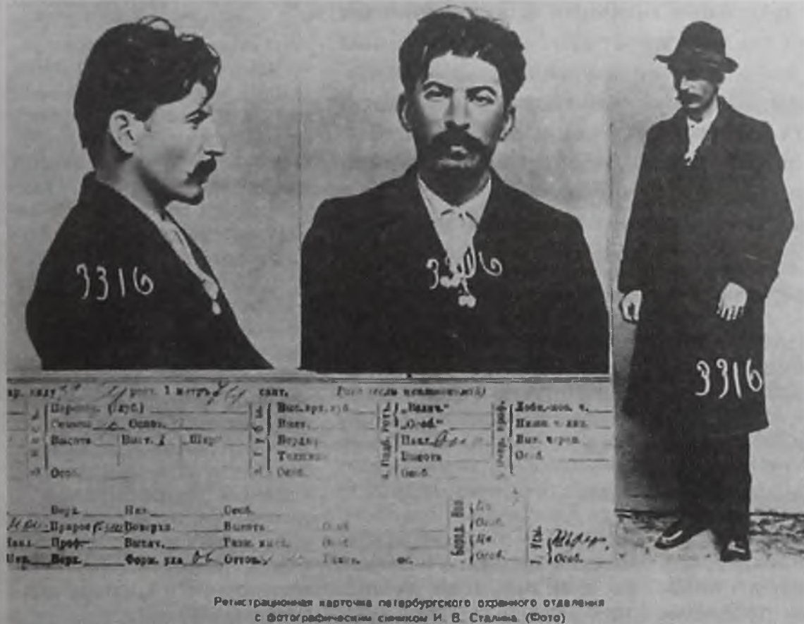
Регистрационная карточка ленинградского районного отделения с фотографическим снимком И. В. Сталина. (Фото)

В ближайших выпусках мы продолжим публикацию материалов о Сталине, подготовленных К.А. Хамагановой