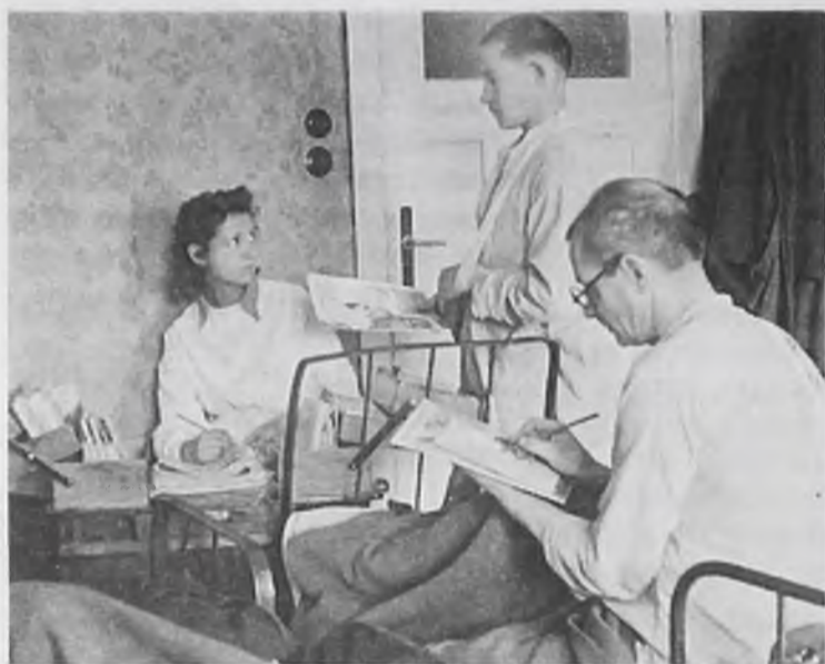
1942 год. Медсестра в палате эвакуационного госпиталя

Для тех, кто воевал, кто падал, сраженный пулей или осколком мины, нет в мире более близких людей, чем фронтовые медики, возвращавшие жизнь. С какой мольбой и надеждой смотрели мы, раненые солдаты и офицеры, на медицинскую сестру, санитаря, врача. Понять это чувство признательности к тем, кто вынес тебя с поля боя, а потом в госпитале вернул в строй, может только тот, кто сам это пережил.