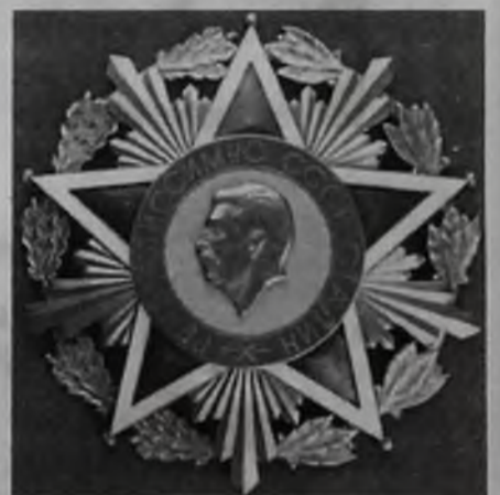
Тот самый знаменитый «пробник» несостоявшегося ордена

Но вернемся к ордену. Вопрос о нем поднимался еще раз, в 1953 году, сразу после смерти Генсека. Но эскизы не лежали без дела. Был сделан один пробный