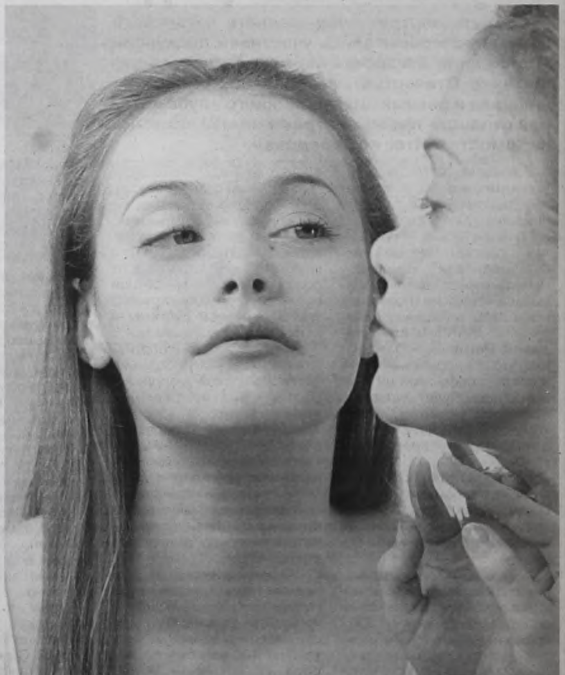
Красота требует заботы каждый день

– Я консультирую по предварительной записи по понедельникам в МАНО «Лечебно-диагностический центр», на консультацию пластического хирурга (мою или моих коллег, работающих в нашем центре) можно записаться по телефону: 95-20-02, 89500850221. Операции проводятся в Иркутске в медицинском центре «Элит», а послеоперационное наблюдение и реабилитация возможны на базе МАНО «ЛДЦ».