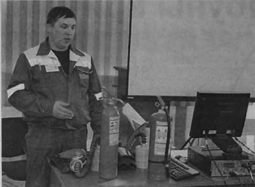
Отношение к охране труда и безопасности сотрудников, которое сформировано в компании «САН ИнБев», откровенно говоря, приятно удивляет

Во время проведения тренингов и презентаций в