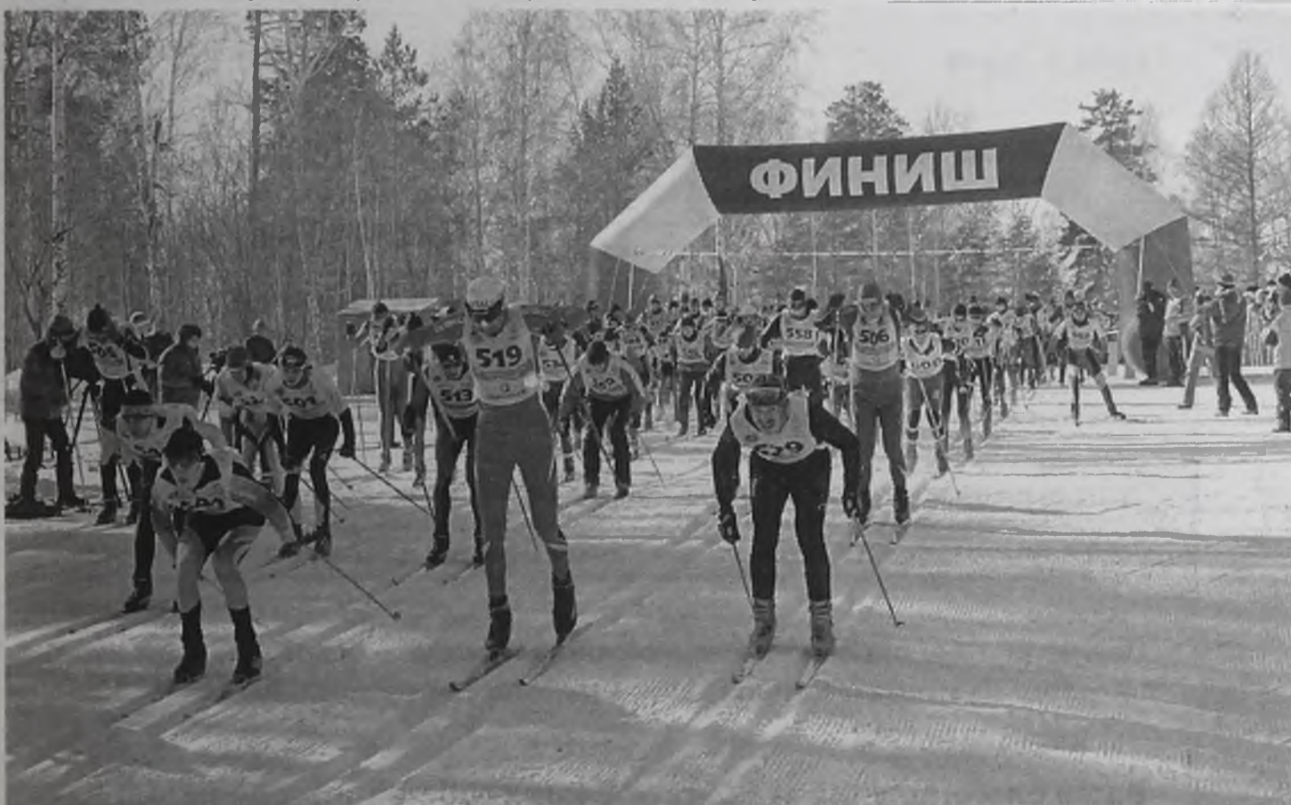
В первый же день эксплуатации лыжного комплекса в соревнованиях, организованных ЗАО «Стройкомплекс», приняли участие 186 спортсменов разного возраста из Иркутска, Шелехова, Железногорска-Илимского, Братска, Усолья, Саянска и Ангарска.