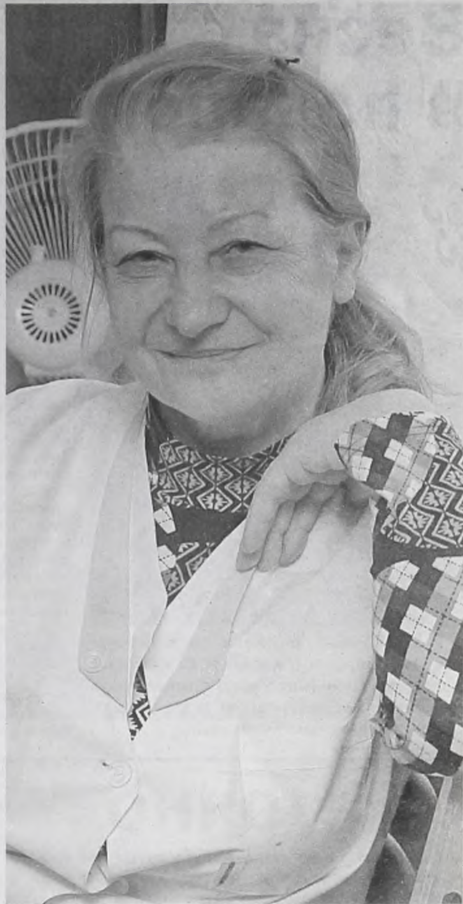
Желаю вам здоровья и спокойствия. Берегите себя!