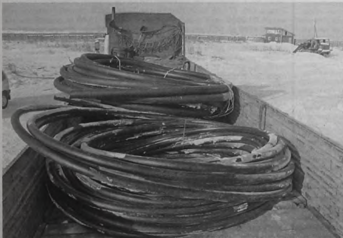
Изъяли добро, нажитое «непосильным трудом»