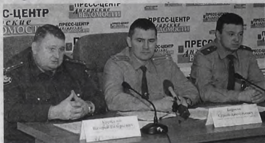
Итоги работы за прошлый год подвели руководители ГИБДД на встрече с журналистами в пресс-центре газеты «Ангарские ведомости».