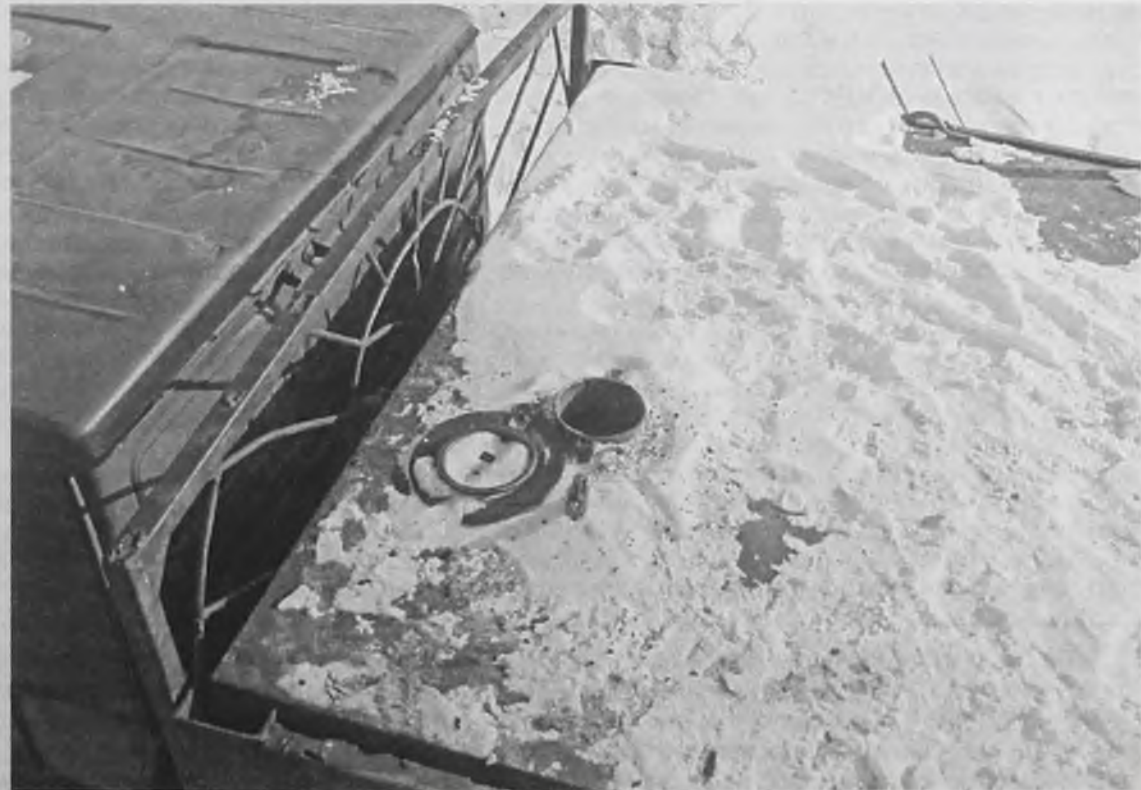
КаМАЗ с секретом в кузове