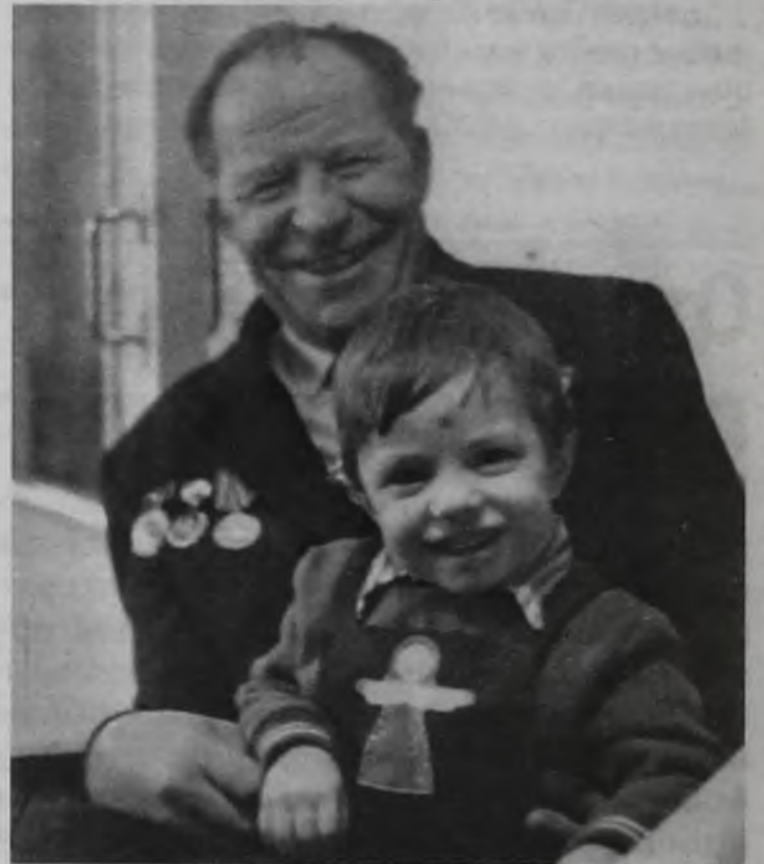
Для ветерана главное награда – внук