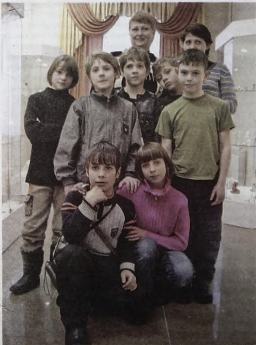
Дети умеют интуитивно общаться с ангелами и свято верят в них