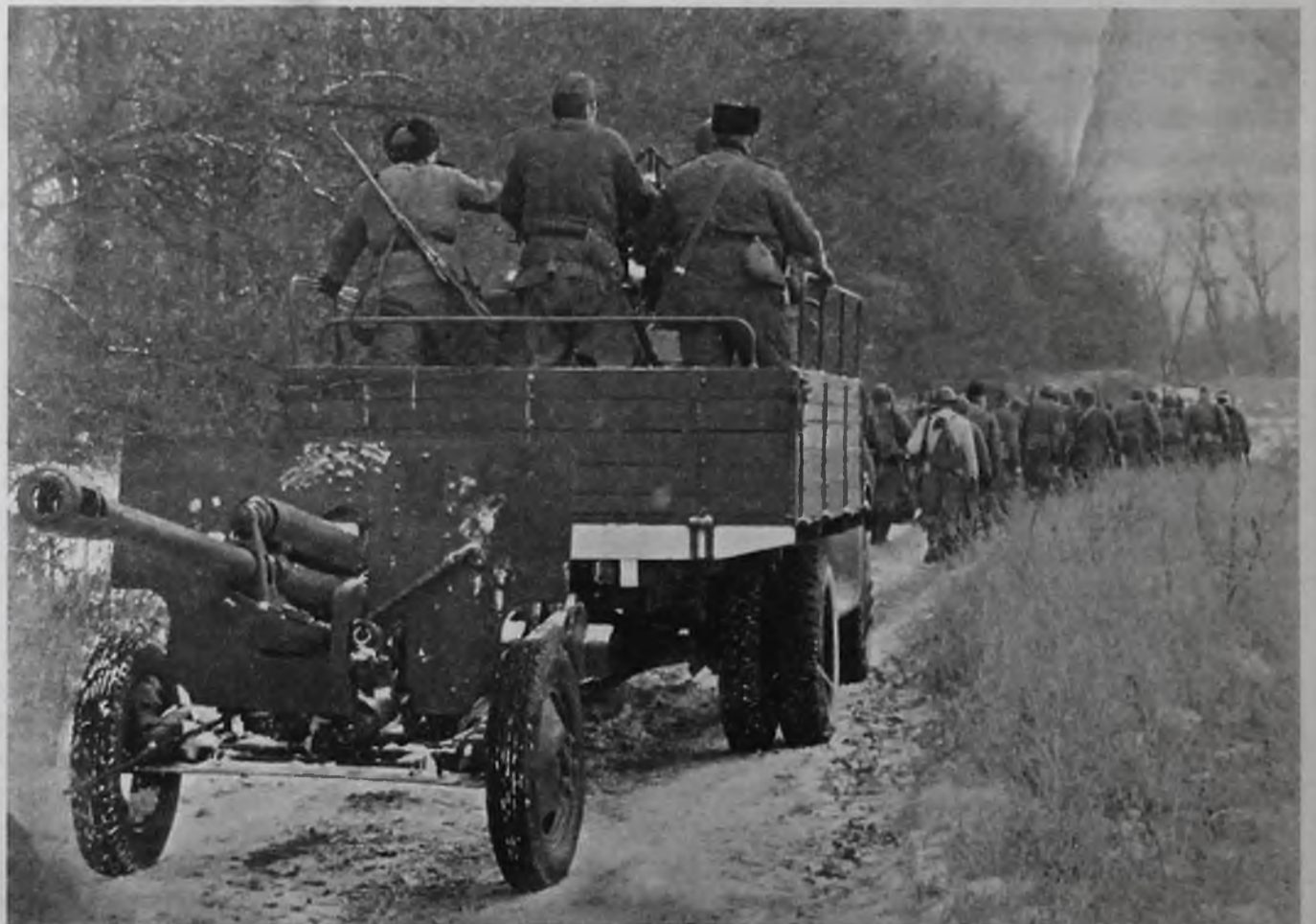
Подготовила Ирина Сергеева

«На снежном поле темнели изуродованные танки. В низине лежали убитые верховые лошади, а рядом с ними, распластавшись на снегу, в черных кубанках, лежали погибшие конники 2 кавалерийского корпуса. Несколько дней тому назад они мчались здесь лавиной на прорыв к железной дороге...»