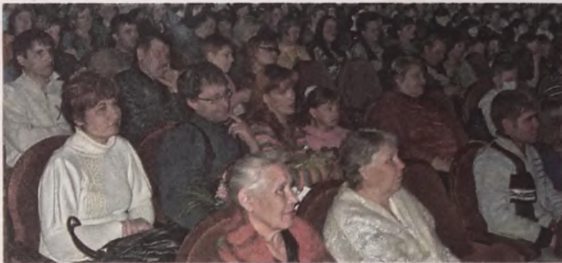
Пустого места в этом зале не было. Зато было много аплодисментов, переходящих в бурные овации.