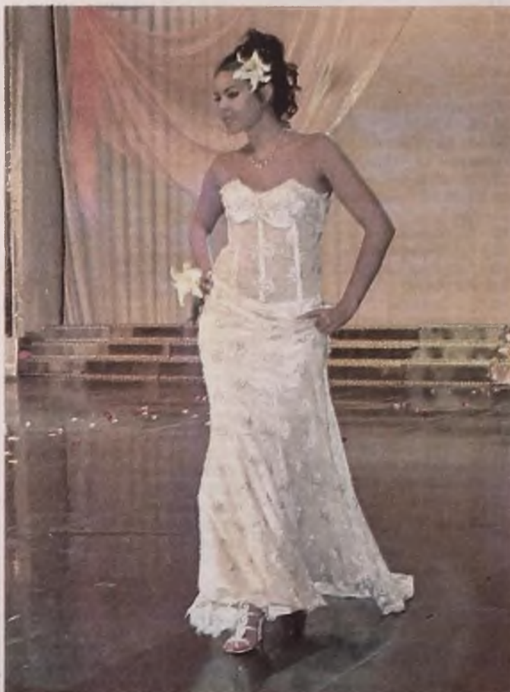
Коллекция свадебных платьев, представленная на ангарском фестивале, ничуть не уступает по красоте и изысканности моделям мировых марок.