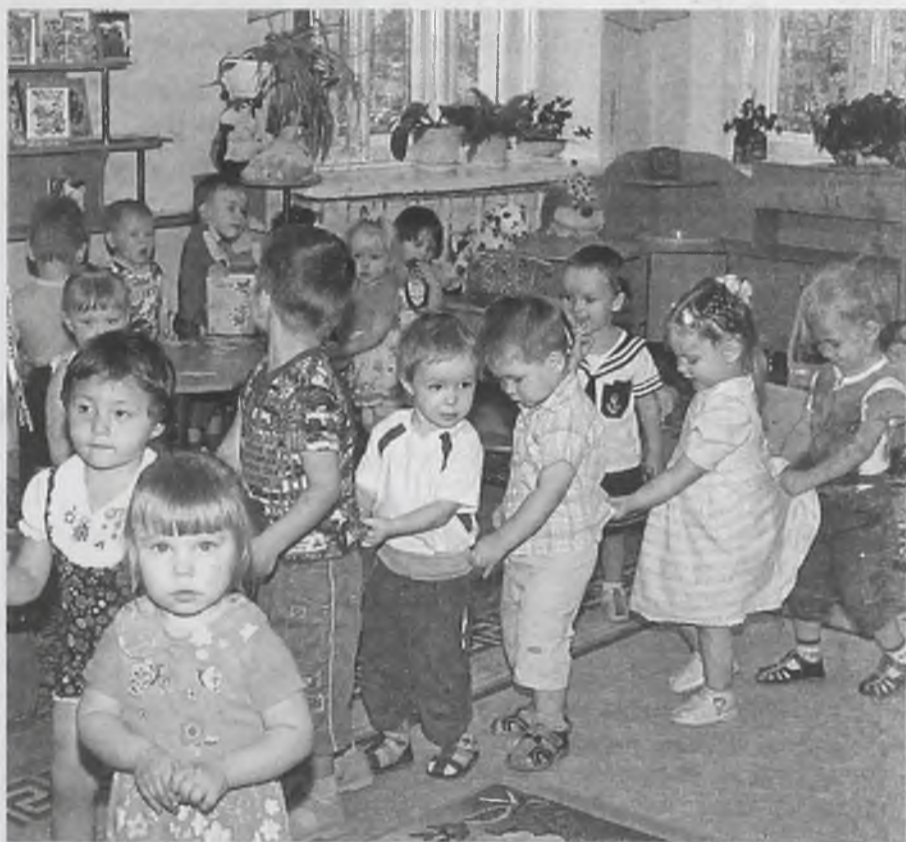
Если нет возможности оставить ребёнка дома, позаботьтесь о профилактике, отправляя его в садик

нее относиться к визиту доктора на дом, – продолжает Лариса Леонидовна . – Сейчас врачу дорога каждая минута рабочего времени, ему некогда стоять под закрытой дверью у подъезда и ждать, когда откроют. Недавно был такой случай: вызвали доктора, он пришёл, а его не пустили в квартиру. Затем мамочка перезванивает, спрашивает, почему на вызов не пришёл педиатр? Мы говорим: «Доктор приходил, ему не открыли дверь», а она отвечает: «Я была в ванной». Необходимо в такой ситуации относиться с уважением друг к другу, и, в первую очередь, к доктору, он ра-