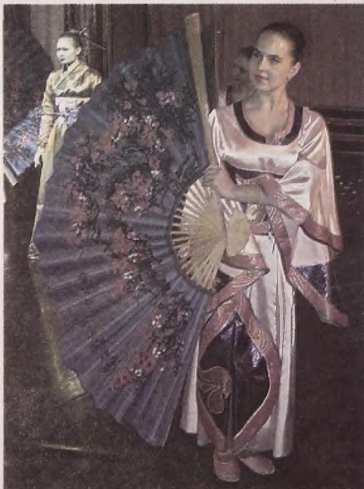
За кулисами менялись наряды, а на сцене - девушки: с моделей на танцовщиц.

Франция – законодательница моды? Тогда Ангарск – Родина лучших модельеров. Надо же: впервые прошёл фестиваль-показ работ наших кутюрье, и сразу ТАКОЙ успех... Правильно говорят организаторы, хорошо, что это был фестиваль, иначе как определить среди этого созвездия талантов лучшего? А так все смогли, как говорится, на других посмотреть и себя показать. На что ангарчане с удовольствием собрались полюбоваться, так это на показ модной одежды. Одиннадцать модельеров представили свои работы на суд горожан. Отличились все, потому что каждый участник оказался способен на всё: от классики до авангарда.