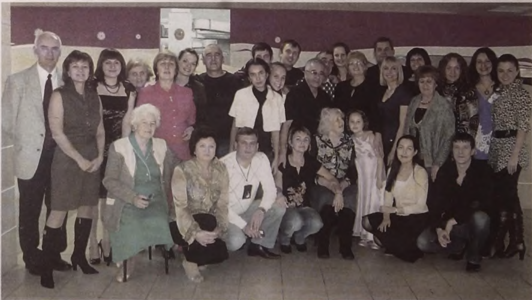
На торжестве в честь юбилея собрались самые близкие, а их ни много ни мало 50 человек.