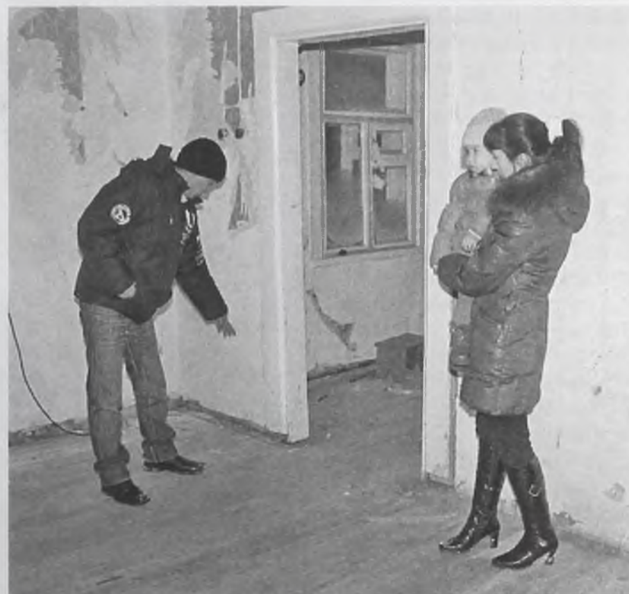
Рады бы в доме жить, да беда не пускает