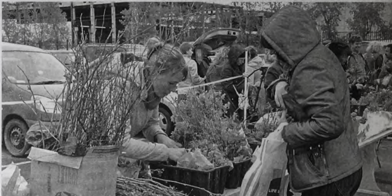
У нас – купец, а у вас – товар. Качественный ли?

плекс мер по вопросам защиты прав потребителей в соответствии с законодательством. Проводятся консультации, рассматриваются устные и письменные обращения потребителей. Разре-