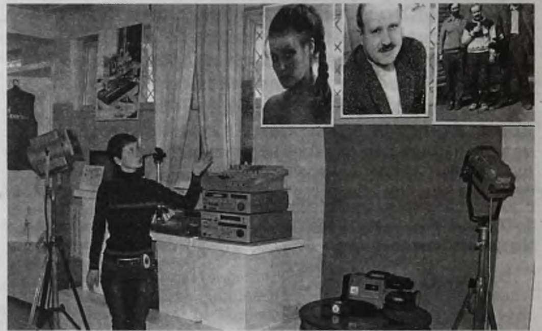
Микшер, рекордер, плеер. Журналистам-телевизионщикам, начавшим карьеру в течение последних пяти лет, такое оборудование уже незнакомо