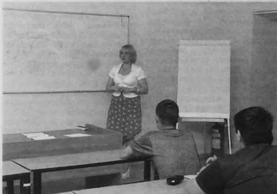
Предупрежден – значит вооружен. В том числе и против СПИДа

Еще один плюс проекта – в максимально короткие сроки были эффективно использованы все инфор-