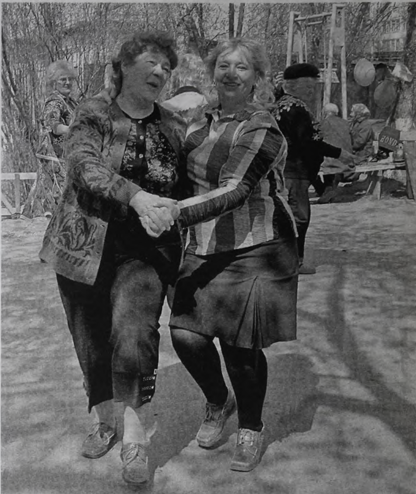
Что бы ни говорили, а жители 120 квартала считают, что с соседями надо дружить. Тогда и жить веселее.

– Бывают. И это нормально – иметь соседа из серии «Ты мне, я тебе». Это не обязательно называть дружбой и не обязательно слишком глубоко внедряться в жизнь другого человека. И, все же, я бы рекомендовала соблюдать дистанцию. Прежде чем с кем-то хотите установить такие отношения, понаблюдайте за собой, поприсматривайтесь. И если начинает что-то раздражать, то потихо-