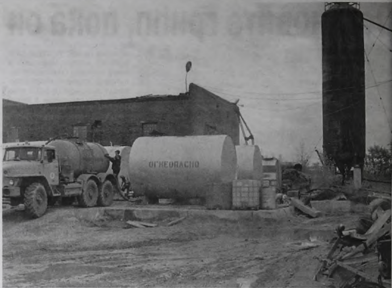
На первый взгляд – обычный цех, на самом деле – криминальное производство

На территории данного предприятия были обнаружены пять наземных ёмкостей,