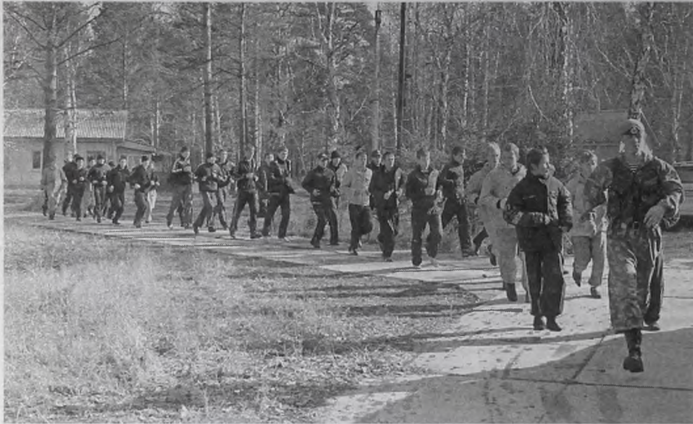
Продолжение. Начало на стр. 1

Но зачастую трудные ребята живут в неблагополучных или неполных семьях, где родители не могут самостоятельно справиться с подростками сыновьями. В комиссии по делам несовершеннолетних в основном работают женщины и подход к юным правонарушителям у них больше материнский. Выезд на базу пентбольного клуба «Комбат» должен показать, что значит суровое мужское воспитание. «Привыкайте, вы мужчины!» – это была ключевая фраза двух суровых дней.