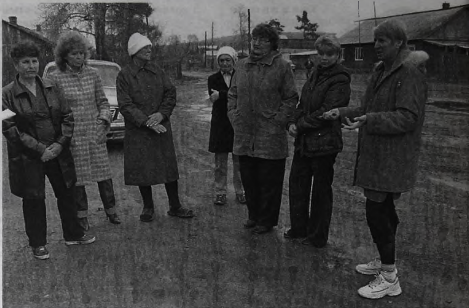
Недетские проблемы мегетских школьников не могут решить взрослые

Эти же проблемы знакомы ученикам из поселка Стеглянка,