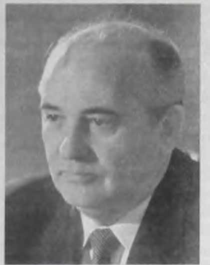
Михаил Горбачев, экс-президент СССР

«Люди мудрее, чем политики, которые под надуманными предложениями изобретают причины для беспокойства. Научиться жить вместе – важная наука».