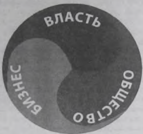
«Бизнес, власть, общество – новые возможности, новые перспективы»

– Своевременное информирование родителей о росте социально значимых заболеваний, вредных привычках (малопод-