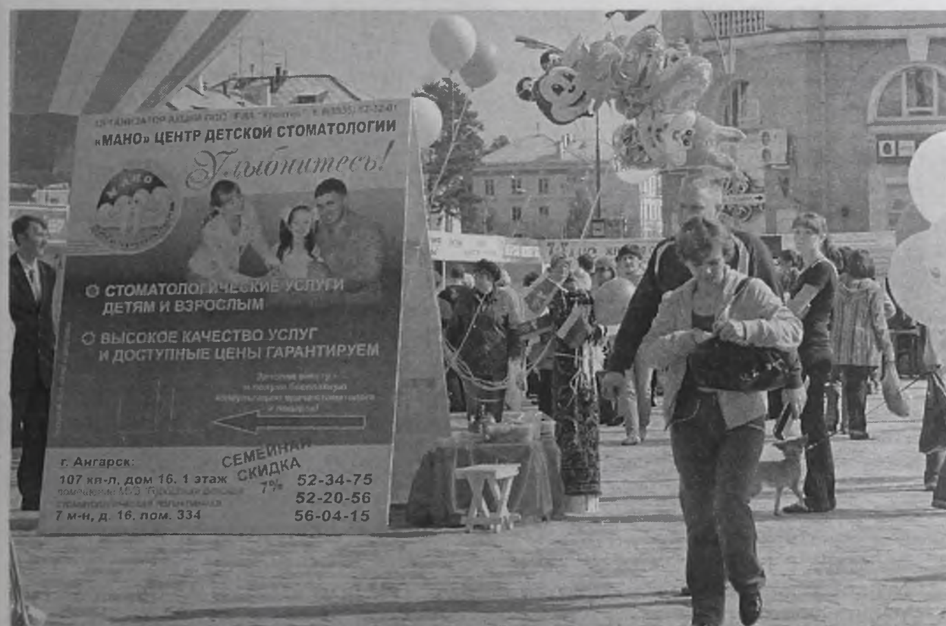
Свою продукцию и услуги представили многие предприятия города