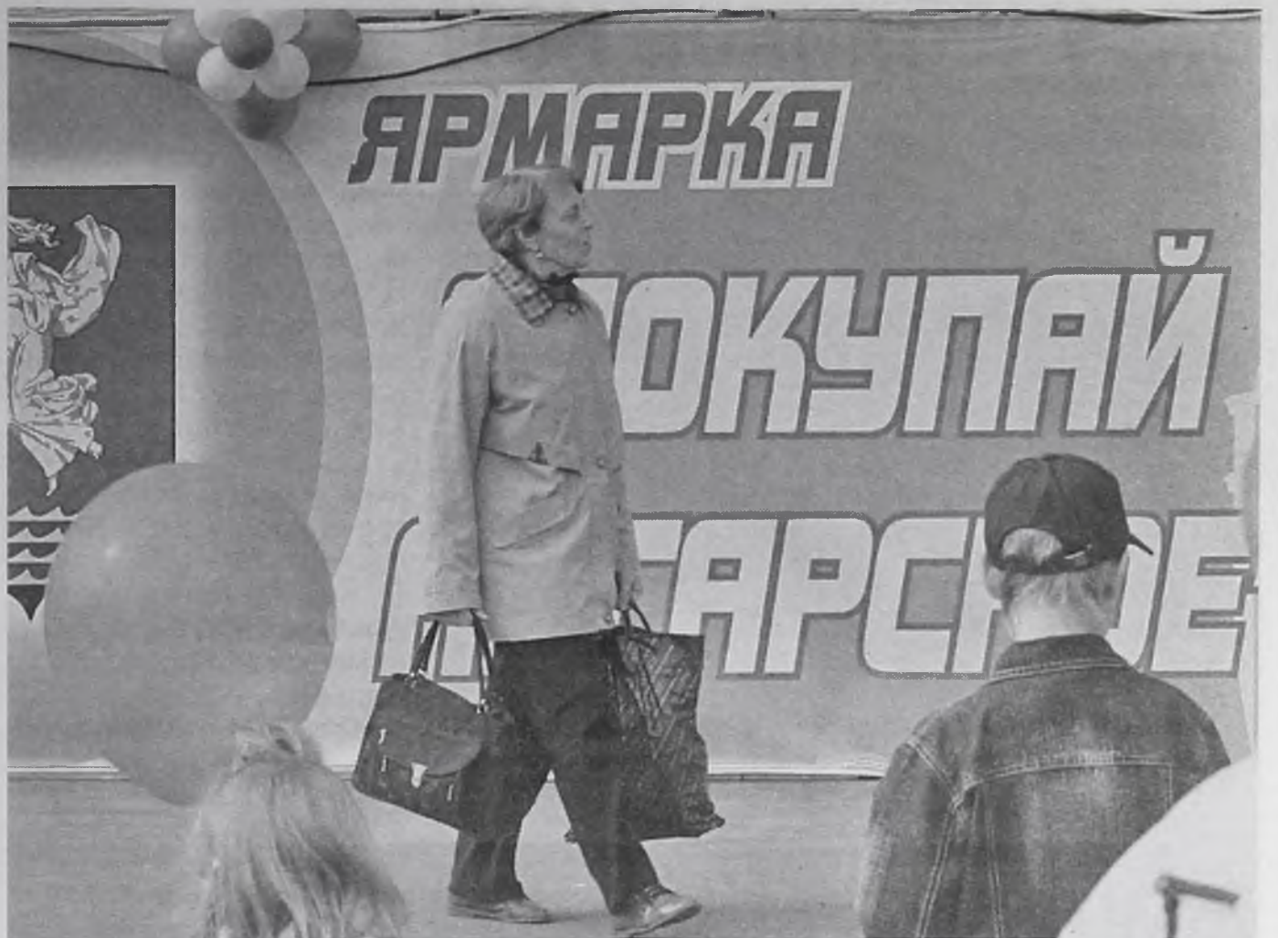
Ярмарка вызвала большой интерес у ангарчан