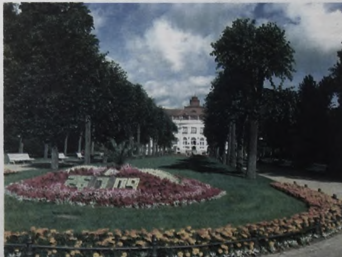
На городской клумбе каждый день выкладывают цветами дату наступившего дня

(Продолжение следует) Екатерина Смирнова