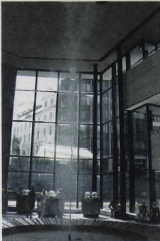
Гейзер № 1. Высота столба воды достигает 12 метров!

Рождение курорта связано с благодатным лечебным воздействием теплых минеральных источников. Это отобразилось не только в истории, архитектуре и экономике города, но, кажется, витает в воздухе здешних мест.