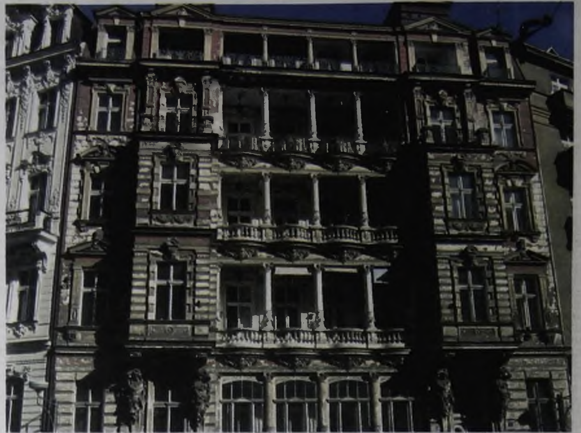
Город выглядит, словно витрина кондитерской, в которой выставлены пышные кремовые торты и пирожные безе

А началось все на королевской охоте. Догнать оленя никак не удавалось. К тому же болела раненая нога. Между деревьями показался ручей, от которого шел пар. Карл IV дернул поводья, конь оступися и оказался в ручье по брюхо. Вода залила сапоги и края камзола.