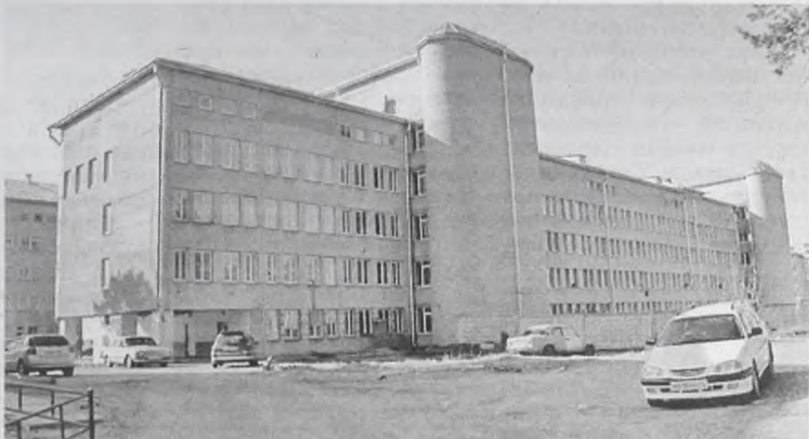
По окончании работ в распоряжении перинатального центра будет порядка 5 тысяч квадратных метров площади