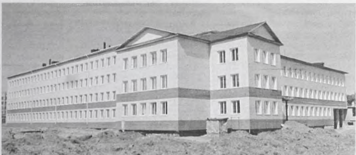
При достаточном финансировании возведение школы можно завершить за два года