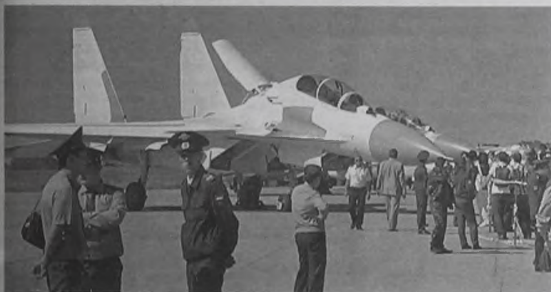
Большой соблазн – забраться в кабину пилота

небесной техники получили по оценке ГУВД Иркутской области, собралось на летном поле около 45 тысяч аплодисменты многочисленных зрителей, которых,