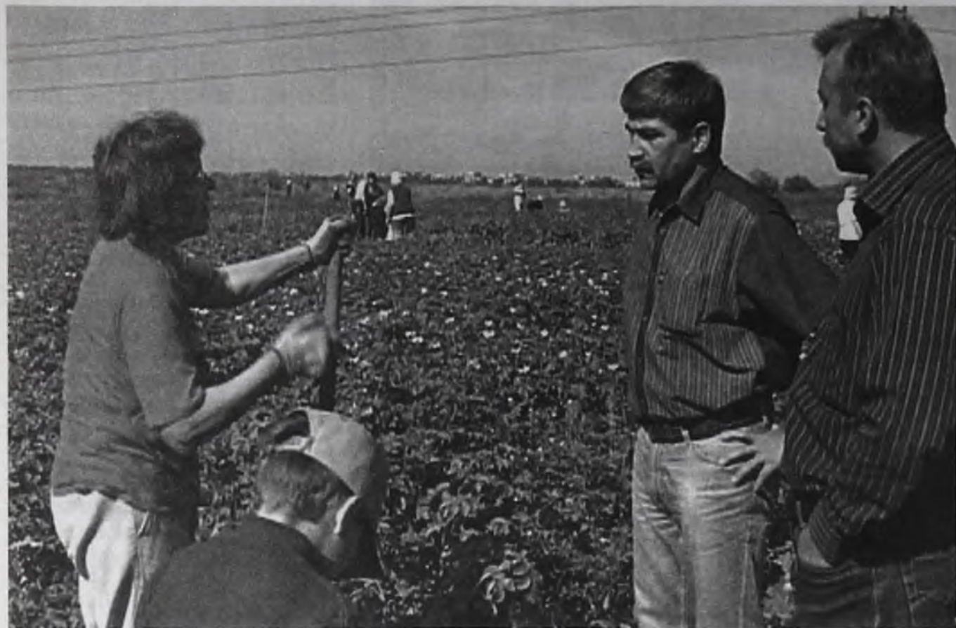
Пользуясь случаем, ангарчане смогли пообщаться с главой города в неформальной обстановке

Как в старые добрые советские времена: люди копают картошку, улыбаясь, шутя, одним дружным коллективом. Совместный труд во время экономического кризиса – моральная и материальная поддержка городской власти. Двести ангарских семей теперь обеспечены «вторым хлебом», благодаря неравнодушным ангарчанам и городской администрации.