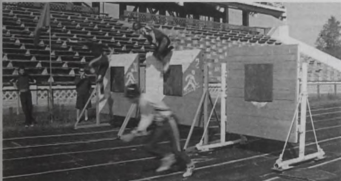
Они давно победили страх и довели все действия до автоматизма, поэтому и на пожарах работают четко и слаженно

специализированной пожарной части Ангарского электролизного химического комбината. Вторым результатом у огнеборцев из Братска. Победители соревнований получили в награду памятные вымпелы, медали и ценные подарки.