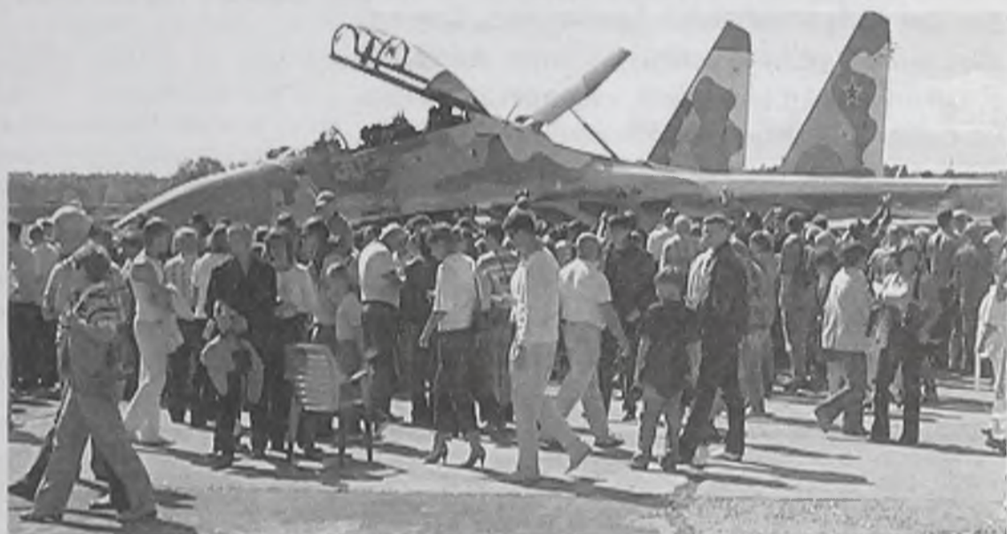
Зрители «запасаются» впечатлениями: в следующий раз подобное шоу пройдет через 5 лет