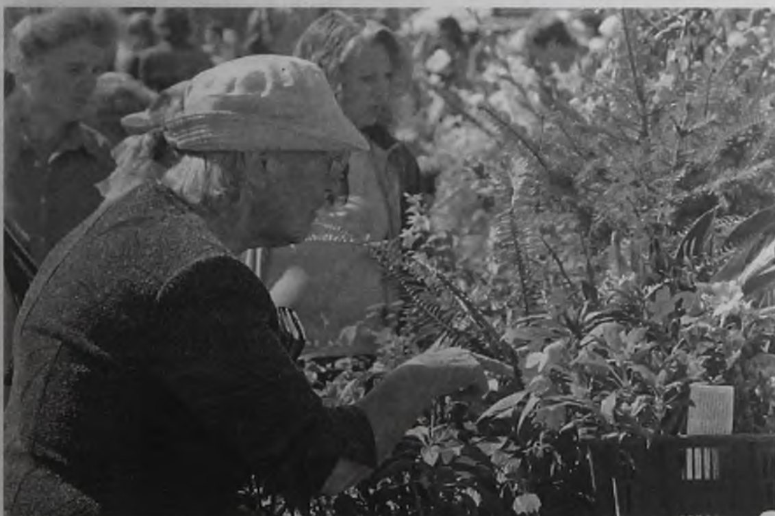
Ангарские ярмарки радуют души, глаза и кошельки садоводов

– Овощи успешно выращиваю на даче, но ярмарку посещаю каждый год – меня привлекает возможность приобрести саженцы кустарников, которых у меня нет. Вот уже купила два вида многолетних цветов! Они должны приукрасить мои 10 соток!