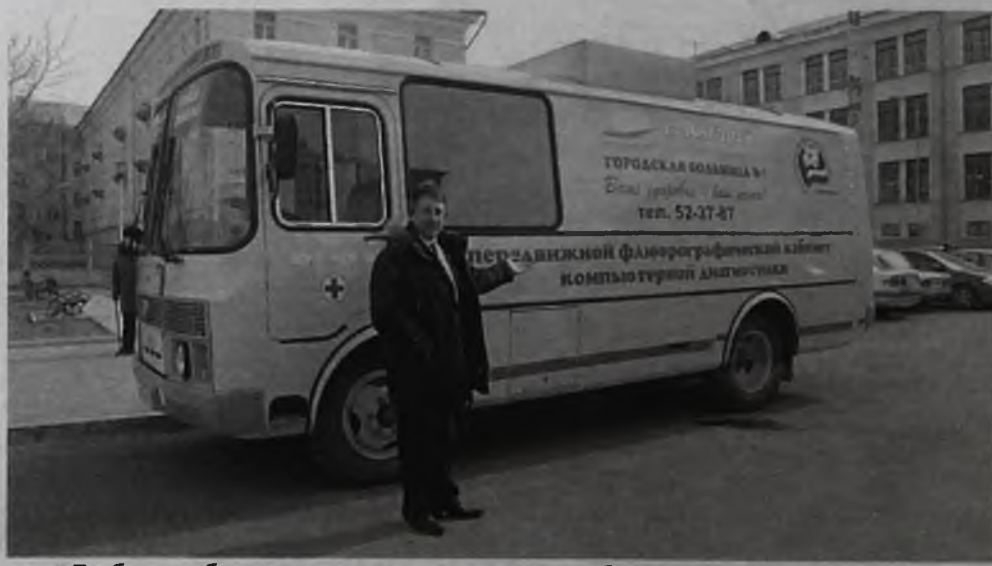
В области будет медпоезд, а у нас уже работает мобильный медкабинет

Пресс-служба Губернатора Иркутской области и Правительства Иркутской области